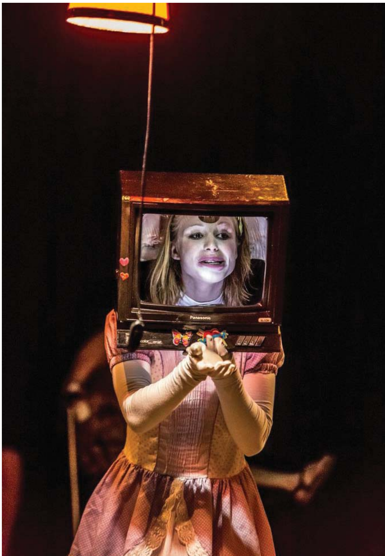
A menina torta (2013). Direção: Marcio Cardoso e Thayná Rodrigues. Atriz: Carla Ramos.