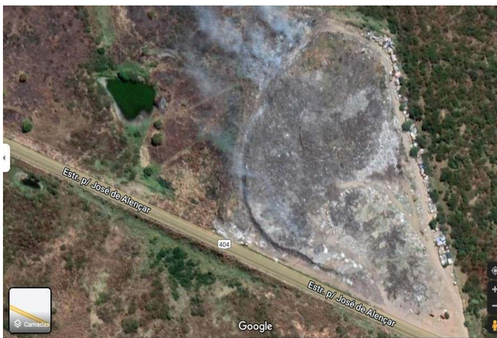
Figura 1 - Sobre o lixão - Imagem do lixão da cidade de Iguatu 8

De acordo com o Plano Municipal de segurança alimentar e nutricional (2015) da cidade de Iguatu, o lixão se situa às margens da CE-282, distante 5 km da zona urbana. Ele começou a ser formado no ano de 1989 e encontra-se saturado e recebendo lixo há mais de 30 anos (2015). 9