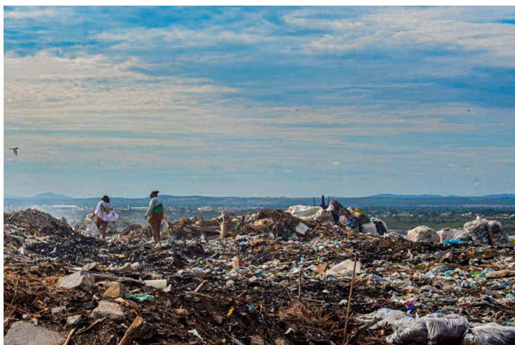
Figura 2 - A vista mais impactante da cidade Iguatu - Lixão da cidade de Iguatu 10

De acordo com o pesquisador Henrique de Melo Carneiro, em sua dissertação de mestrado intitulada Aspectos socioambientais da geração e gestão de resíduos sólidos em comunidades de baixa renda em Iguatu – estudo de caso do bairro Chapadinha (2011), o bairro teve origem em 1970. As famílias da Chapadinha