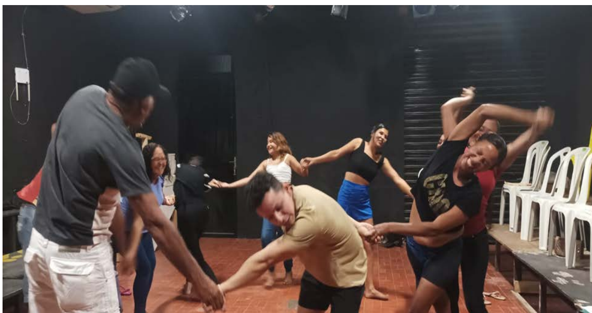
Figura 5 - redemoinho de corpos . Oficina com artistas-criadores/as da Chapadinha na sede da Companhia Ortaet. Acervo pessoal da Companhia Ortaet. Foto: Aldenir Martins, 25 ago. 2021

Se analisarmos que, dentro da Companhia Ortaet, em seus vinte e seis anos, foi a primeira vez que o grupo se colocou em um trabalho de campo tão direcionado, podemos dizer que tivemos sorte. Este grupo de seis pessoas demonstrou, durante estes dois anos de vivências, não apenas disponibilidade, mas desejo. Desejos de oficinas, desejo de ver um espetáculo que realmente representasse os seus anseios e desejo de fazer teatro, “apresentar”, como costumavam dizer sempre.