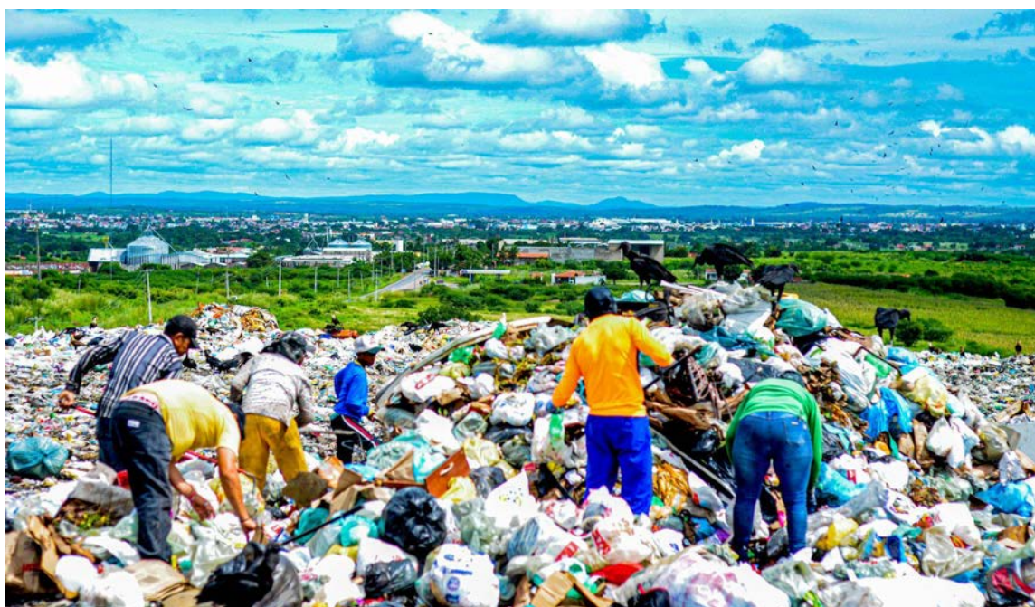
Figura 4 - Cartão postal da cidade de Iguatu - Lixão da cidade de Iguatu