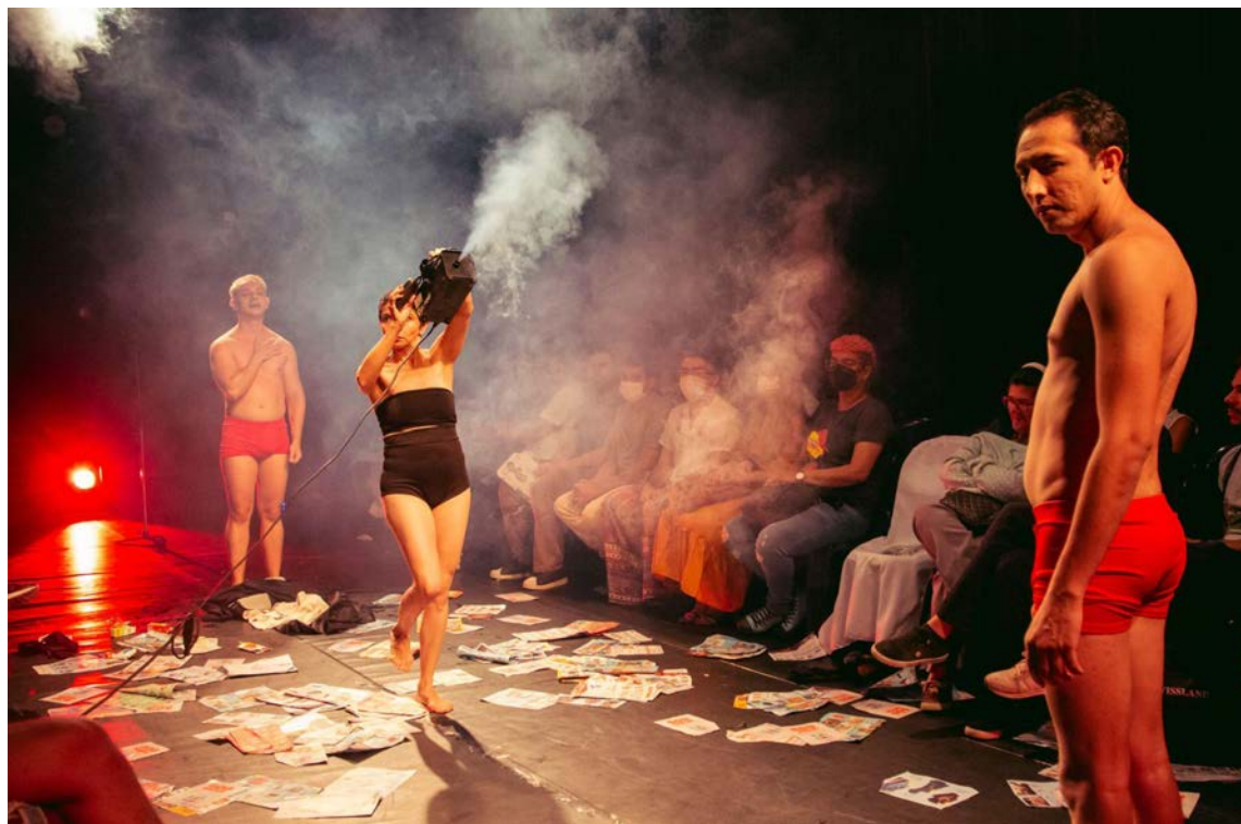
Figura 3 - Cena Vento do Aracati - fumaça do lixão produzida cenicamente. 24 ago. 2022

Um vento que assola também muitas cidades do Nordeste e do Brasil todo. 12 Muitas vezes, a representação do Nordeste é feita de forma ironizada, problemática, desconstruída e exposta no seu lugar de imagem que serve historicamente ao capital.