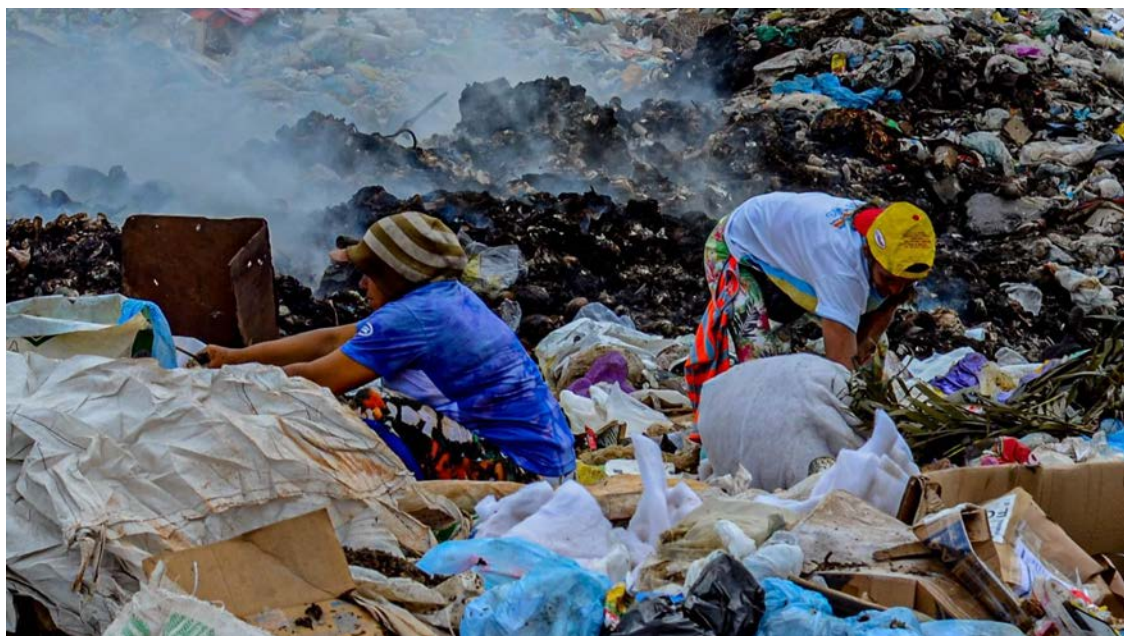
Figura 9 - Um processo de curadoria - Lixão da cidade e Iguatu. 24-08-2022

A cartografia do lixão, bem como os corpos que o atravessam, imprimem uma infinidade de relações de afeto e é necessário que o/a artista do campo do “Teatro Documentário” esteja atento/a para descobrir as chaves, os pontos de encontro e de distância, os conflitos e os afagos a partir deste acervo. E, entre eles e nós, nos mesmos espaços, o do lixão e o do teatro.