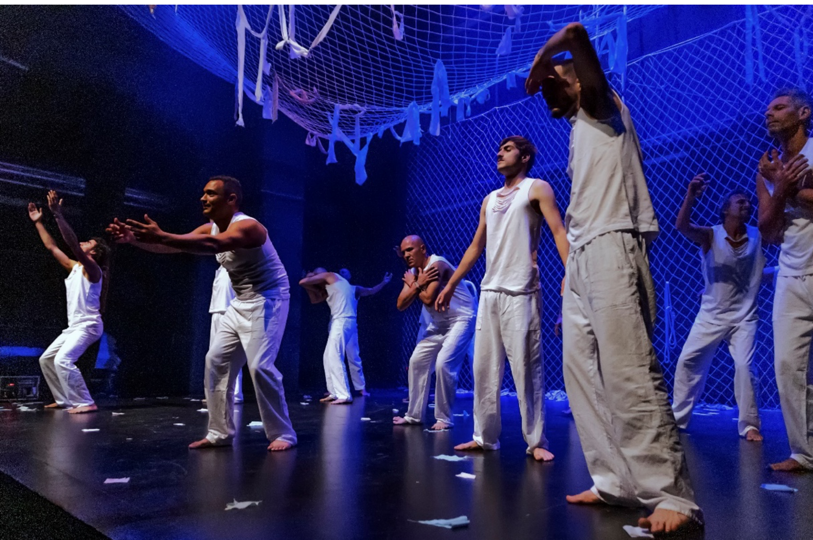
Figura 5 - Extracto de la representación de la obra de teatro Atrapasueños.