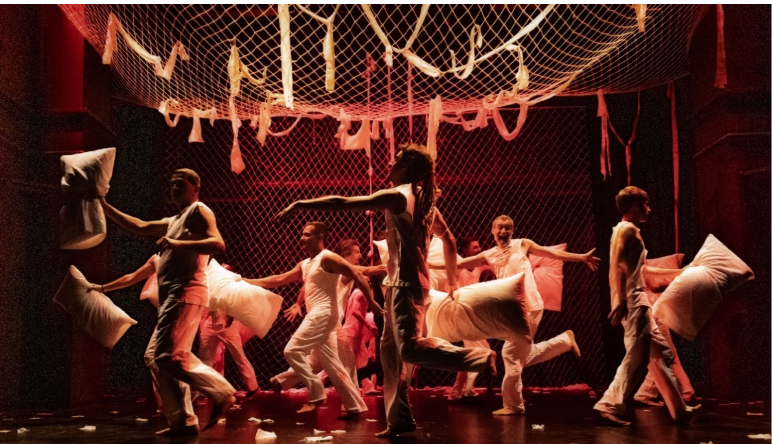
Figura 4 - Extracto de la representación de la obra de teatro Atrapasueños .