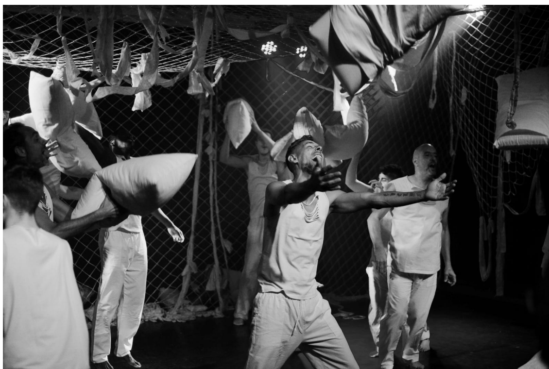
Figura 2 - Extracto de la representación de la obra de teatro Atrapasueños.