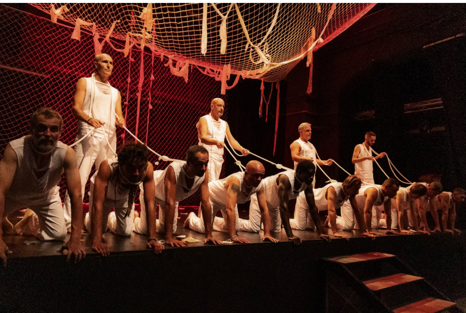
Figura 8 - Extracto de la representación de la obra de teatro Atrapasueños .