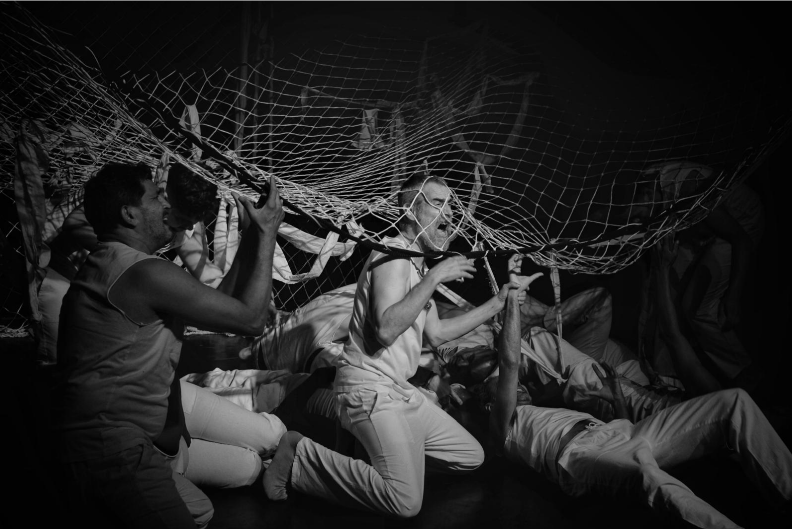
Figura 1 - Extracto de la representación de la obra de teatro Atrapasueños .