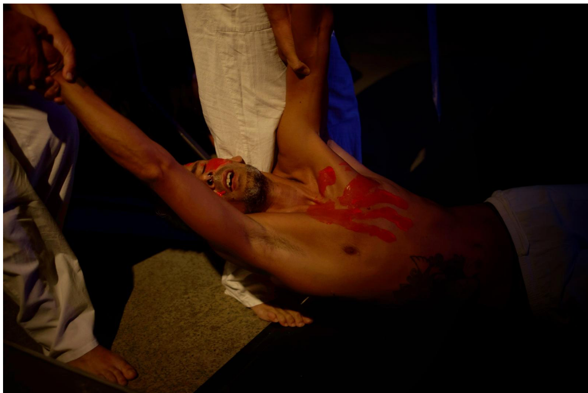
Figura 3 - Extracto de la representación de la obra de teatro Atrapasueños .