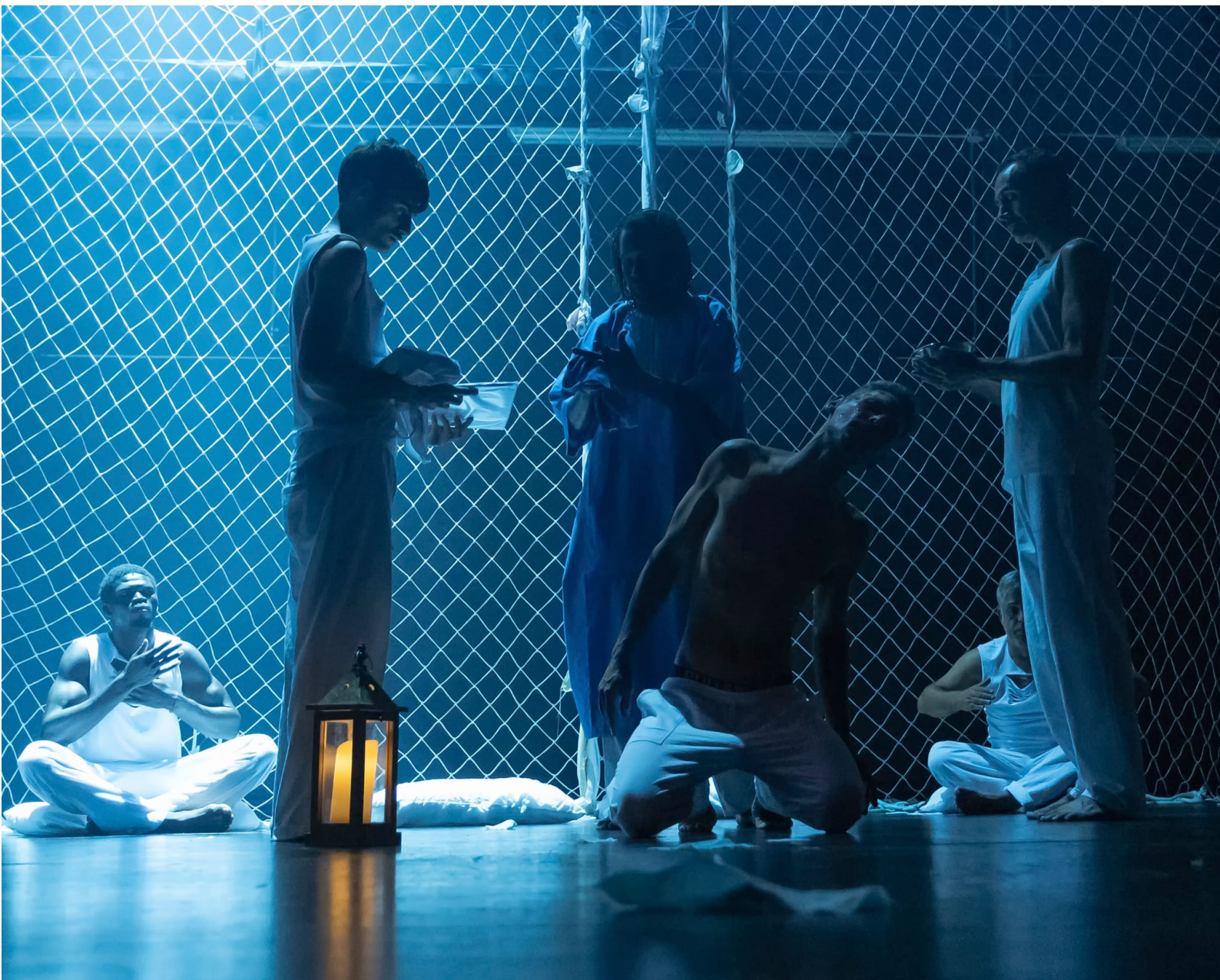
Figura 10 - Extracto de la representación de la obra de teatro Atrapasueños .

Que me siga ayudando a mí y me permita conocer varios tipos de teatro y conectar con más gente (Damián).