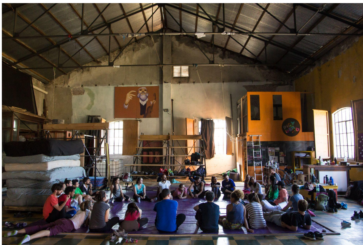
Figura 3 - El Picadero en su sede de Capurro, 2016