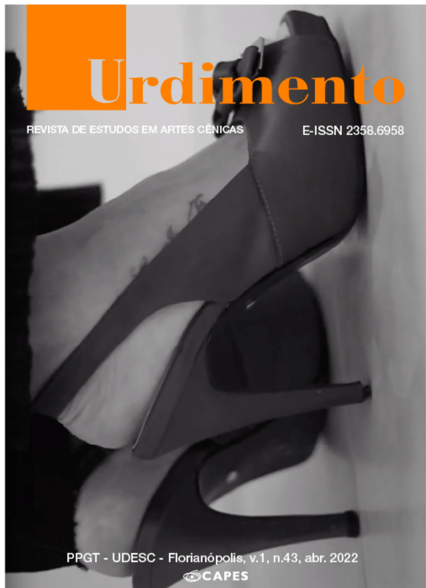
Imagem da Capa

Projeto Gráfico: Marcelo Pires de Araújo Espetáculo: Matemática Curva: uma série em confinamento Supervisão do processo criativo: André Carreira