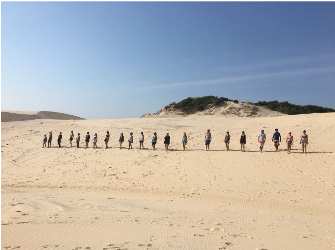
Aqui - Dunas do Siriú. Garopaba/SC. 2018