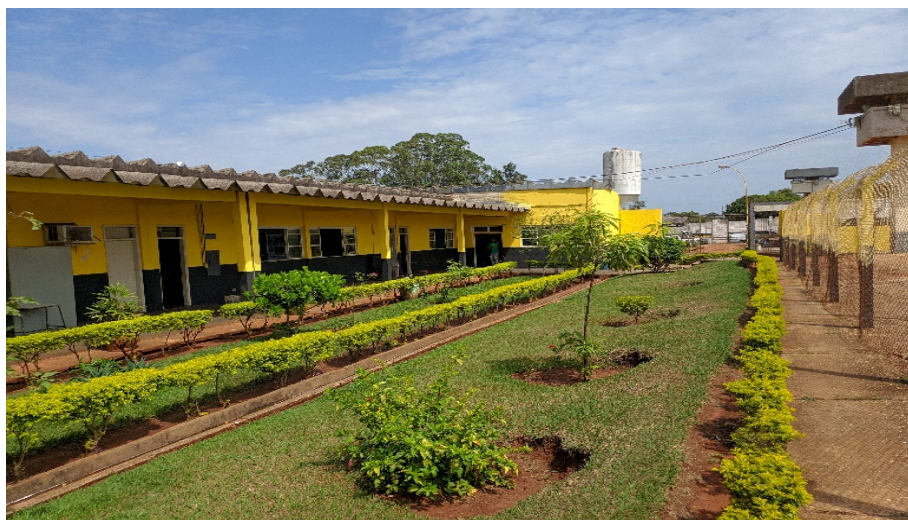
Figura 3 – Módulo de Educação do IPCG

A maneira como visualizamos o trato para com esses sujeitos, sempre no intuito de manter a ordem, nos leva a refletir que a inclusão das artes cênicas como dança, circo e teatro, levariam esses sujeitos a terem que se portar de outras maneiras, com maior liberdade de seus corpos e possibilidades de criações.