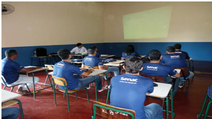
Figura 2- Sala de Aula (IPCG)