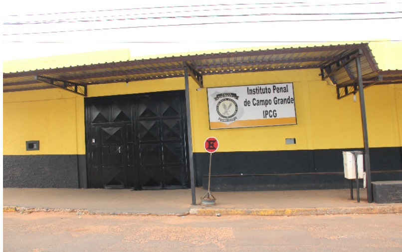
Figura 1 – Fachada do IPCG