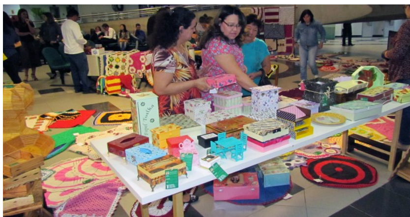
Figura 4 – Feira do Artesão Livre no Fórum de Campo Grande

Desde o ano de 2015 os artesanatos produzidos nos presídios do município de Campo Grande, MS, são expostos e vendidos na Feira do Artesão Livre realizada no Fórum de Campo Grande e em festivais estaduais, nacionais e internacionais, conforme figuras abaixo.