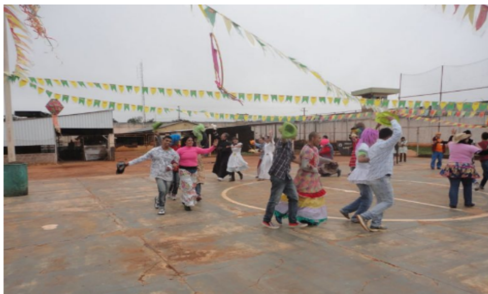
Figura 8 – Apresentação de quadrilha no IPCG

No decorrer do tempo essas práticas são consideradas como movimentos que se opunham aos princípios de corpo acabado, que a ciência construirá de forma disciplinada, pois "[...] lançavam-se ao espaço, contorciam-se e encaixavam-se em potes, em cestos, imitavam bichos, vozes, produziam sons com as mais diferentes partes do corpo, cuspiam fogo, vestiam roupas inesperados, gargalhavam" (Soares, 2005, p. 24). Nos espetáculos, o corpo é o ponto de partida para a realização dessas atividades circenses que fugiam das regras e que desafiavam os limites do sujeito.