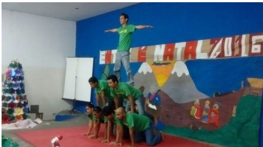
Figura 6 – Apresentação alunos do EPJFC encerramento do ano letivo 2016