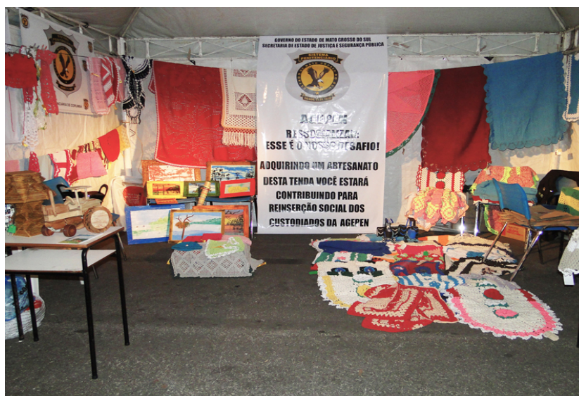
Figura 5 – Exposição no Festival América do Sul (2015)