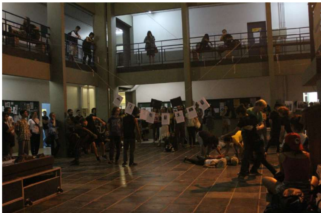
Até a Próxima Esquina (2019) Direção: Zilá Muniz e Fátima Costa de Lima Espetáculo na CFH/UFSC – visão do espaço onde foi realizado o trabalho