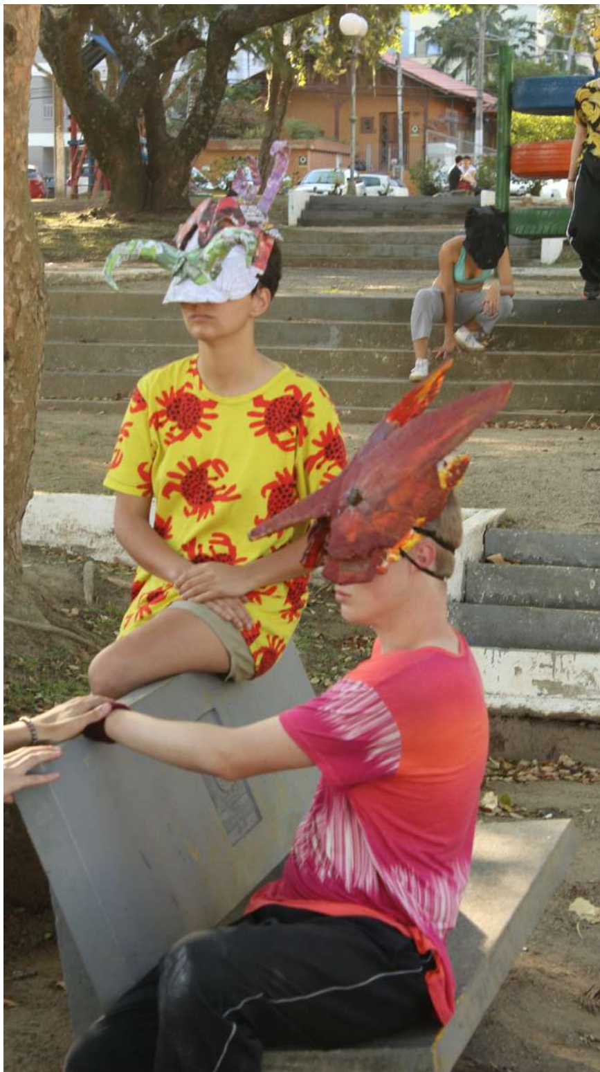
Até a Próxima Esquina (2019) Direção: Zilá Muniz e Fátima Costa de Lima Florianópolis