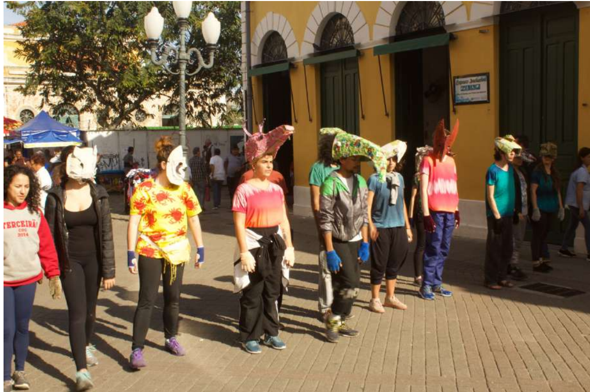
Até a Próxima Esquina (2019) Direção: Zilá Muniz e Fátima Costa de Lima Espetáculo na rua Conselheiro Mafra – centro de Florianópolis