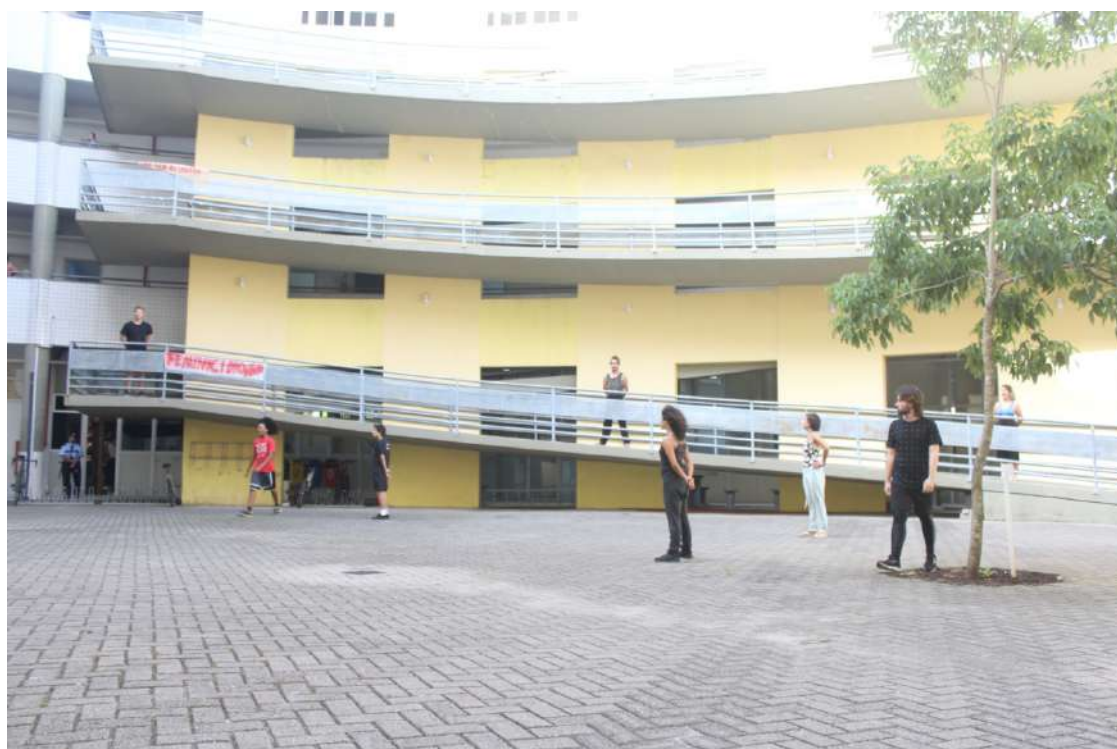
Até a Próxima Esquina (2019) Direção: Zilá Muniz e Fátima Costa de Lima Espetáculo na FAED/UDESC – visão do espaço onde foi realizado o trabalho