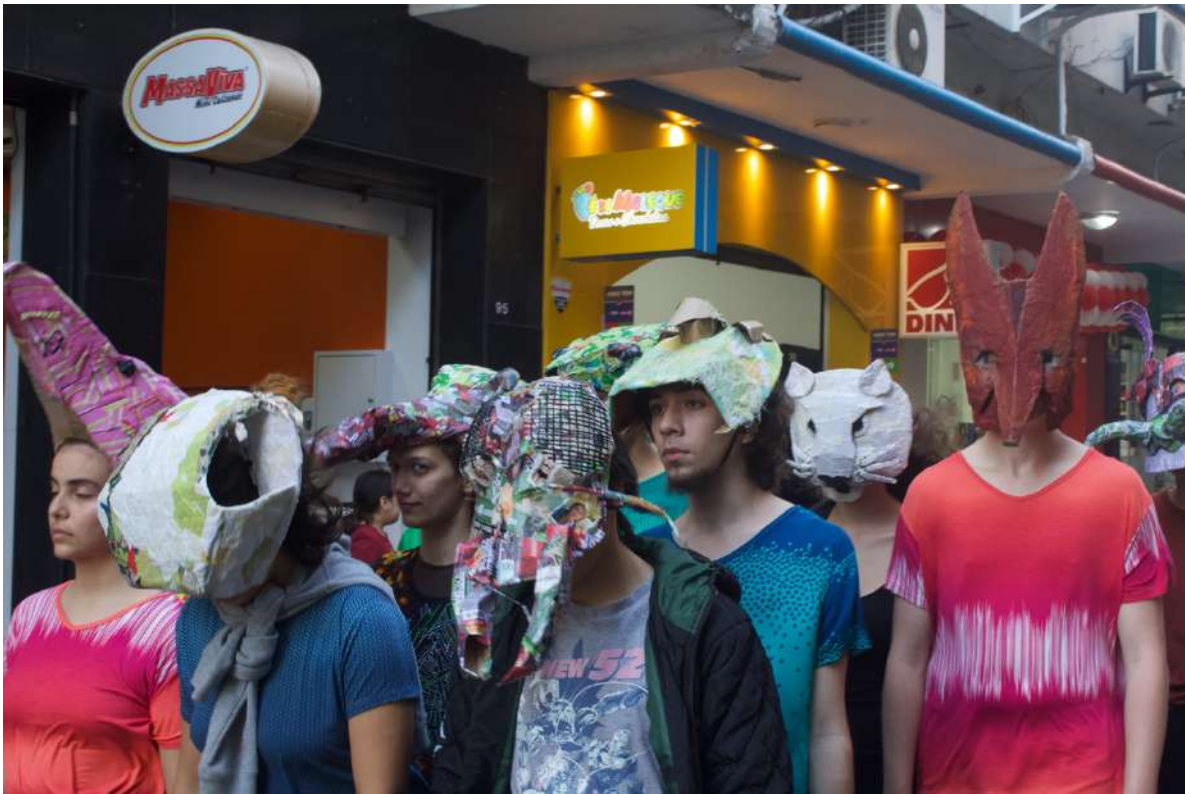
Até a Próxima Esquina (2019) Direção: Zilá Muniz e Fátima Costa de Lima Espetáculo no Centro de Florianópolis