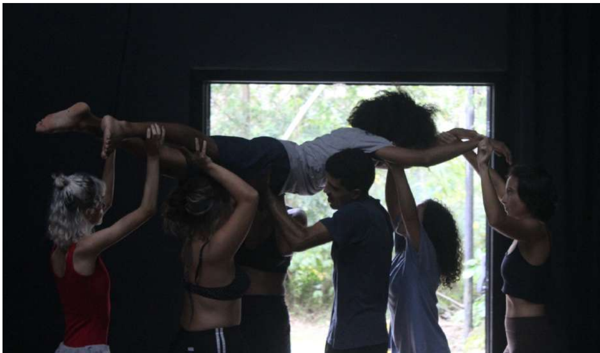
Até a Próxima Esquina (2019) Direção: Zilá Muniz e Fátima Costa de Lima Imagens de ensaio – CEART/UDESC