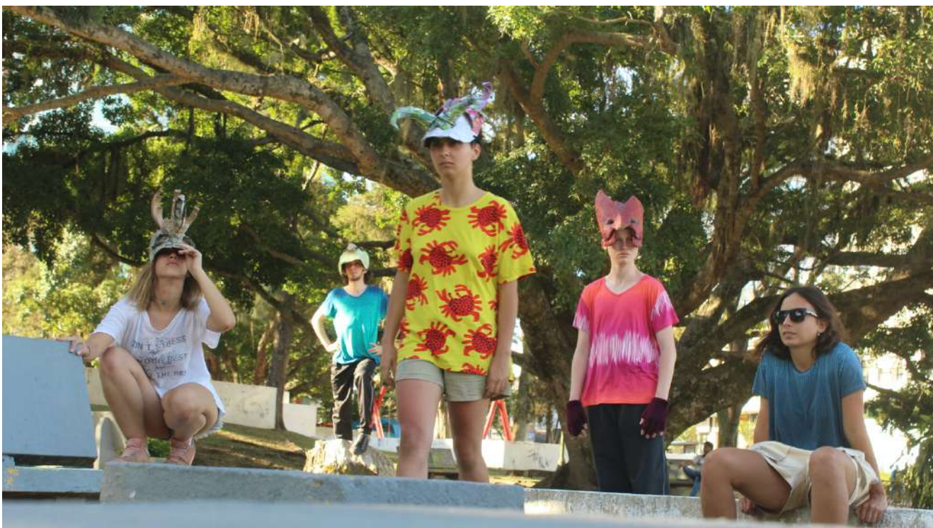
Até a Próxima Esquina (2019) Direção: Zilá Muniz e Fátima Costa de Lima Florianópolis