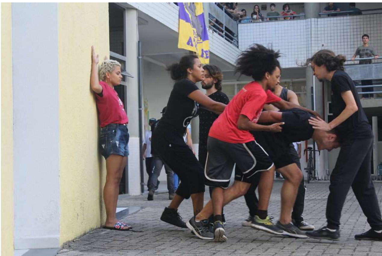
Até a Próxima Esquina (2019) Direção: Zilá Muniz e Fátima Costa de Lima Espetáculo na FAED/UDESC