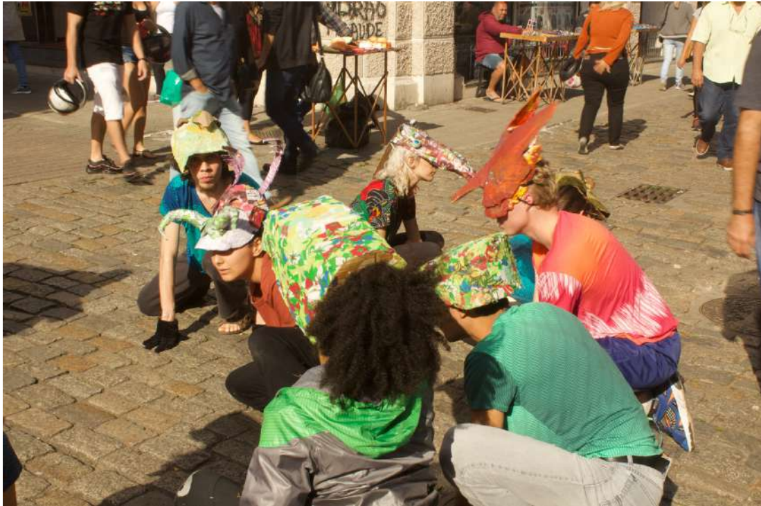
Até a Próxima Esquina (2019) Direção: Zilá Muniz e Fátima Costa de Lima Espetáculo na rua Conselheiro Mafra – centro de Florianópolis