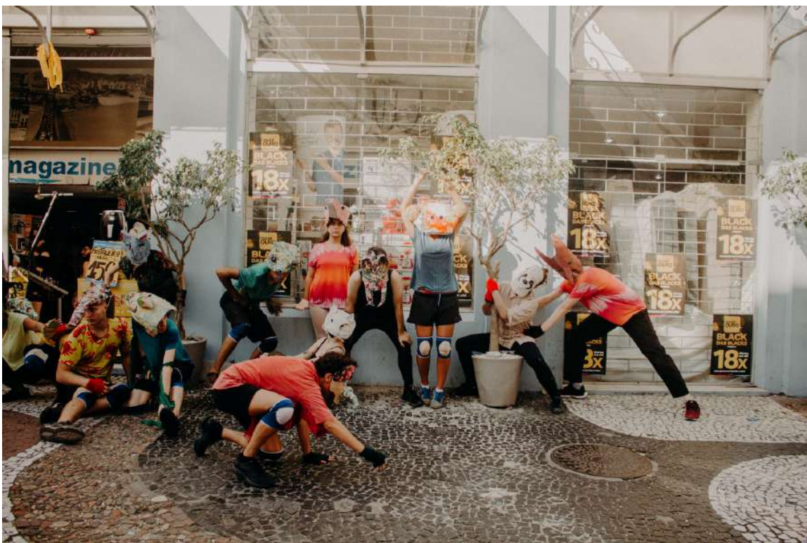
Até a Próxima Esquina (2019) Direção: Zilá Muniz e Fátima Costa de Lima Espetáculo na rua Felipe Schmidt – centro de Florianópolis