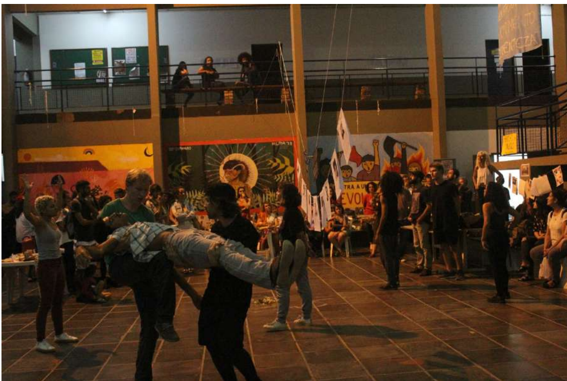
Até a Próxima Esquina (2019) Direção: Zilá Muniz e Fátima Costa de Lima Espetáculo na CFH/UFSC