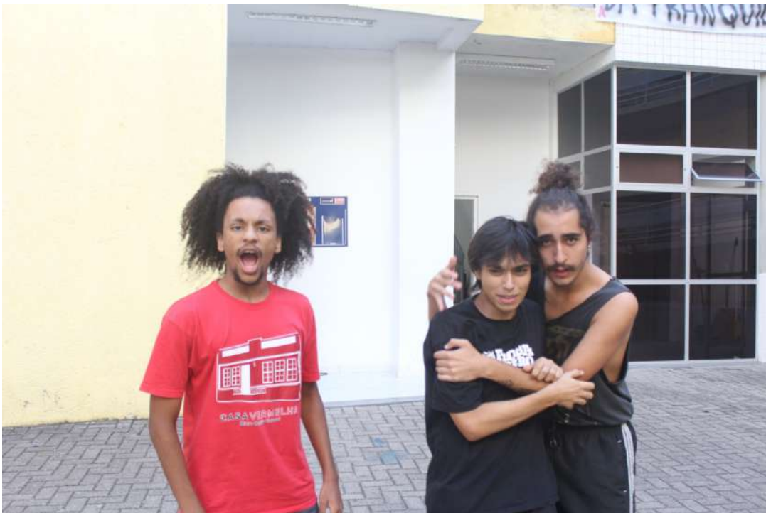
Até a Próxima Esquina (2019) Direção: Zilá Muniz e Fátima Costa de Lima Espetáculo na FAED/UDESC