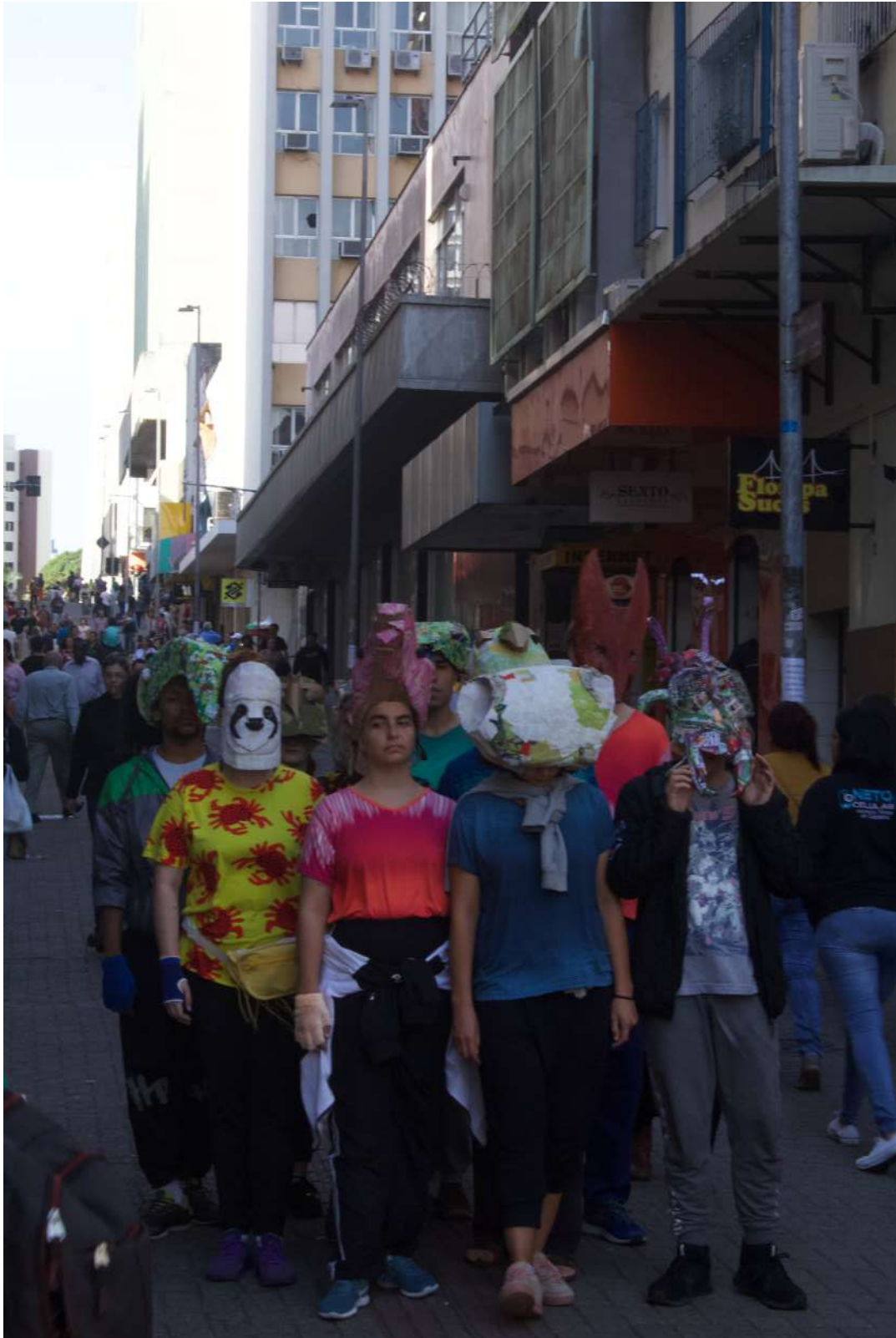
Até a Próxima Esquina (2019) Direção: Zilá Muniz e Fátima Costa de Lima Espetáculo no Centro de Florianópolis