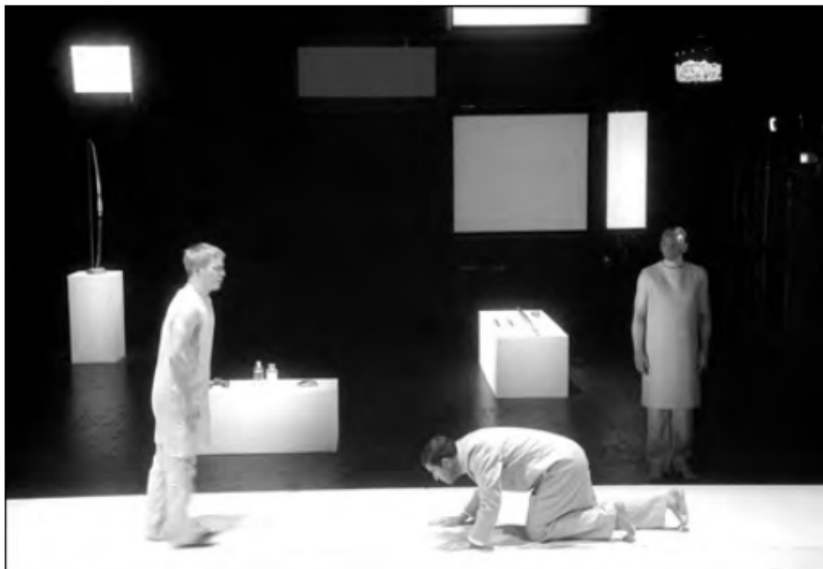
Figura 4 - Heiner Müller, Philoktet , Nationaltheater Mannheim, 2002. Direção: Laurent Chétouane; Cenografia: Patricia Talacko

De maneira menos espetacular que Wilson, Patricia Talacko e Mark Lammert também expõem a caixa cênica como enquadramento da montagem em suas produções baseadas em um texto de Heiner Müller. Na cenografia de Patricia Talacko para a encenação de Philoktet de Laurent Chétouane, em 2002 em Mannheim, o próprio palco é um espaço de exposição no qual arcos e flechas são dispostos como em um museu (ver Figura 4). Os três atores da peça interagem uns com os outros apenas na medida em que tornam o texto audível – como texto que, por assim dizer, passa por eles; como texto que vem de outro lugar; que não pertence a eles e que ao mesmo tempo, na configuração que os três atores lhe dão, apresenta um conflito inextricável no contexto do jogo ficcional – e que apresenta isso num primeiro momento apenas aos três atores em cena. Para o