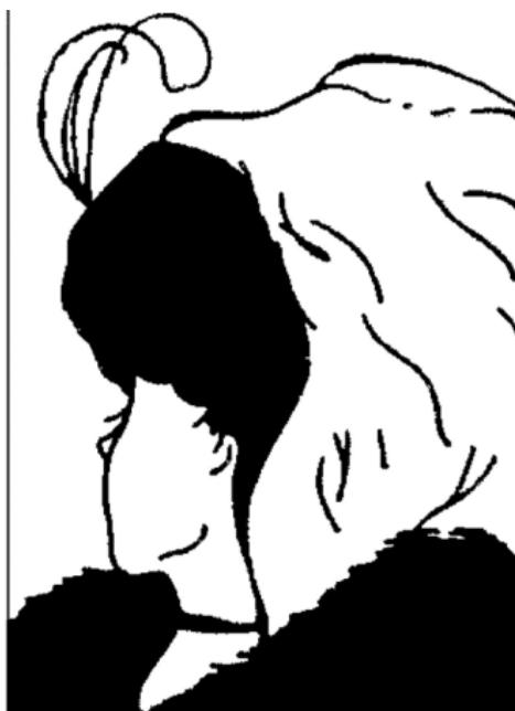
Figura 1 - Uma mulher jovem ou velha? Exemplo clássico de uma transfigura

Quantos anos tem essa mulher? É com essa questão que geralmente se apresenta esta imagem. Conforme enxerguemos nela uma jovem mulher com um turbante elegante, um decote largo e um manto de pele casualmente disposto sobre os ombros, ou uma velha com olheiras e nariz adunco que, devido à sua avançada idade, está toda agasalhada, oscilaremos entre a percepção etária de 20 e poucos ou 70 e muitos anos. Mas talvez também nós, uma vez que tenhamos passado de uma imagem para outra, não possamos mais nos deter em apenas uma representação. Pelo contrário, oscilamos entre a jovem de costas e a velha