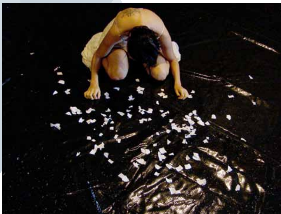
PEQUENAS MORTES (2010/2011). Direção e interpretação de Vancilea Porath.