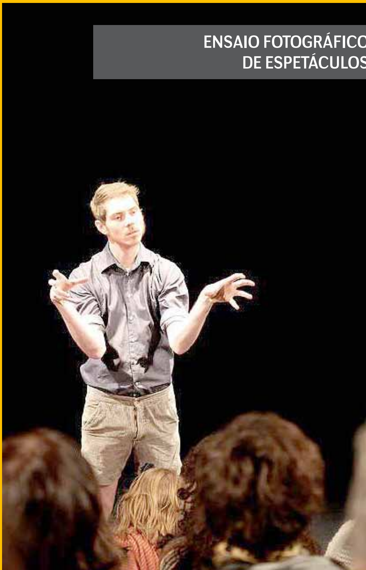
PROLIXIA (2012). Criação, coreografia e interpretação de Volmir Cordeiro. Co-produção com o Centre National de Danse Contemporaine d'Angers, França - Direção Emmanuelle Huynh.