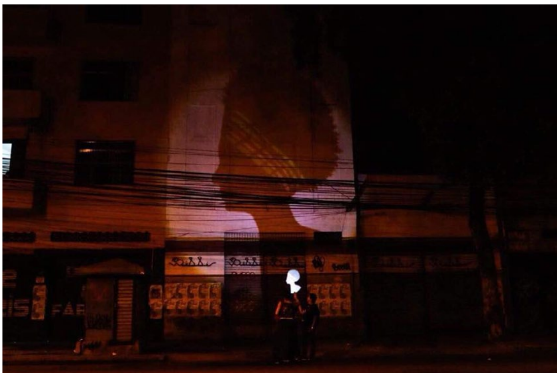
Performance Sombra é luz.