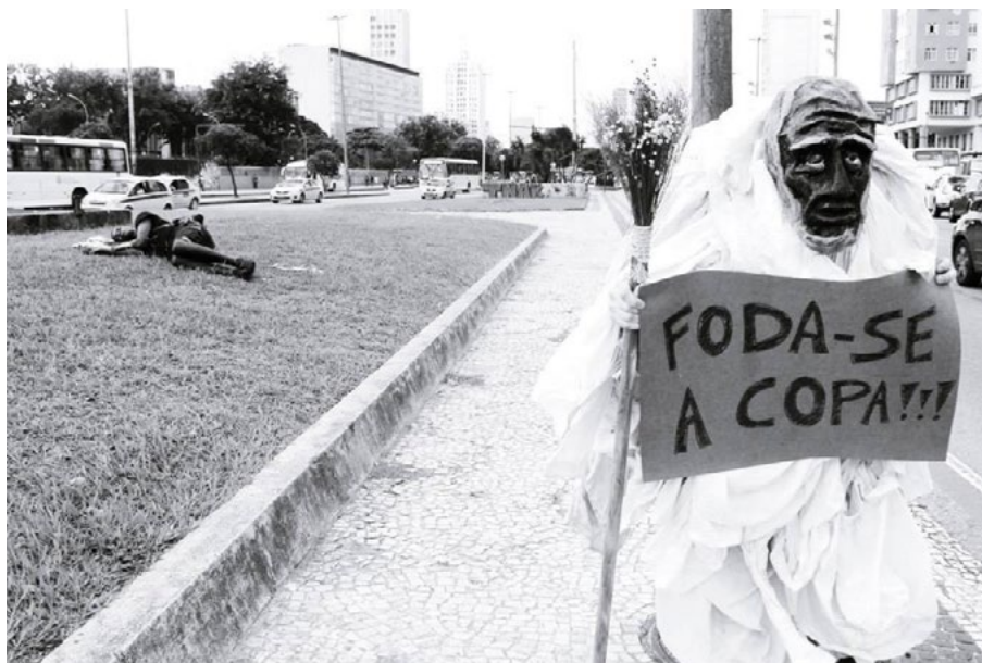
Exercício 4: Ananse contra a Copa (2014).