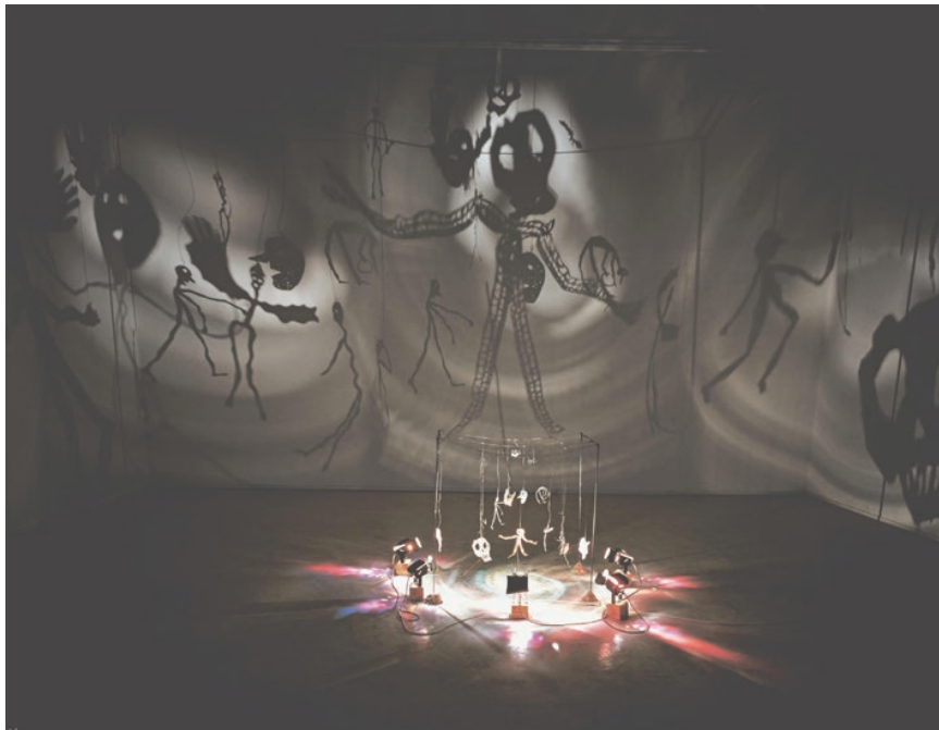
Figura 8 - Théâtre d’ombres, Christian Boltanski, 1984-1997, obra tridimensional, instalação: luzes, projeção de 20 figurinas na parede. Figurino: cartão, projetores, plataforma móvel, estrutura em metal, ventiladores, dimensões variáveis.

motivos centrais de sua poética (cf. Boltanski, 2019; Boltanski, 1991): o rastro do passado, seus fantasmas transportados pela imagem da luz (fotografia), o confronto com a morte; temas que naturalmente encontram as dimensões do escuro, da sombra, do “chia-roscuro”. Desde 1985, as obras de Boltanski são ‘autoiluminadas’, pois o artista re-nuncia ao uso das luzes do alto e imerge o espaço na penumbra; a iluminação é uma parte essencial de seus trabalhos. Notavelmente, nesse mesmo momento, Boltanski expõe seus primeiros Théâtres d’ombres (Figura 8) (Bienal de Paris de 1985), iniciando uma abertura em seu trabalho: o teatro de sombras é ligado “à l’idée de la mort, des fantômes, de la disparition. D’ailleurs, il suffit d’allumer la lumière et il n’y a plus rien» (Boltanski, 2019, p. 44) 33 .