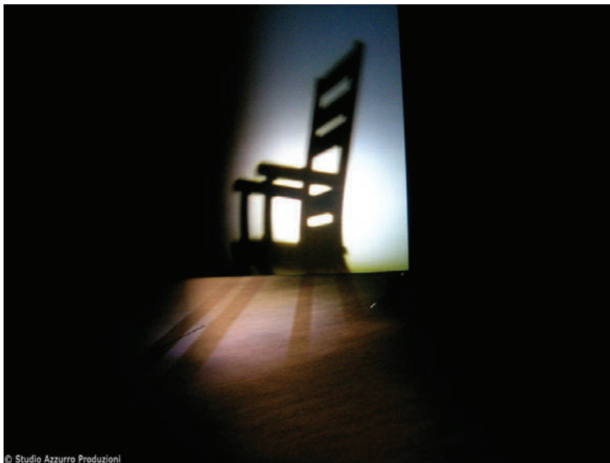
Figura 5 - Neither , Studio Azzurro, 2004.

outro, de um polo de sombra ao outro [...], que não se direciona a um destino, mas, sim, à interrupção do movimento” (Di Marino, 2007, p. 178). Em suas notas de direção, Paolo Rosa enfatizava o “encontrar-se justamente no Neither , naquele movimento incessante, absurdo, oscilando de uma condição a outra, sem se estabilizar, nem em uma nem na outra” (Rosa, 2012, p. 223). Ao longo da ouverture orquestral, um fecho de luz desce do alto; é a “personagem”, no sentido supramencionado. Após desenhar um círculo, o fecho se move, iluminando o nada (cf. Di Marino, p. 177-178; Pittaluga-Valentini, 2012, p. 222-241). Esta pesquisa confronta implicitamente a ideia de “figura”, constituindo-a de acordo com novas estratégias a partir da ausência. Assim, ela surge como uma paisagem fluida, indefinível, do inconsciente, que pode assumir mil formas ou nenhuma (Pittaluga-Valentini, 2012, p. 222-241).