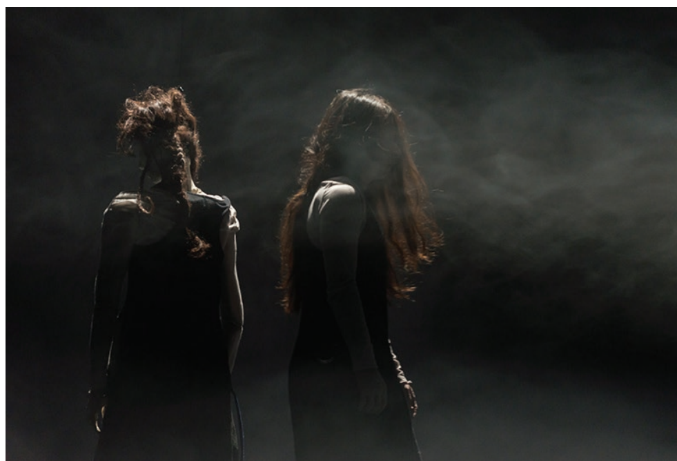
Figura 12B - K, Cie Sans Souci, 2019. Direção: Max Legoubé.