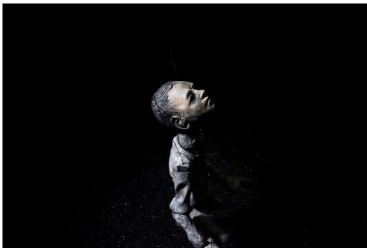
Figura 15 - Milieu , Renaud Herbin, 2017.