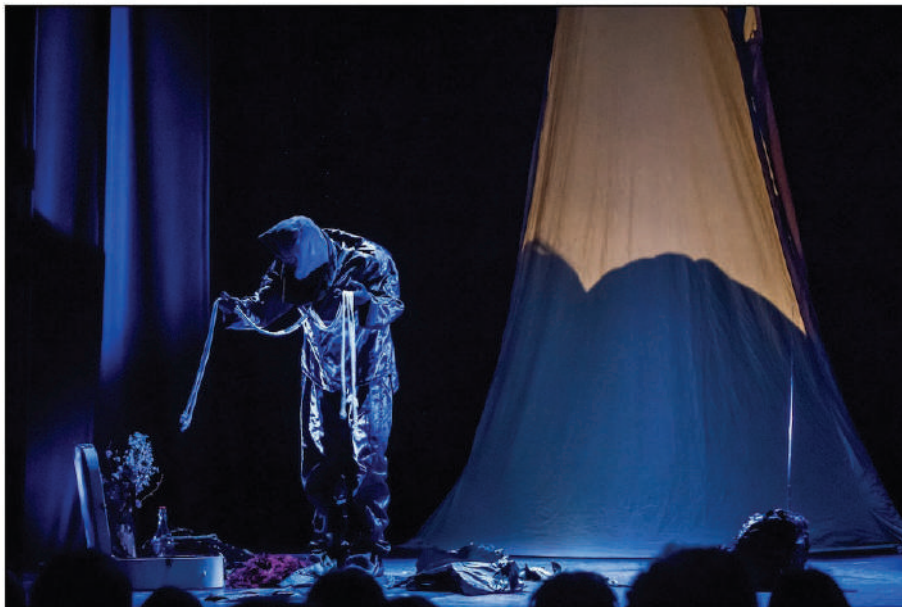
Figura 10 - Talita Kum , Riserva Canini, 2012.