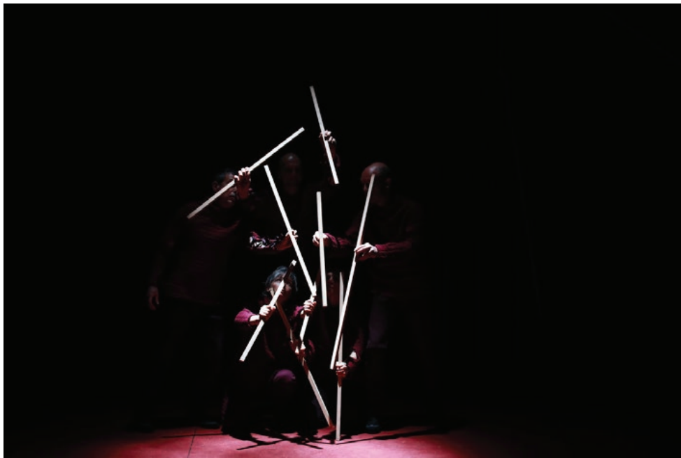
Figura 6 - Alors Carcasse , Compagnie Trois-Six-Trente, 2019. Direção: Berangère Vantusso, Luci Berangère Vantusso.

Curiosa figura vazia e fútil, de nome improvável e função nenhuma, mas que vive intensamente a experiência da imobilidade, presa no limiar de sua época. É como se ainda não existisse por inteiro e, portanto, como se diz, coloca-se ali, confusa, perturbada e bloqueada. 28