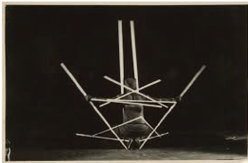
Figura 7 - Stäbetanz (Danza dei Bastoni), Oskar Schlemmer, 1927 ca. 30

Vantusso opta por incorporá-la com base na 'dispersão', utilizando meios que disseminam sua presença no espaço. Assim, é mostrado ao espectador um lugar onde a presença invisível se coloca na fluidez de uma forma de presença difusa, que jamais pode ser delimitada. Evoca-se a Dança dos bastões (Figura 7) de Oskar Schlemmer, considerando as diretrizes das linhas de movimento que marcam a interação entre o corpo do dançarino e as leis do espaço: porém, enquanto para Schlemmer as formas que traduziam as linhas de movimento do corpo tendiam à centralização e à unidade, aqui, Carcasse é o invólucro de uma presença que não pode ser definida por coordenadas exatas. É como se a cena se configurasse de forma invertida, em negativo (no sentido fotográfico do termo), mostrando-nos na escuridão os rastros desses percursos 29 .