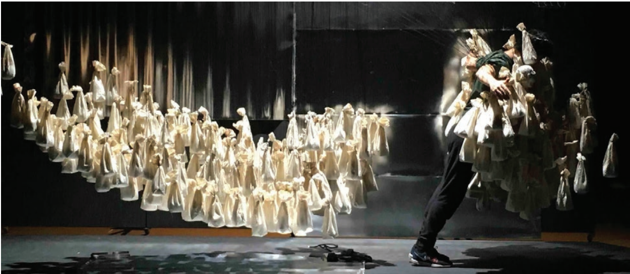
Figura 16 - At the still point of the turning world , Renaud Herbin, 2019.

Finalmente, a matéria em seu estado 'passageiro' ou fluido também pode atuar como um meio que dá tempo musical às figuras.