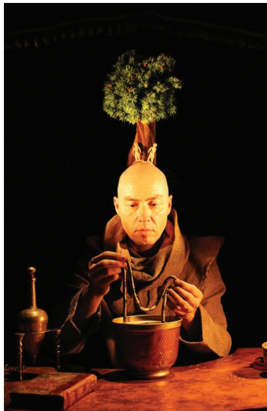
Figura 11 - Le Grand Oeuvre , La Tortue Noir, 2017.

Em Le grand oeuvre (2019) (Figura 11), da companhia canadense La tortue noire , o marionetista é um alquimista que transmuta as presenças e, por sua vez, é atacado por elas; coloca-se no centro do diâmetro do espaço visível, no escuro. Os fenômenos luminosos acompanham a transmutação, o escuro torna visíveis as presenças ou coisas ocultas, e a luz parece tornar fértil a imagem.