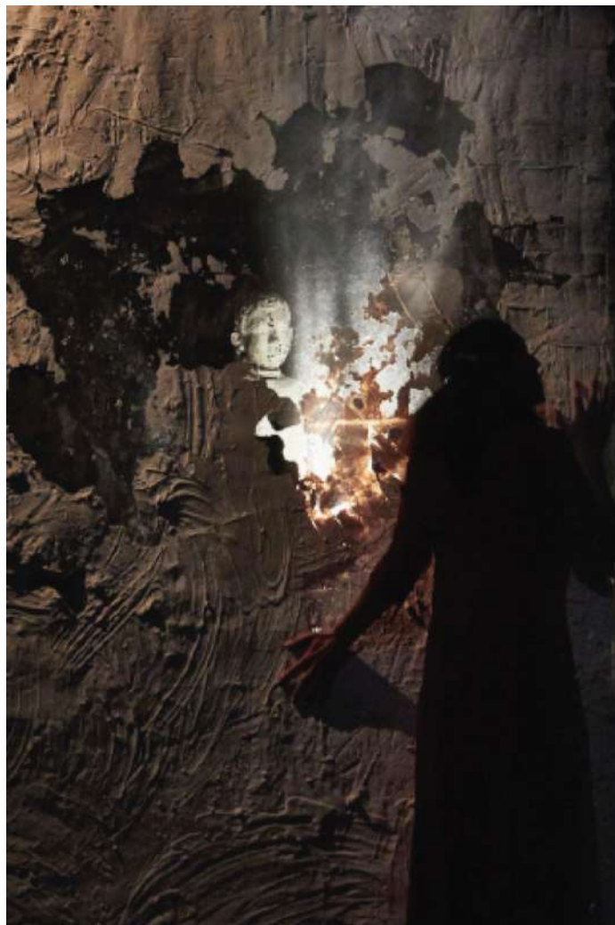
Figura 1 - L'enfant. Théâtre de l'Entrouvert, 2019. Direção: Elise Vigneron. Criação das luzes e dispositivos de cena: Benoît Fincker

Não é por acaso que, numa época mais próxima de nós, ao montarem os textos de Maeterlinck, vários diretores tenham explorado em primeiro lugar o potencial da luz: como exemplo, Claude Régy, em colaboração com Dominique Bruguière, Denis Marleau, com atores desmaterializados graças às novas tecnologias 12 . No recente L'Enfant , de Elise Vigneron ( Théâtre de L'Entrouvert ) (Figura1), La mort de Tintagiles é traduzido no palco pela chave da instabilidade, da frágil fronteira entre certo e incerto, real e invisível, dizível e indizível; a expressão dessa fragilidade é confiada à concepção do espaço, em que a imersão no escuro e a criação do percurso dramático, graças à presença na luz, são fundamentais e “geradoras” de uma imagem dramatúrgica 13 .