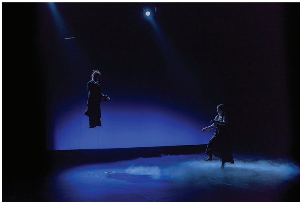
Figura 12 - K, Cie Sans Souci, 2019. Direção: Max Legoubé.