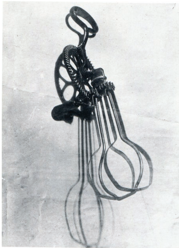
Figura 2 - Man Ray, L'homme , 1918. Collezione privata (Vera et Arturo Schwarz, Milan)

corpos (e impossível não lembrar como, mesmo fora das cenas, a associação desencadeada dos objetos de Man Ray (Figura 2), metamorfoseados em humanos pelas sombras, ou pela lâm-pada que 'interpreta' a L'Americaine de Picabia?).