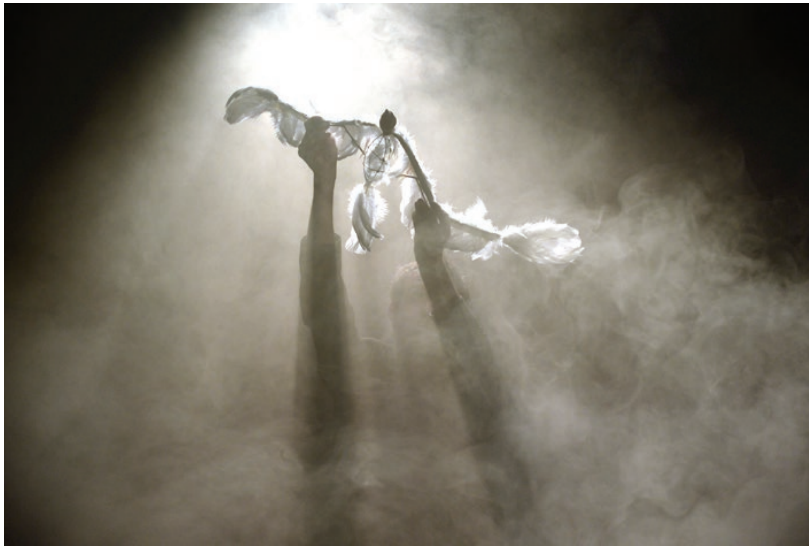
Figura 14 - Sous ma peau / Sfu.ma.to, La Cie S'appelle Reviens, 2015. Direção: Alice Laloy.

“Contra o foco” trabalham a alusão, o ‘esfumaçado’ e evaporado, o sangramento, o foco suave, que exigem a evocação e a conclusão da imagem graças à mente e aos olhos do espectador (e também à sua memória ou emoção).