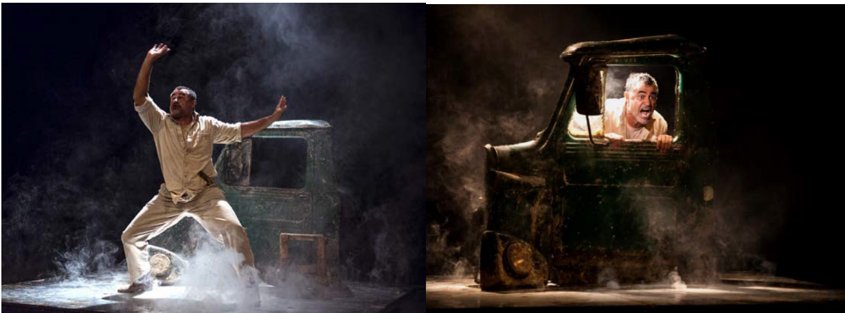
Sargento Getúlio 8

Já que a experiência tinha chegado ao limite, me interessei cada vez mais por todos os elementos que diretamente estavam relacionados com o espetáculo e, quando se parte por esse caminho, nos lembra Brook (1994), tudo o mais desaparece. Deixei claro, também, que eu e o restante da equipe, estávamos ali como coadjuvantes cientes de que nosso papel só existe para que ator principal reluz. Mas, convictos de que para ele brilhar em cena precisava de alguém para afinar a luz e acionar os botões certos na hora exata, e que ele podia contar conosco para isso acontecer. E, mais, que o apoio e resignação dele seriam imprescindíveis para o sucesso do espetáculo no projeto.