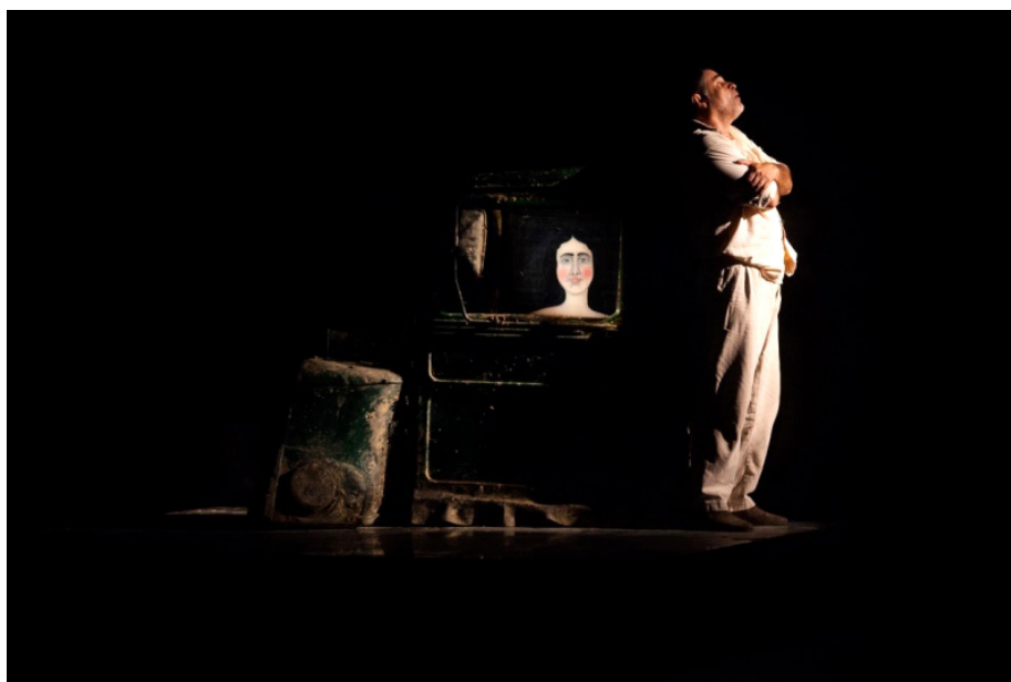
Sargento Getúlio 10

Em verdade, todo o processo de aprendizado durante os meses do projeto Palco Giratório só foi possível pelas constantes trocas de experiências com os companheiros que compunham a equipe do espetáculo, pelas confusões e percalços do trajeto; pelos improvisos e acasos descobrimos a verdadeira razão de ser do nosso trabalho, da segurança que tínhamos que depositar nos nossos pares de modo que o espetáculo pudesse acontecer, apesar da lâmpada queimada, apesar da mesa travada, apesar do B.O em cena aberta, apesar do “branco” do texto, apesar da música fora de hora, apesar dos risos e comentários fora de hora, apesar do cancelamento de uma das apresentações em Maceió (AL) -por problemas logísticos do SESC local- apesar, e por todas essas diversas experiências que fazem parte do evento teatral, é que aprendemos que o conhecimento adquirido neste projeto só foi possível graças à arte do encontro, como nos lembra Grotowski no “Em Busca de um Teatro Pobre”. E que é ela, no instante preciso e efêmero da sua existência, que possibilita o nosso verdadeiro aprendizado.