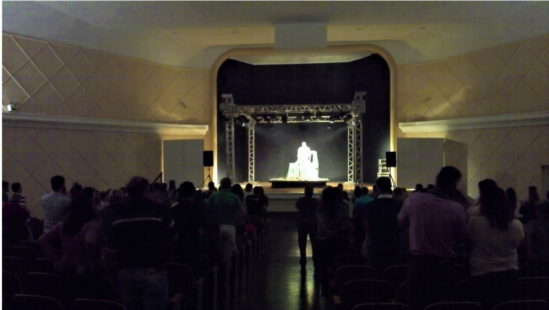
Sargento Getúlio Centro Cultural Genésio Tureck.

Bom, não posso afirmar que ele acatou as minhas sugestões ou se a demanda dele com as ondas sonoras foram realmente maior que a querela comigo, só sei que as maiores queixas dele nessa noite ao telefone com o diretor, após a apresentação, ficaram à luz do som no espaço, não sobre a luz do espetáculo que, por não ter altura suficiente na estrutura de Q30, quase o cozinhava vivo com o calor dos refletores PAR-64.