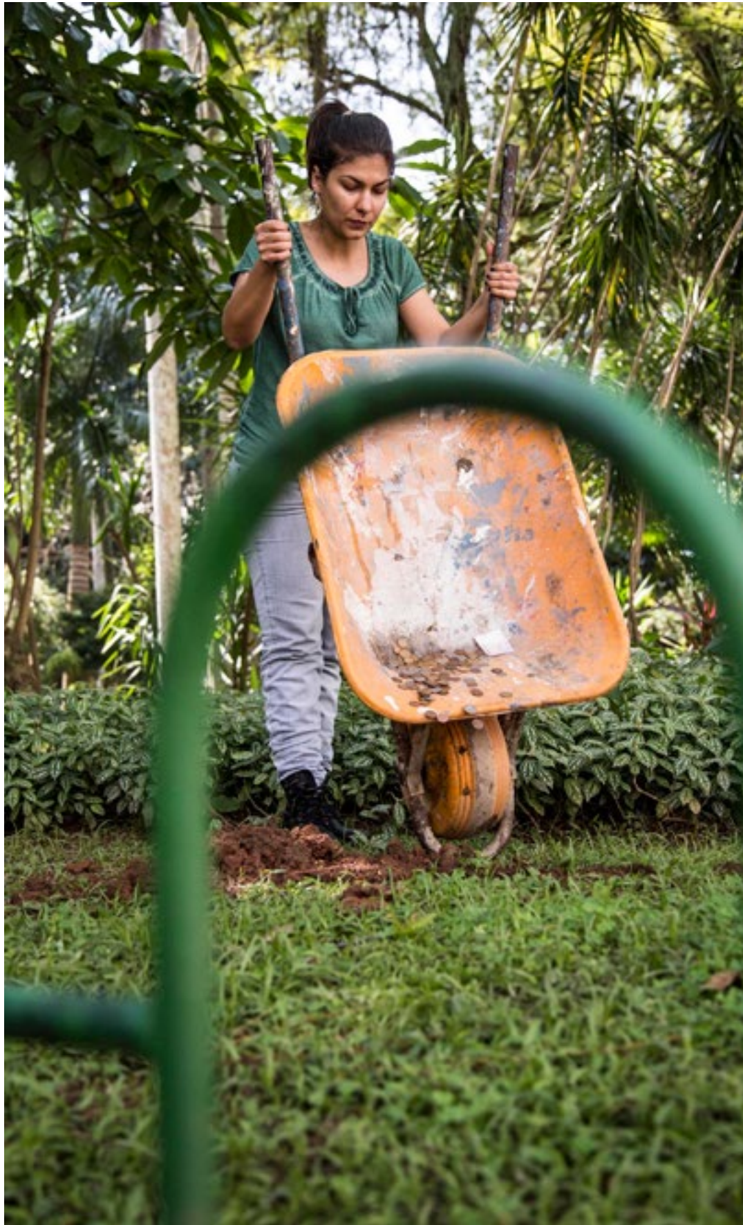
Performance: Sobre greens talks - segunda ação , com Erro Grupo (SC). Foto: Cristiano Prim