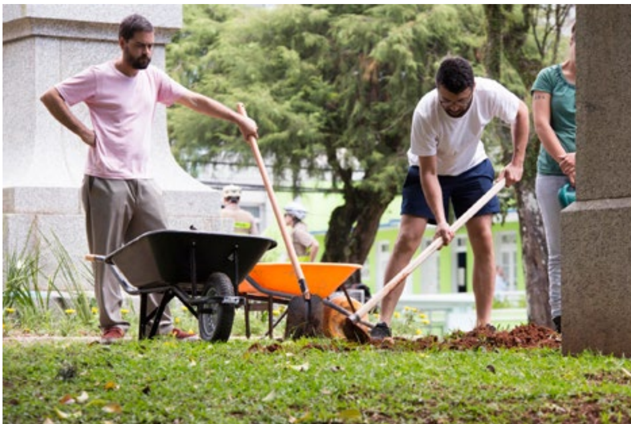
Performance: Sobre greens talks - segunda ação , com Erro Grupo (SC).