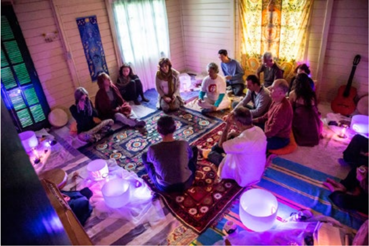
Performance Ritual: Meditação sonora , com Cantos de Gaia (UFSC).