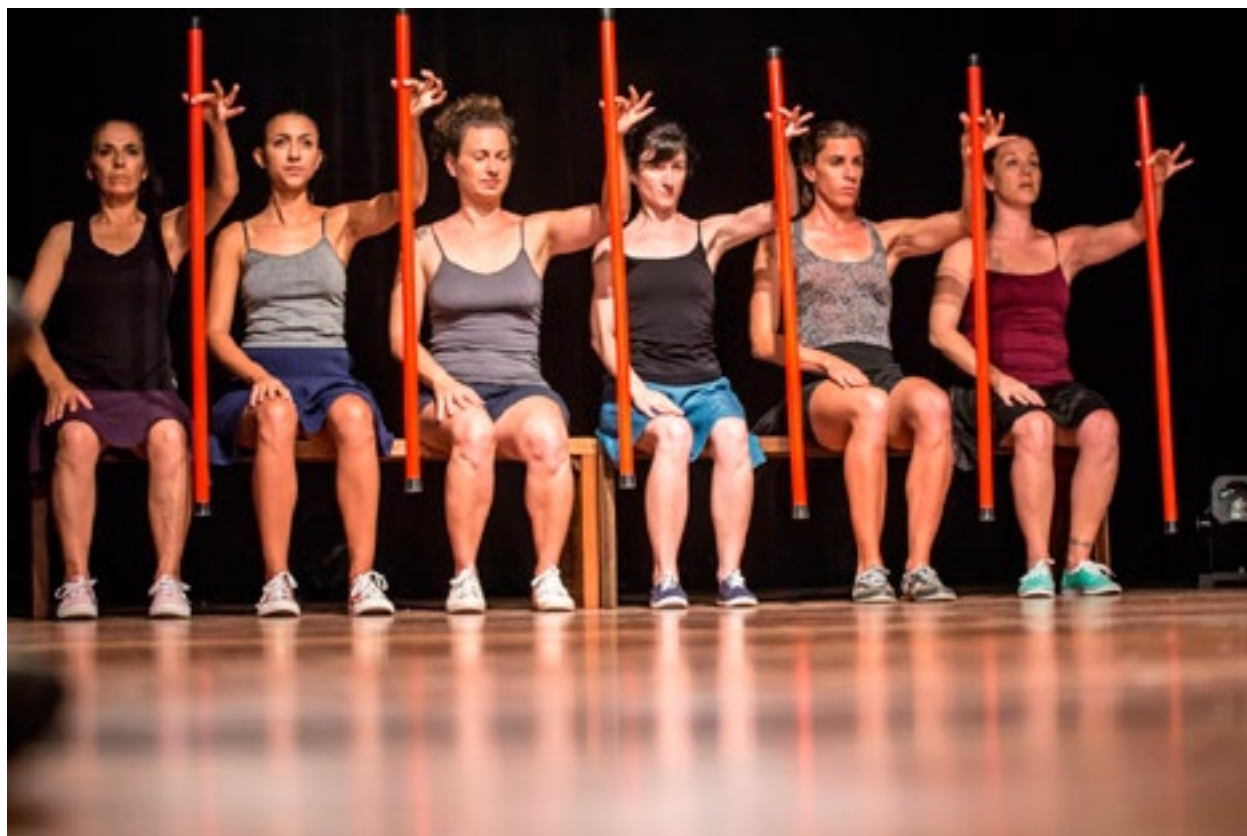
Performance: Sem Cabimento. Com : Coletivo Mapas e Hipertextos (SC).