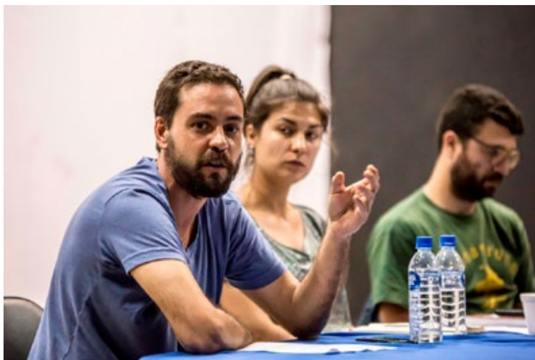
Experiências de compra e venda do ERRO Grupo no mercado da arte, com Erro Grupo (SC).