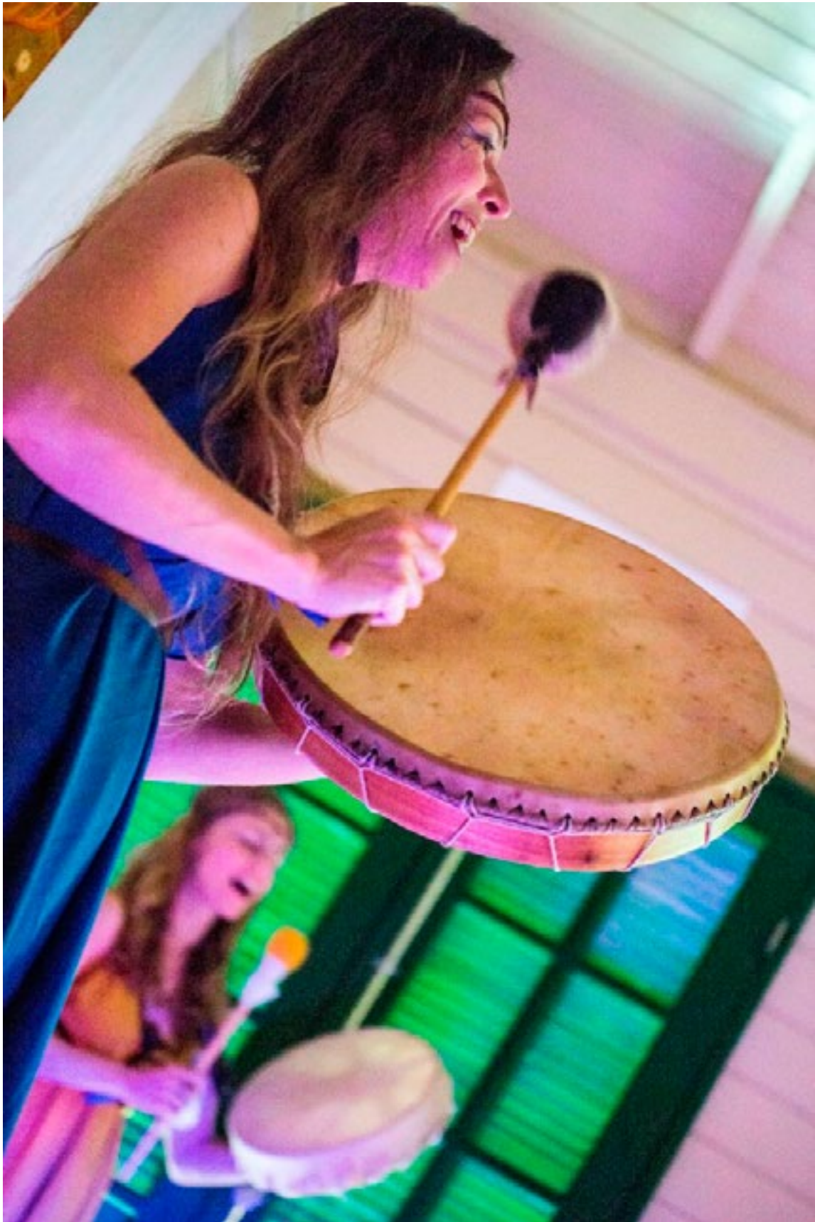
Performance Ritual: Meditação sonora , com Cantos de Gaia (UFSC).