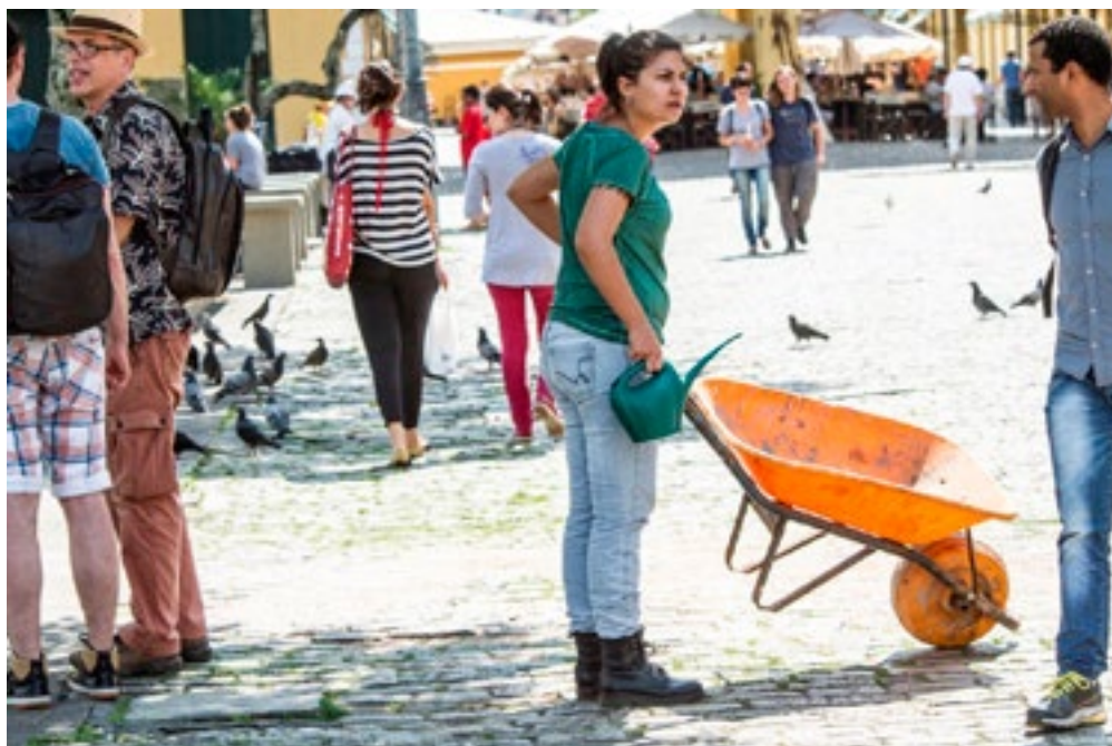
Performance: Sobre green talks - segunda ação , com Erro Grupo (SC).