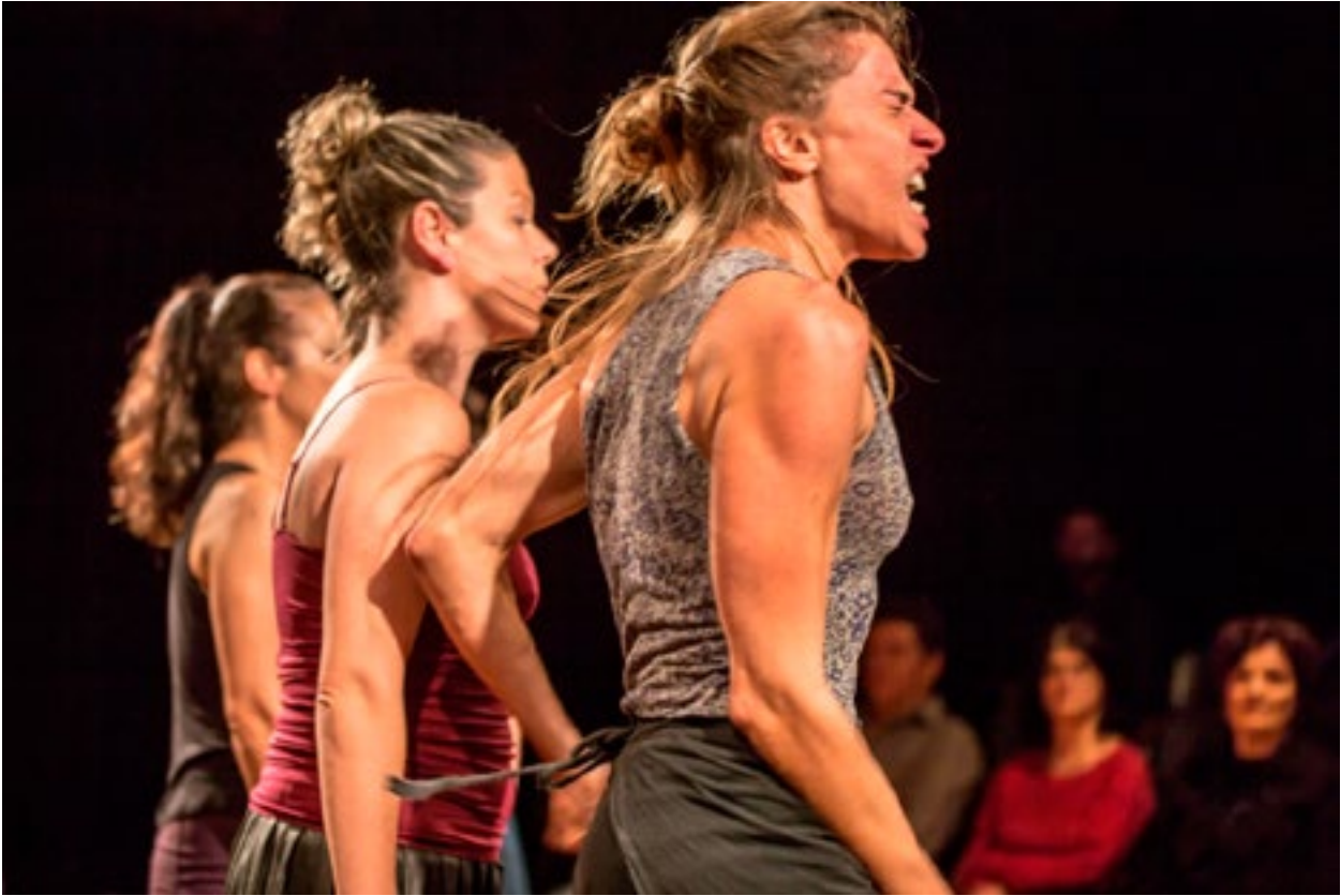
Performance: Sem Cabimento. Com : Coletivo Mapas e Hipertextos (SC).