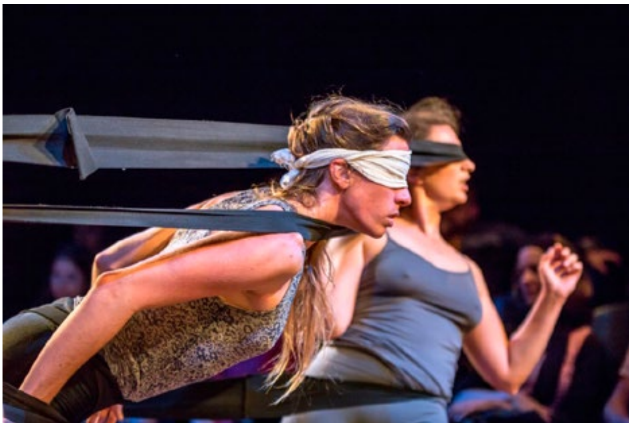
Performance: Sem Cabimento . Com : Coletivo Mapas e Hipertextos (SC).