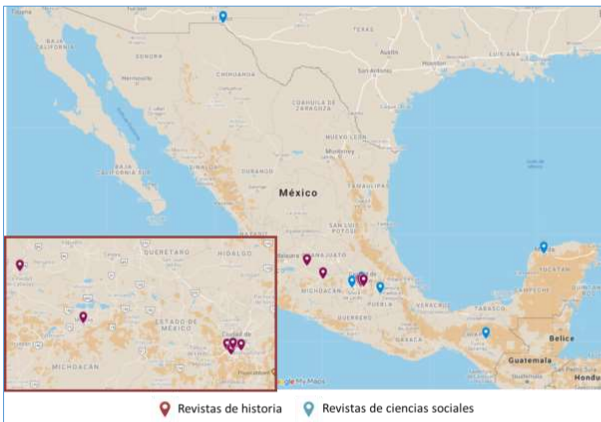
Figura 1 – Ubicación de las instituciones que editan revistas especializadas con contenidos sobre el tiempo presente en México