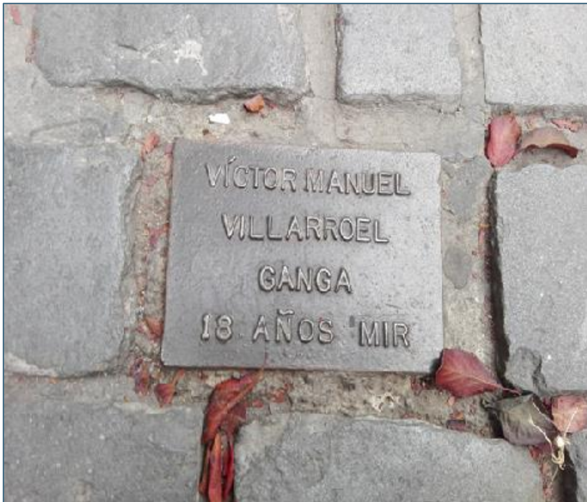
Figura 1: Santiago de Chile. Placa no chão, em frente de Londres 38