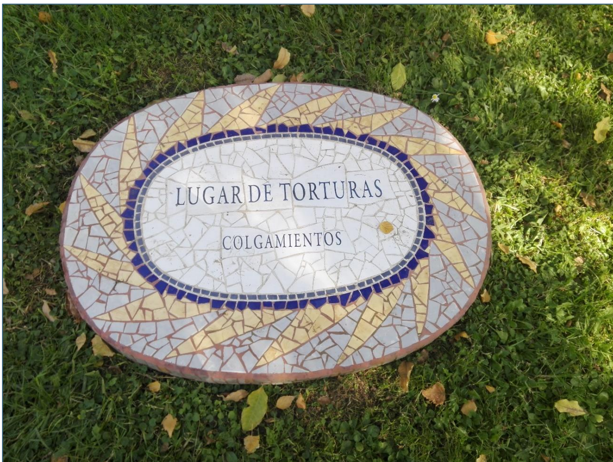
Figura 7: Placa evocativa de local de tortura, Villa Grimaldi, Santiago de Chile, foto de Abril de 2017.

Perto, foi reconstruído um muro, que o terramoto de fevereiro de 2010 abateu, e que era essencial nas recordações dos sobreviventes, pois as cores dos seus azulejos permitiam entender em que sector tinham estado presos. Entre o horror que ali viveram, recordavam também a frescura do muro, nos dias de verão, sentida nos corpos doridos da tortura. Uma placa no chão lembra as «casas Corvi», designação jocosa aposta pelos torturadores, que aludia a um bairro de habitação social: aqui eram celas de 1x1 metro, em que os detidos ficavam em isolamento, vendados e com correntes nas mãos e nos pés. As «casas Chile» eram um pouco maiores.