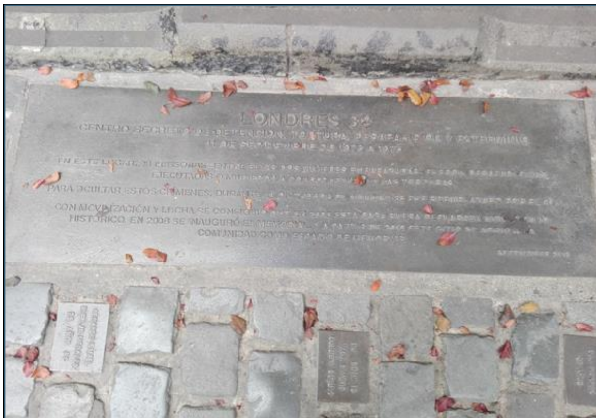
Figura 2: Santiago de Chile. Placas no chão, em frente de Londres 38.