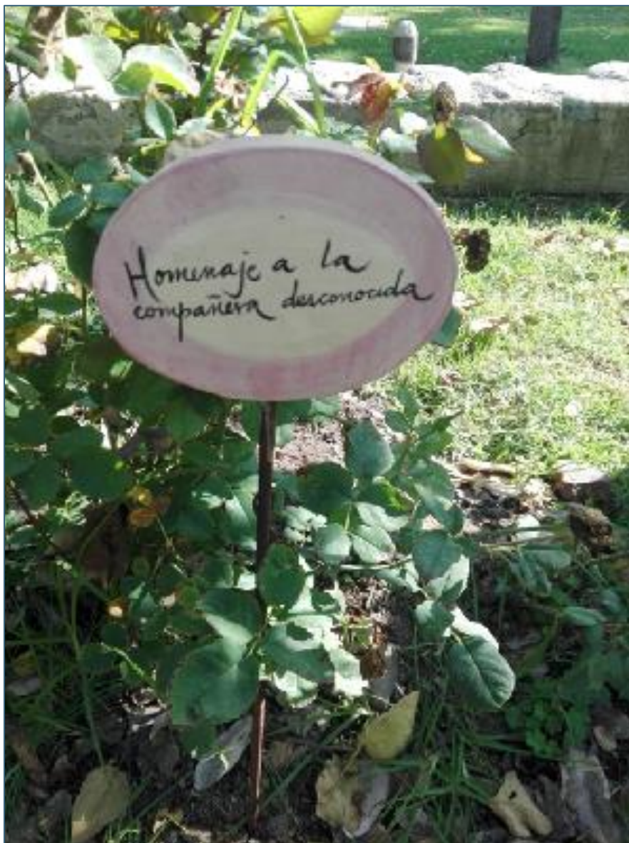
Figura 6: Memorial Jardín de las Rosas, Villa Grimaldi, Santiago de Chile, foto de Abril de 2017.

À nossa frente, a piscina abandonada tem águas das chuvas e folhas mortas – e um passado de memória promíscua, perversa, entre o trivial, o convivial e o horror. Perto, há um roseiral, o «Memorial Jardín de las Rosas»: em três círculos, em torno de um lago, lembra-se as 36 mulheres que morreram na Villa Grimaldi, no segundo, as 102 chilenas que foram mortas na década de 1970, e no terceiro, as 53 que foram assassinadas na década de 1980 (Figura 6). Entre as rosas, pequenas placas assinalam o nome das mulheres mortas ou desaparecidas. Uma delas lembra a «companheira desconhecida».