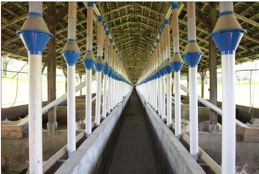
Figura 04: Baias para criação de suínos, 2013.