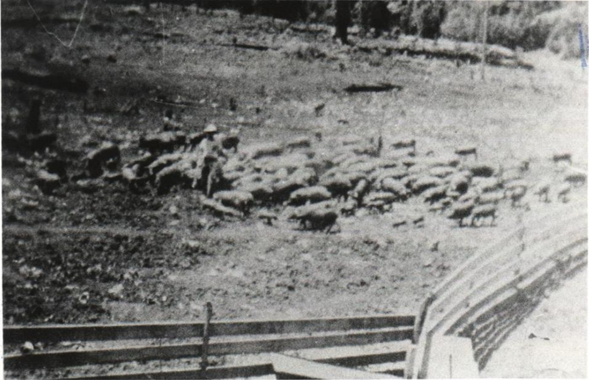
Figura 01: Suínos criados no cercado de madeira em Pinhalzinho, SC, na década de 1950.