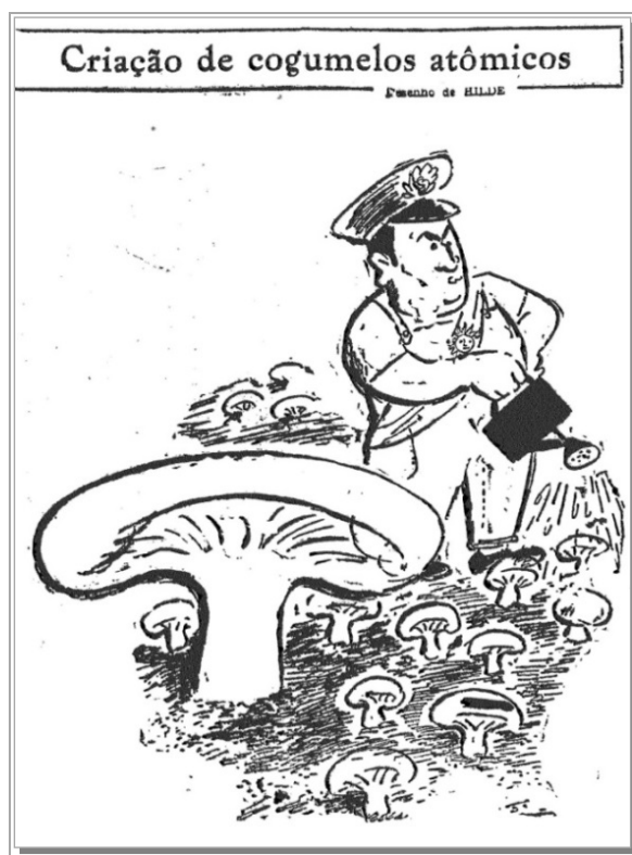
Figura 13 - HILDE.