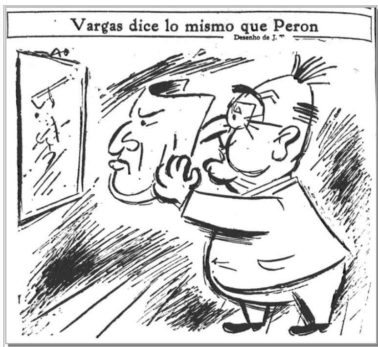
Figura 8 - HILDE.