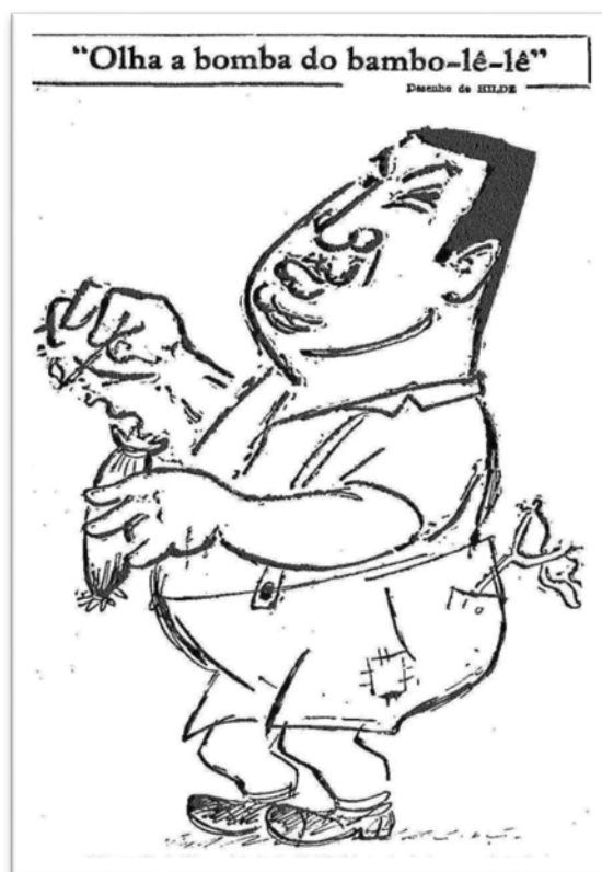
Figura 12 – HILDE.

Perón garantiu que o projeto secreto era de caráter pacífico e objetivava a produção de energia para fins industriais. No entanto, o principal responsável pelos experimentos, um cientista alemão desconhecido, de nome Ronald Richter, garantiu que o país já conhecia o segredo da bomba de hidrogênio e poderia produzi-la, se necessário. O anúncio foi recebido com enorme ceticismo pela imprensa e pelo meio científico internacional. Embora a Casa Rosada tenha se negado a dar detalhes adicionais, as extravagantes descrições técnicas de Richter tinham muito pouco a ver com as investigações do gênero feitas por soviéticos e estadunidenses.