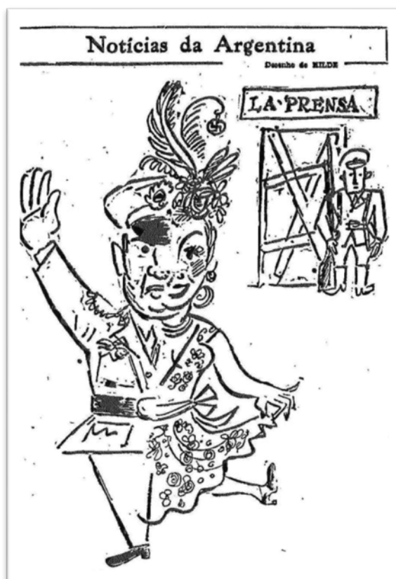
FIGURA 2 - Tribuna da Imprensa .

A medida teve ampla repercussão em todo o mundo ocidental e foi criticada em vários meios de comunicação brasileiros. Um mês antes da expropriação se confirmar, Hilde publicou uma charge (Figura 2) na qual denunciou o fechamento arbitrário do jornal, representado por um soldado armado junto à porta lacrada. No primeiro plano, aparecem dois personagens fundidos em um – Perón e sua esposa, Evita. Enquanto o primeiro, com expressão grave, faz uma saudação que remete ao nazifascismo, a segunda dança alegremente. Esse movimento corporal remonta à sua origem como atriz de rádio e teatro. Seu sorriso despreocupado contrasta com o cenário sombrio. Em mais de uma ocasião, Lacerda condenou o que julgava ser uma “ditadura a quatro mãos, que caiu sobre a Argentina, como uma maldição” (LACERDA, 09/03/1951, p. 4).