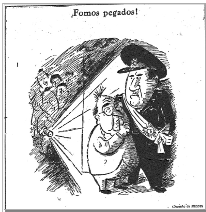
Figura 10 - HILDE.

É a isso que se refere a Figura 10. O pequenino Getúlio (cerca de 1,60 de altura), que agiria na escuridão, pede silêncio a Perón após serem descobertos em seus planos secretos (“Fomos pegados!”). A lanterna da cena pode remeter a, pelo menos, dois aspectos. Em primeiro lugar, era o símbolo do próprio jornal e estava relacionada ao ideal de objetividade da imprensa que reivindicava o posto de reveladora da verdade, ou seja, promotora das luzes. Nesse sentido, também é curiosa a descoberta do “crime” por várias pessoas e não apenas uma. Isso alude à tradicional noção do jornalismo como porta-voz da opinião pública, ou seja, meio de expressão de toda a sociedade e não de interesses particulares. Em segundo lugar, vale lembrar que Lacerda e outros udenistas haviam fundado em 1953 um grupo de militares e civis de postura radicalmente antigetulista e anticomunista que carregava o sugestivo nome de “Clube da Lanterna” (BENEVIDES, 1981, p. 86).