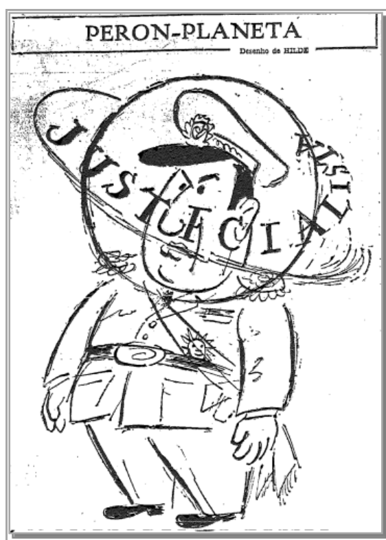
Figura 14 – HILDE.

No dia posterior à manchete, Hilde satirizou o presidente argentino, colocando sua grande cabeça como um planeta ao redor do qual girava um anel (Figura 14). Indiretamente, criticava-se a megalomania do regime e a atitude despropositada de atribuir o nome de um movimento político tido por demagogo a uma descoberta tão importante. Em outra chave de leitura, pode-se pensar que, na visão da artista, a cabeça de Perón continha pensamentos tão exóticos que só podia ser vista como um mundo à parte. Seus pensamentos seriam tão estranhos que pareciam originários de outra realidade.