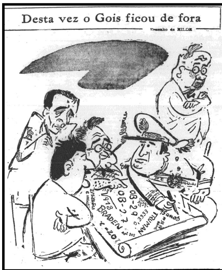
Figura 6 – HILDE.

Em 22 de junho de 1950, outra charge da artista alemã remeteu à ideia de conjura, tema que se tornou cada vez mais frequente nos diários antigetulistas, na medida em que se aproximavam as eleições presidenciais. Nela, Perón ensina planos políticos a Getúlio Vargas, Luis Carlos Prestes e Ademar de Barros (Figura 6) 9 .