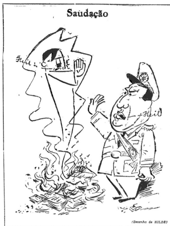
Figura 1 – HILDE.

entre tal situação e os espetáculos públicos de queima de livros ocorridos na Alemanha nazista em 1933. Ao lado do desenho, publicou-se um editorial de Lacerda em que Perón era apontado como discípulo aperfeiçoado de Vargas. Também foram destacadas as características autoritárias de seu governo e sua admiração, junto com outros membros do GOU, pelos países do Eixo durante a Segunda Guerra.