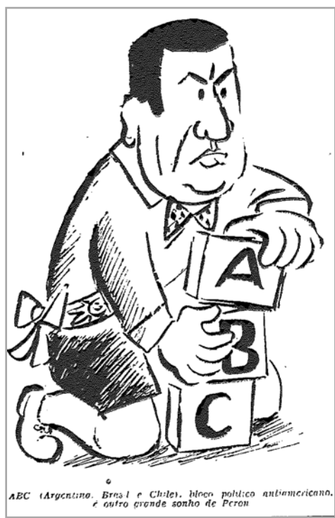
Figura 4 – Autoria desconhecida. Fonte: Tribuna da Imprensa , 25/09/1952, p. 12.

Chama atenção o isolamento do presidente argentino na cena, ou seja, a ausência de líderes de Chile e Brasil que, subentende-se, estariam sendo manipulados. Também curiosas são suas vestimentas que, em outra chave de leitura, remetem à ideia de uma molecagem, uma travessura irresponsável. Há efeito cômico ao colocar o líder justicialista, tão sisudo e poderoso, em trajes pueris. Também fica implícita a ideia de que ele possuiria a personalidade de uma criança mimada e, ao mesmo tempo, megalomaníaca. Pode-se pensar ainda que, do ponto de vista do artista, o Pacto ABC não passaria de uma aventura tão imatura e imprudente quanto uma brincadeira infantil.