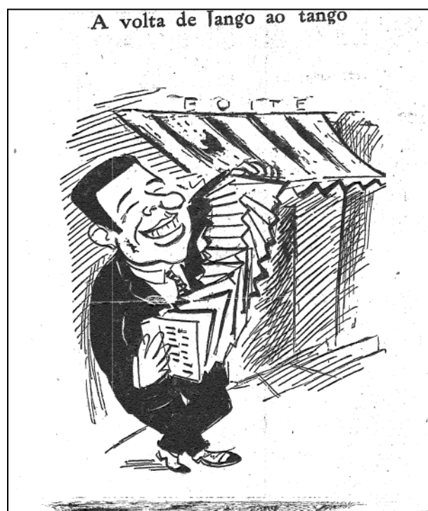
Figura 9. HILDE.

A atuação de João Goulart provocou forte reação também nos quartéis. Ela culminou na veiculação do “Manifesto dos Coronéis”, assinado por 82 oficiais da ala conservadora do Exército no Rio de Janeiro. Após a publicação do documento, o jovem ministro foi exonerado, a contragosto de Vargas, no final de fevereiro de 1954. Nos traços de Hilde Weber, a saída de Jango foi comemorada com uma referência mordaz ao justicialismo. Demitido, o político gaúcho voltaria à vida boêmia e à Argentina peronista, onde poderia bailar o tango (Figura 9).