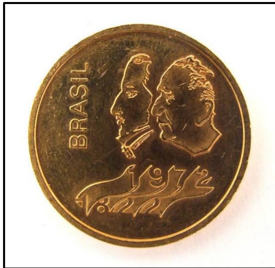
Figura 3. A difusão de moedas comemorativas, pela ocasião do Sesquicentenário da Independência, vincula a efígie de D. Pedro I ao Presidente General Médici.

praticada e discutida no Brasil desde a década de 1920, sobretudo nas comemorações do centenário da Independência brasileira (1922) e do nascimento de D. Pedro II (1925). Entretanto, a estratégia do regime militar em conduzir o primeiro Imperador à virtude e mitificá-lo junto ao panteão dos heróis nacionais promove uma reelaboração de elementos simbólicos no afã de vincular sua personagem a um ideal de líder militar, representante da “unificação do país” e “fundador do Império brasileiro”. Por meio das tramas imagéticas constituídas no evento e difundidas nas revistas Manchete e O Cruzeiro , as representações simbólicas do herói morto e de seus feitos em vida esforçam-se em sugerir uma continuidade na liderança militar, para interrelacionar D. Pedro I com o presidente Médici. Os ritos e os símbolos representados são significativos deste intento, a exemplo do logotipo do Sesquicentenário, criado por Aloísio Magalhães, que apresentava, em forma de vinheta, as datas interligadas de 1822 e 1972, ou por meio de elementos materiais: cunhagem de moedas (Figura 3) e medalhas comemorativas, as quais associam a efígie do presidente militar à do “imortal” Imperador, com o objetivo de perpetuar os vínculos entre os homens das armas.