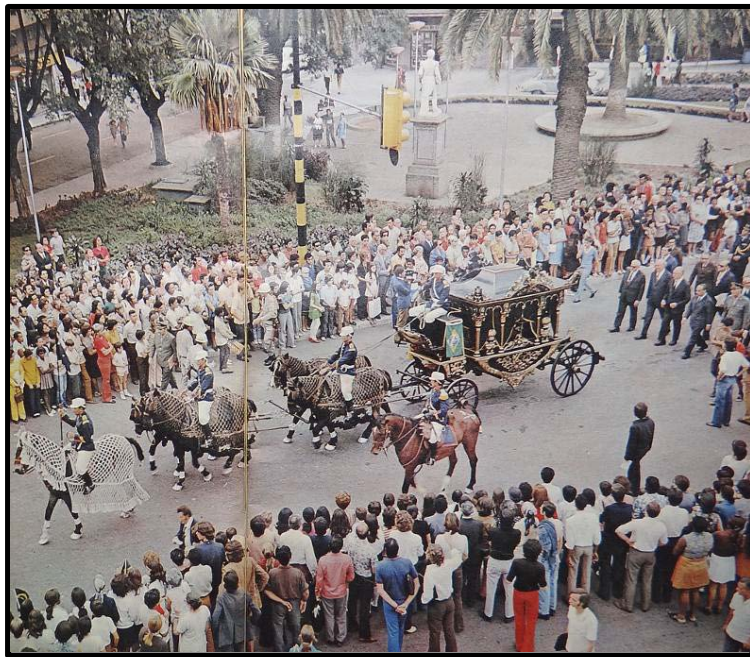
Figura 5: O esquife chega a Porto Alegre na peregrinação dos restos mortais de D. Pedro I, em 25 de abril de 1972. (MANCHETE, 13 mai. 1972, p.16-17)

de Abril, o cortejo mobiliza um desfile no qual o caixão é ladeado por uma comitiva militar e está transportado sobre uma carruagem fúnebre (Figura 5), elemento que enfatiza o aspecto solene, ainda que sombrio, que cerca as tramas imagéticas de parte das comemorações do Sesquicentenário. A escolha de Porto Alegre como local para início dos desfiles, não foi casual e insere-se na função simbólica de rememorar um elemento da história militar, a saber, o envolvimento do imperador com a campanha na Província Cisplatina, em 1826, em referência à sua atuação na marcação territorial brasileira na região sul.