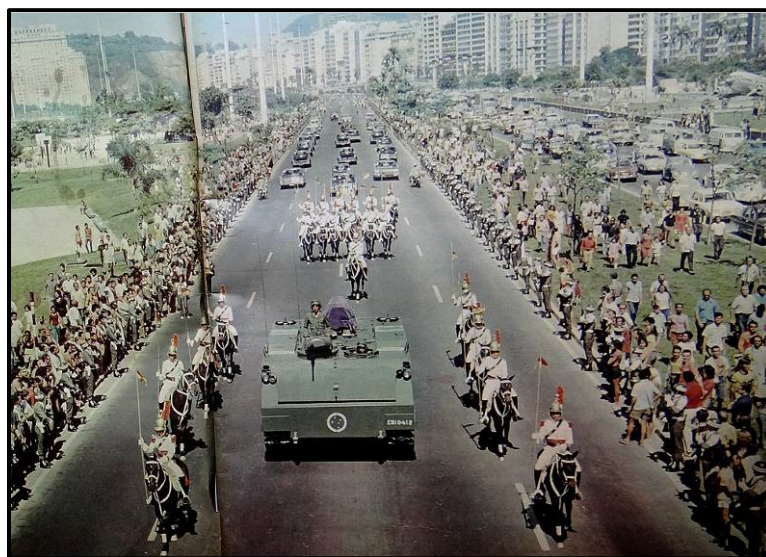
Figura 2. O corpo do imperador morto é transportado sobre um tanque de guerra, ao longo do Parque do Flamengo, no Rio de Janeiro em 1972. (MANCHETE, 6 maio/ 1972, p.7).

A constituição do evento fomenta uma ressignificação de elementos da história pátria, executada após um acordo diplomático luso-brasileiro que promove o retorno ao Brasil de parte dos restos mortais do “imortal” D. Pedro I, com exceção do coração, deixado por ele em testamento à cidade do Porto. O esquife do primeiro imperador é transportado por uma comitiva liderada pelo presidente português, Almirante Américo Tomás, e chega ao Brasil em 22 de abril de 1972, momento significativo, pois sugere uma associação aos projetos de comemoração do assim chamado “protomártir” da Independência, a saber, Tiradentes, em 21 de abril. Esta tentativa de articular as personagens de D. Pedro I e Tiradentes evidencia os usos de fragmentos da história por parte do governo militar, em vias de associar a imagem do líder monárquico, símbolo nacional, com o alferes inconfidente, figura central no panteão de heróis instituído pelo regime republicano no Brasil (CARVALHO, 1993, p.55).