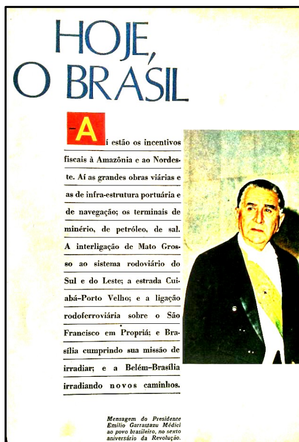
Figura 1. Mensagem do Presidente Médici quando o governo autoritário comemorou seis anos da chamada “revolução”, no ano de 1970, recuperada para os festejos do Sesquicentenário da Independência. (O CRUZEIRO, 13 set./1972, p. 29).

Na edição especial de O Cruzeiro, o destaque recai sobre o Brasil de “ontem”, personificado na figura de D. Pedro I e, em seu arcabouço iconográfico, também fica evidenciado o Brasil de “hoje” (Figura 1), manifesto na imagem do presidente general, cujo discurso reforça as grandes obras de efeito desenvolvimentista em sua gestão, por ocasião das comemorações de seis anos do Golpe civil-militar de 1964, denominado pelos militares como “revolução”, em abril de 1970.