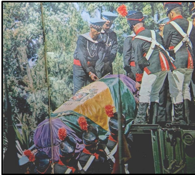
Figura 4: Sobre ombros e mãos militares, o esquife do “libertador” é levado do Monumento aos Mortos da Segunda Guerra Mundial ao Museu Nacional. Rio de Janeiro, Abril de 1972. (MANCHETE, 6 maio/1972, p.12-13)

Em outra fotografia, o esquife imperial é retirado pelos “Dragões da Independência” (Figura 4) e os despojos de D. Pedro I são entregues pelo presidente português, Almirante Américo Tomás, ao presidente brasileiro, General Médici. Este ato simbólico foi realizado no monumento dedicado aos mortos da Segunda Guerra Mundial, enquanto aviões da Força Aérea Brasileira realizavam suas acrobacias para marcar o espetáculo.