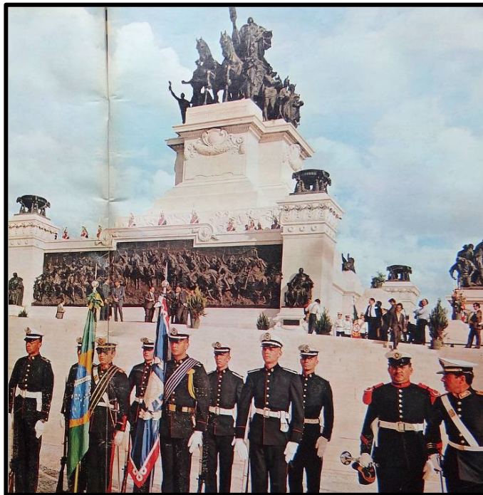
Figura 6. As solenidades do Sesquicentenário da Independência, no Monumento do Ipiranga, em São Paulo, demonstram a ênfase nos elementos militares (MANCHETE, 13 maio/1972, p. 6-7).

Este passado é materializado nas representações de monumentos vinculados à história pátria e à Independência, a exemplo do Monumento do Ipiranga, em São Paulo. A estátua equestre de D. Pedro I figura de modo expressivo nas imagens do Sesquicentenário e, além de simbólica, cumpre uma função narrativa, pois se refere ao momento preciso do grito da Independência. Em seu aspecto memorativo, “o monarca é fixado para a eternidade no momento em que proclama o nascimento do Brasil e garante sua unidade” (ENDERS, 2000, p. 57). As imagens das estátuas equestres do imperador apontam os investimentos da política autoritária na cristalização da memória em vias de “evocar o passado e perpetuar a recordação” (LE GOFF, 1990, p.536) por meio das tramas imagéticas. O intento do governo militar em construir um aspecto solene e heroico em torno do Imperador é ilustrado nos símbolos e nos monumentos produzidos nesta conjuntura histórica e representado nas edições da Revista Manchete (Figura 6).