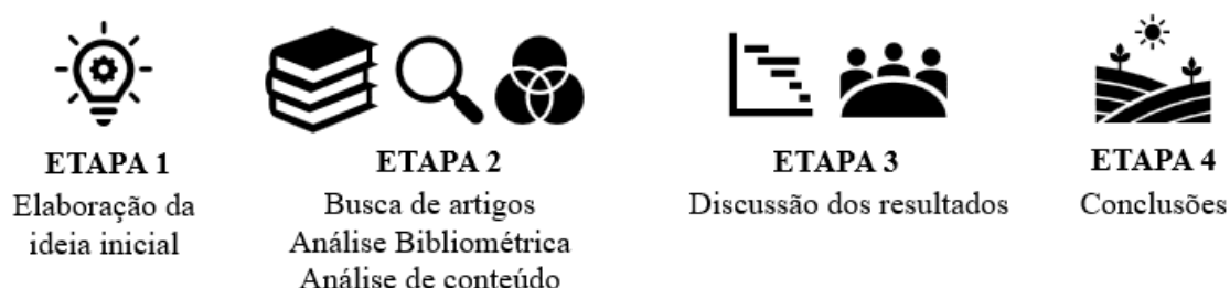
Figura 5 – Sequência das atividades realizadas

A elaboração do trabalho em questão aconteceu conforme etapas observadas na Figura 5, partindo da ideia inicial, passando pela busca de artigos, análise bibliométrica e revisão de literatura (análise de conteúdo), finalizando com a discussão dos resultados e conclusão do trabalho.