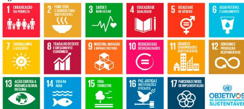
Figura 4: 17 ODS