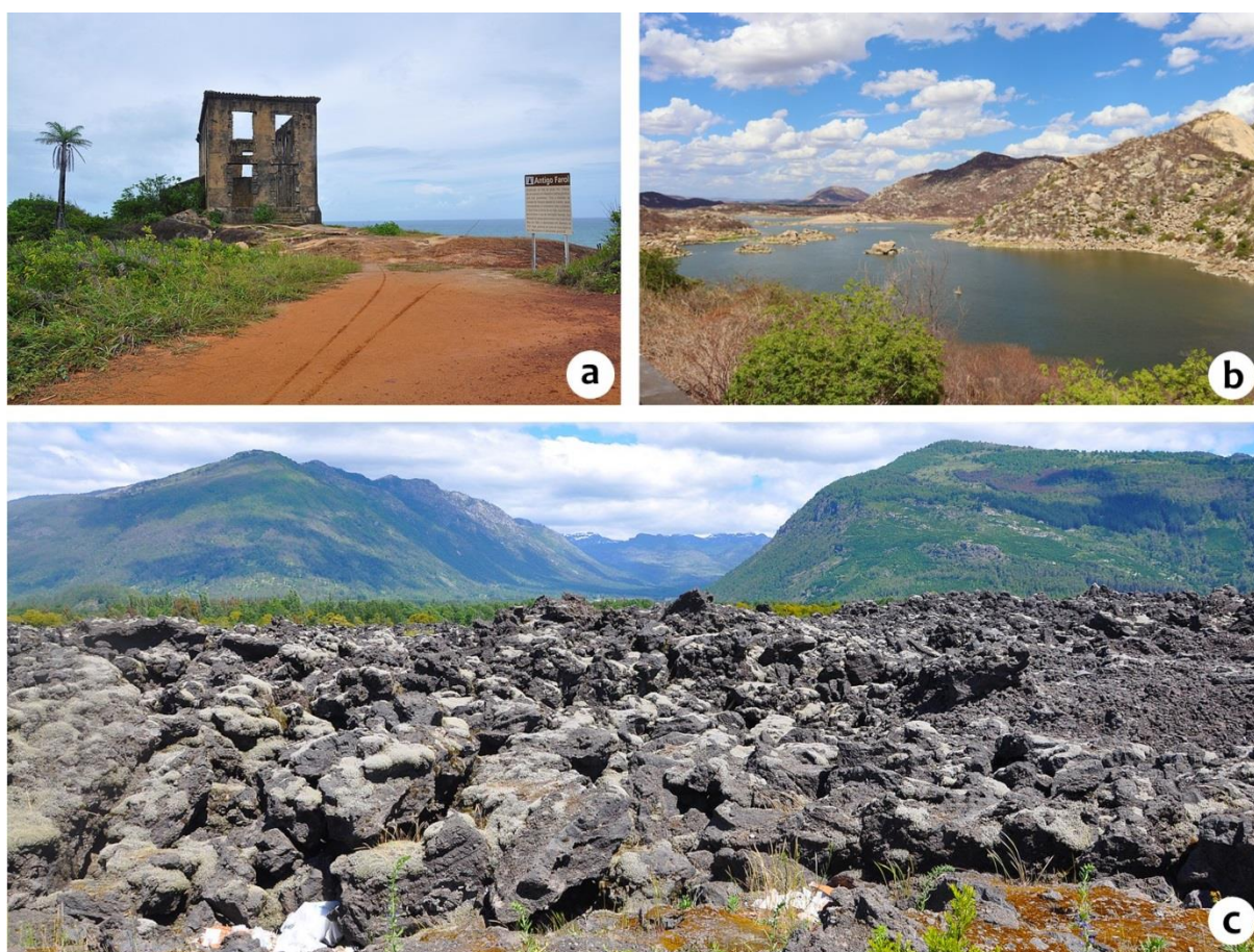
Figura 1 - Exemplos de geopatrimônio em diferentes tipos de paisagem. (a) Edificação histórica (Casa do Faroleiro – Séc. XIX) sobre o Granito do Cabo, datado em aprox. 102 Ma, está associado à separação dos continentes Sulamericano e Africano (Cabo de Santo Agostinho/PE). (b) Geossítio Açude Gargalheiras – associação da geodiversidade e intervenções antrópicas no Seridó Geoparque Mundial da UNESCO (Acari/RN). (c) Paisagem vulcânica e Vale glacial em formato de U – Geoparque Kütraulkura Mundial da UNESCO – Região da Araucania – Chile