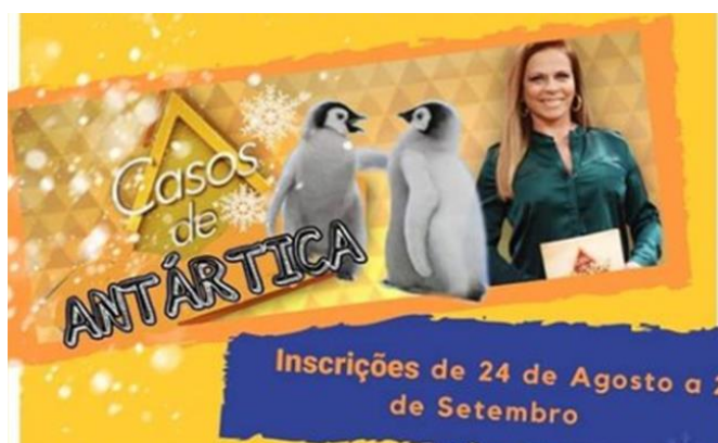
Figura 1 - Cartaz de divulgação do curso de extensão “Casos de Antártica”

Este artigo traz uma discussão descritiva e qualitativa acerca de um curso de extensão, realizado no período de setembro a dezembro de 2020, no formato online , denominado “Casos de Antártica”. O nome do curso faz uma alusão ao programa televisivo: “Casos de Família” (Figura 1) e foi escolhido por justamente retratar em cada episódio uma história diferente envolvendo uma narrativa, personagens e uma situação-problema polêmica. Além disso, o tema foi escolhido para causar uma curiosidade inicial nos alunos, visto que a divulgação do curso foi realizada principalmente nas redes sociais (Figura 1). Também houve uma divulgação utilizando o e-mail da coordenação do curso de Geografia da Universidade Federal de Santa Maria.