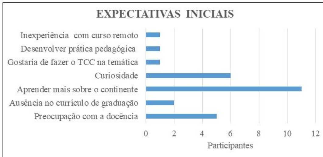
Figura 3 - Resposta dos participantes em relação à sua expectativa com o curso