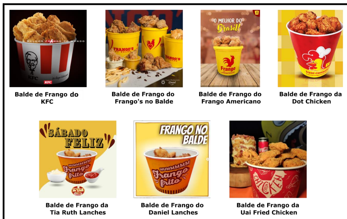
Figura 4 – Baldes de frango comercializados pelos estabelecimentos