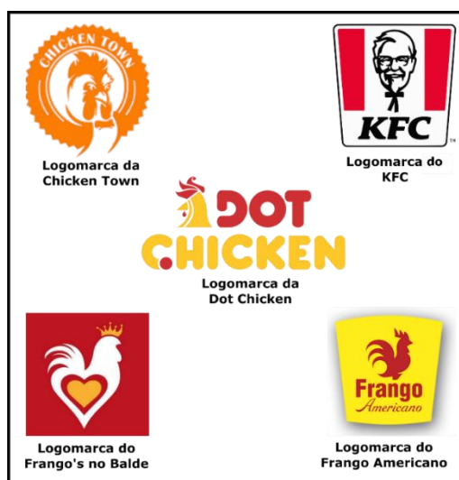
Figura 3 – Logomarcas dos estabelecimentos especializados em frango frito no balde