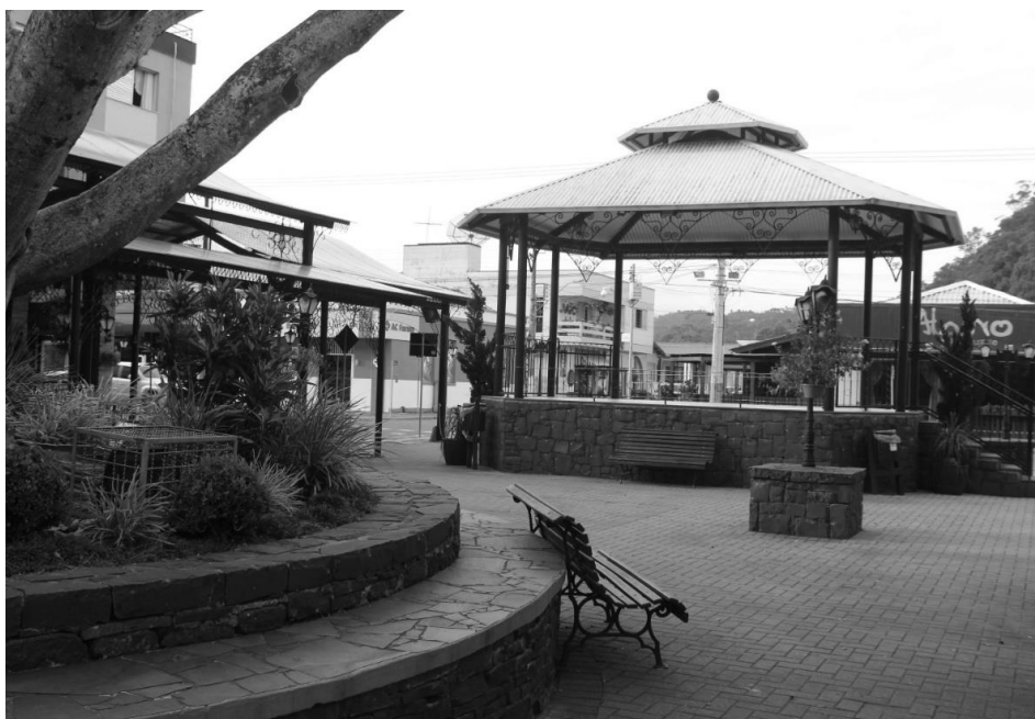
Figura 9 – Coreto

atingem, como já elucidamos, a construção da própria cidade, principalmente no que diz respeito ao centro de NV. Hoje, como vimos, essa identificação se apega a uma Itália distante da que chegou no Brasil, no final dos anos 1800, recorrendo, assim, a uma italianidade contemporânea e à tentativa de aproximação a uma “arquitetura europeia histórica”, fazendo alusão a uma Veneza, nunca presente; como num cenário fictício, criado 32 .