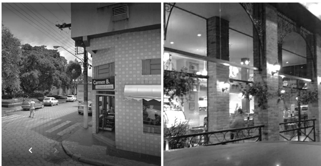
Figura 10 – Edificação antes e após a chegada da gôndola. Hoje, recebe a Gelateria Gheppo (à direita)