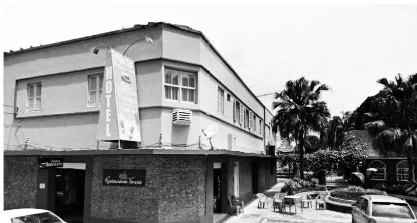
Figura 4 – Ristorante-Hotel e sua interface com a Praça H. B. há dez anos

Segundo Arantes (2002), a “âncora identitária”, ou a “isca cultural”, está presente na lógica do planejamento estratégico à medida que “o que está em promoção é um produto inédito, a saber, a própria cidade, que não se vende [...] se não fizer acompanhar de uma adequada política de image-making ” (ARANTES, 2002, p. 17). Assim, a image-making de NV parece ter surgido com a própria “simplicidade” da gastronomia típica e da arquitetura (histórica ou não), em que, por detrás dessa simplicidade, há uma aparente espetacularização daquilo que se produz[iu] – material e imaterialmente – mediante a isca cultural da colonização 21 italiana, que alude, entretanto, a uma noção de italianidade que não diz respeito ao resgate da história dos imigrantes (PREIS JR., 2017). Mas, contrariamente, criam uma fantasia de que estamos na própria Itália, ainda que em território brasileiro. A exemplo de tal fantasia, podemos citar: o Carnevale di Venezia (Figura 5), criado em 2007, as grandes festas Dolce Páscoa e Natal Luz 22 que ocorrem anualmente no entorno da Praça H. B., bem como a própria produção arquitetônica do pequeno lago, que recebe a gôndola Lucelli e compõe o cenário para tais eventos.