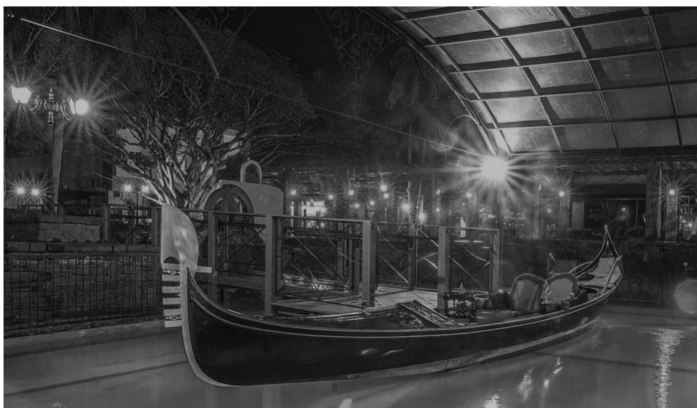
Figura 8 - Gôndola Lucelli