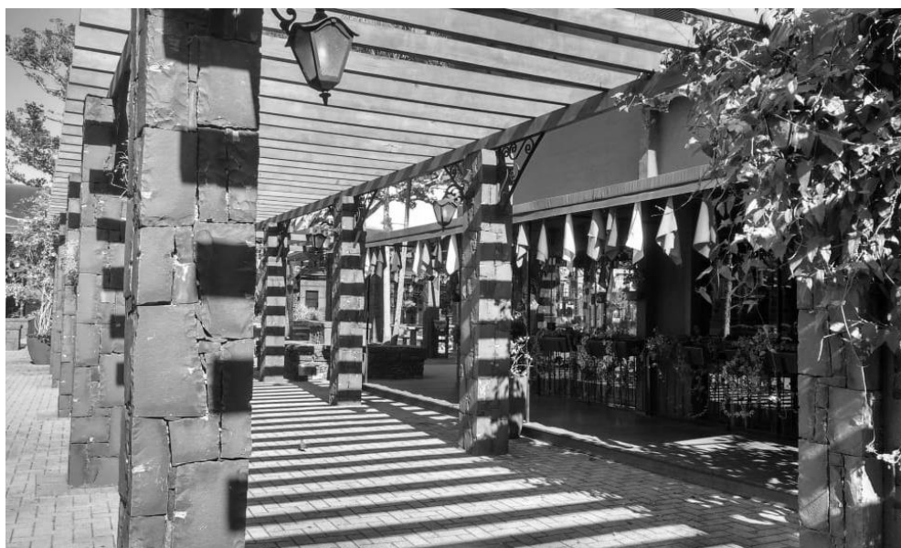
Figura 6 - Lateral do Ristorante - interface com a Praça

construção do memorial dos imigrantes – no entorno do lago que recebe a gôndola –, o qual dispõe os sobrenomes das famílias colonizadoras, do final do século XIX. Talvez este seja um dos únicos elementos que possa remeter a alguma história que nos leve, de fato, ao povo imigrante que colonizou tal região naquela referida época. Esse memorial é acompanhado por uma Roda D'água, que além de sua simbologia acerca de uma NV habitada e colonizada por “batalhadores”, tem a função de ajudar a manter limpa a água do lago, semanalmente tratada por funcionários da praça.