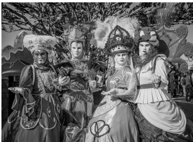
Figura 5 – Carnevale di Venezia na Praça H. B., s/d

Considerando o ponto de vista desse morador e aludindo, aqui, a Harvey (1992, p. 273), “[...] a tradição histórica é reorganizada como cultura de museu, [...] de história local, de produção local, do modo como as coisas um dia foram feitas, vendidas, consumidas e integradas numa vida cotidiana há muito perdida e com frequência romantizada.” No caso da cidade em questão, muitos elementos não foram perdidos, mas inventados e romantizados. Importa aqui destacar que “quando os imigrantes italianos colonizaram Nova Veneza no fim do século XIX, o carnaval já havia sido proibido em Veneza [na Itália] há mais de um século.” (PREIS JR., 2017, p. 40).