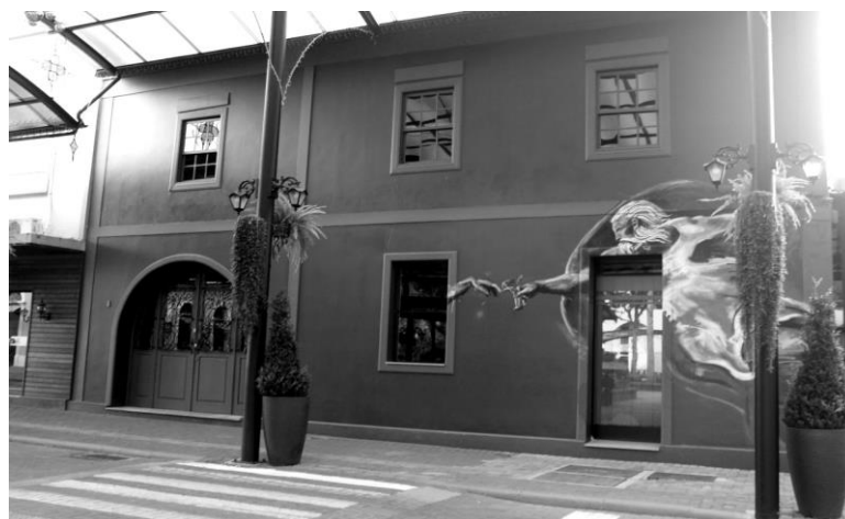
Figura 7 – Rua Coberta

Natalia D'Agostin Alano, Natassia D'Agostin Alano