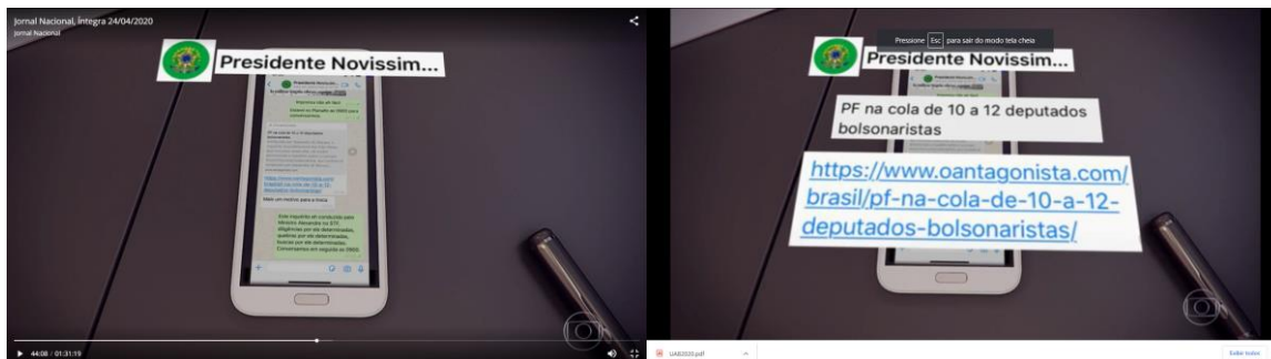
Figura 4 – Recursos gráficos são utilizados para ilustrar a troca de mensagens entre Moro e Bolsonaro