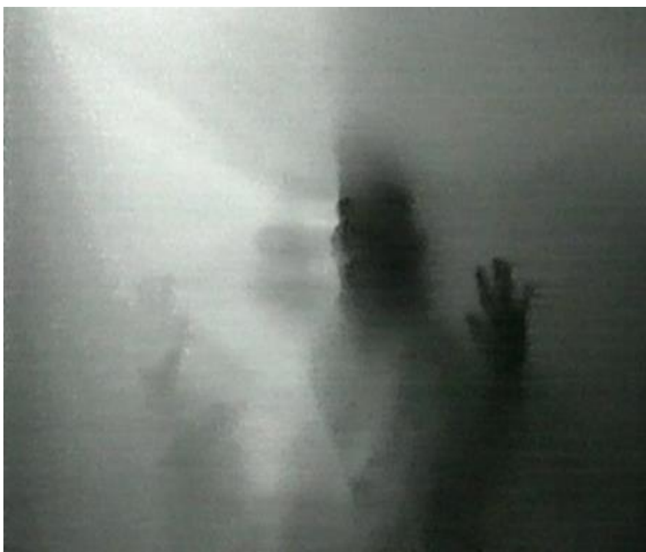
Imagem 2 - Helena Almeida. Ouve-me , 1979. VídeoSuper 8, VídeoDVD e VídeoVHS

Pode a mulher artista falar? A experiência de Helena Almeida a partir da série Ouve-me (1978-80) Vera Rozane Araújo Aguiar Filha