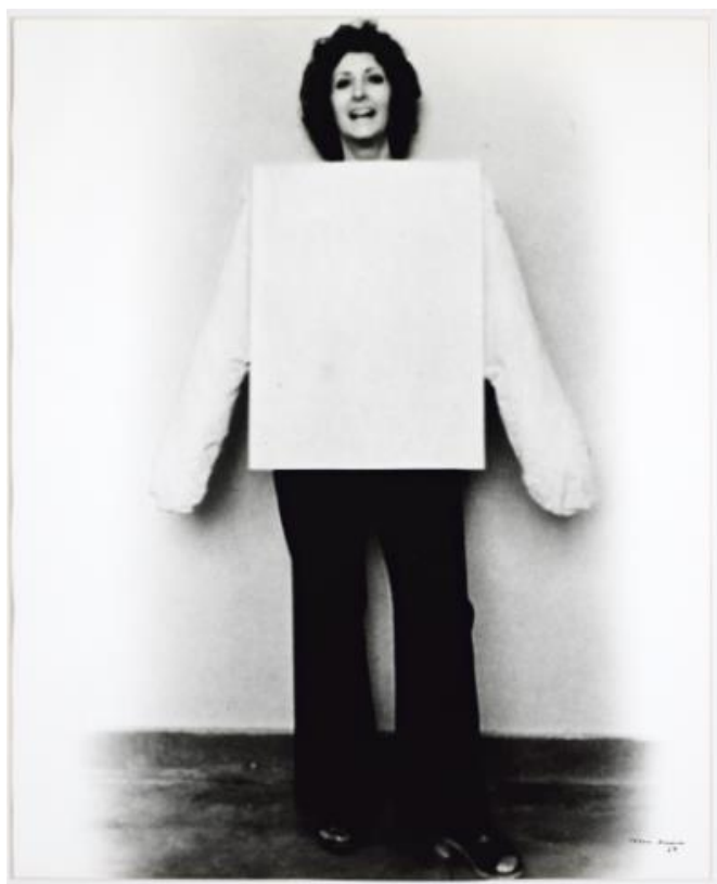
Imagem 1 - Helena Almeida. Tela rosa para vestir , 1969