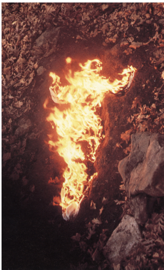
Fig. 3 - Ana Mendieta. Hojas Rojas Silueta (da série Silueta), 1977. Fotografia.

É possível observar as constantes realocações do corpo, e principalmente a quebra de fronteiras. Os contornos se dissolvem, desaparecem no vazio da silhueta dos corpos, o deslocamento e essa quebra, que rejeita o colonialismo, pensando em termos contemporâneos, a urgência da decolonização, a obra traz essa necessidade do repensar, das revisões historiográficas e dos territorialismos impostos e propostos durante a história. O lugar, o deslocamento, o pertencimento originário dos povos e seu constante apagamento pela história (Figuras 3 e 4).