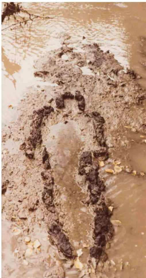
Fig. 4 - Ana Mendieta. Sem título (da série Silueta), 1977. Fotografia.

O corpo transita por paisagens, ao percorrer o México é possível perceber os simbolismos e esse desejo por origens da artista, a inspiração em sua ancestralidade e a busca em cada vez mais pertencer, na luta por terras, nos locais em que foram desenvolvidas as silhuetas é possível indicar tradições pertencentes aos povos e sua cultura e a forte relação que a cultura mexicana estabelece com a morte. A artista parece lembrar e expressar essas culturas esquecidas e totalmente apagadas pela colonização.