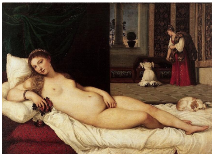
Fig. 1 - Ticiano Vecelli. "Vênus de Urbino", 1538. Óleo sobre tela – 119 x 165 cm, Galleria degli Uffizi, Florença.

A célebre pintura Vênus de Urbino (1538) de Ticiano [Fig.1] nos remete às inúmeras imagens que representam o corpo feminino de forma estereotipada, seja pelo nu que expõe o corpo e o torna um objeto frente ao olhar masculino ou ainda a metáfora da entrega e sedução do feminino, que de igual forma condiciona o lugar da mulher submetida ao desejo masculino em função da maneira como é representada.