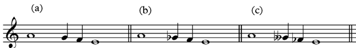
Fig. 1: Exemplos dos três gêneros básicos de tetracorde: (a) diatônico; (b) cromático; (c) enarmônico

Entretanto, alguns tratadistas do período, como Quintiliano, preconizavam um maior número de tetracordes e gêneros. Barry, baseado em Quintiliano, entende que na prática o número de tetracordes limitava-se pela diferença perceptível de “gênero, sombra e espécie” (Barry, 1919, p.579). Barry fornece exemplos de seis formas de tetracordes: diatônico normal e diatônico suave (soft diatonic); cromático normal, cromático hemiolico e cromático suave; enarmônico. Os tetracordes eram combinados de modo a constituir os modos, que se estruturavam basicamente pela junção de dois tetracordes. Esta união de tetracordes poderia formar uma escala conjunta, disjunta ou mista (ver Fig. 2a, 2b e 2c, respectivamente). Como explica Barry, que analisou diversas composições musicais da Grécia antiga, “se dois desses [tetracordes] eram combinados de modo que uma nota comum servisse como a nota mais aguda do tetracorde infe-