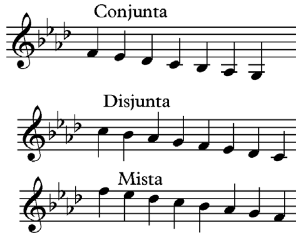
Fig. 2: Três resultantes escalares geradas pela junção de tetracordes (Barry, 1919, p.580)

rior e a mais grave do tetracorde superior, a escala resultante era conjunta, tendo uma extensão de sétima menor. Mas, se o intervalo de um tom separava os dois tetracordes, a escala era então definida com disjunta, por causa da presença do tom de disjunção. Se, entretanto, a escala conjunta fosse estendida de modo a compreender uma oitava, pela adição de um intervalo de um tom na sua base, a escala torna-se mista ou de forma alternada.” (BARRY, 1991, p.580).