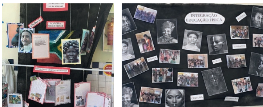
Figura 5: Resultado da pesquisa sobre hábitos e costumes.

Outra pesquisa foi realizada com as famílias sobre os costumes e hábitos de cada uma delas e, concomitante a isso, o Grupo de trabalho pesquisou costumes e hábitos de alguns povos africanos, o que culminou numa oficina de pintura de rostos e corpos para todos os grupos, no refeitório e no parque de nossa instituição. Pinturas que simbolizam preparação para a caça, participação ou comemoração de um evento, que podem significar amor, beleza e pureza, que podem identificar famílias e clãs, que podem significar a iniciação numa nova fase da vida ou representar uma forma de agradecimento aos antepassados. A pesquisa realizada com as famílias foi exposta com as imagens investigadas pelas professoras e apresentadas no decorrer da pesquisa às crianças. Ambas as pesquisas foram expostas no refeitório. E crianças de diferentes grupos tiveram seus rostos, braços, pernas pintadas, bem como pintaram/marcaram seus amigos com pintura de rosto, num momento de celebração e de encontro entre todos os grupos.