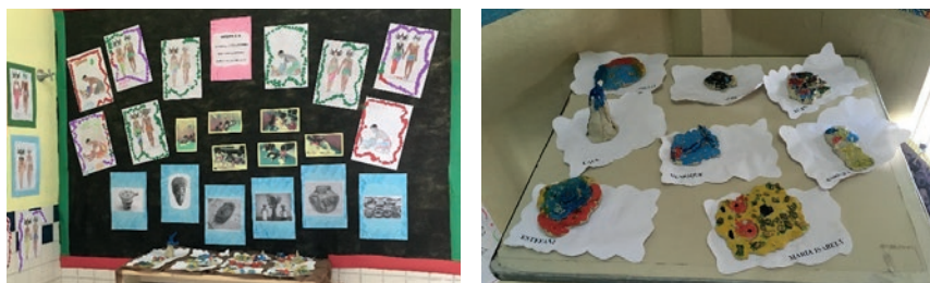
Figura 8: Painel de fotos do grupo e das pesquisas realizadas e destaque às produções em argila

Também foi realizada a pesquisa e a oficina de produção de esculturas com argila. Em um painel, o grupo colocou imagens de produtos feitos com argila, imagens próprias confeccionando seus objetos de argila e imagens do trabalho feito a partir do filme Kiriku e a feiticeira.