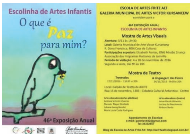
Figura 8: Convite da exposição “O que é paz para mim?”

por exemplo as cápsulas de sementes e as bandeirinhas inspiradas na cultura tibetana, com mensagens de paz. Essas ações colaboraram para uma unidade do projeto e a sua culminância na 46.ª Exposição Anual da Escolinha de Artes Infantis, com o tema “O que é paz para mim” (figura 8) (título pensado e escolhido pelos alunos por meio de votação), realizada na Galeria Municipal de Artes Victor Kursancew (figura 9).