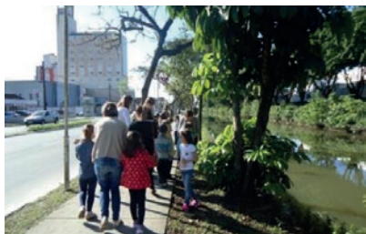
Figura 3: Passeio com os alunos à beira do Rio Cachoeira, principal rio que corta boa parte da área urbana de Joinville