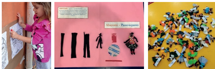
Figura 7: Pintura de máscaras nos espaços externos do NEIM, cartaz sobre as Abayomis

Os grupos 5 e 6 fizeram pesquisas sobre as máscaras africanas, e das máscaras surgiu a possibilidade de pintura coletiva de diferentes tipos, coladas no papel pardo e espalhadas pelas paredes de nosso NEIM. Outro trabalho realizado nestes grupos foi a pesquisa sobre as Abayomis, sendo que esta serviu à realização da atividade coletiva de contação da história realizada por uma das professoras acerca da travessia dos povos africanos para o continente americano. Na história, a professora contou às crianças da esperança da boneca, enquanto um acalanto às crianças que atravessaram o Oceano Atlântico em tempos de exploração e sofrimento. Posterior à contação da história, houve a realização da oficina de chaveiros com as bonecas, que contou com a participação de alguns familiares que se propuseram a vir ao NEIM, e um cartaz sobre o modo de fazer as bonecas foi exposto, pois os pais queriam saber o modo de fazê-las.