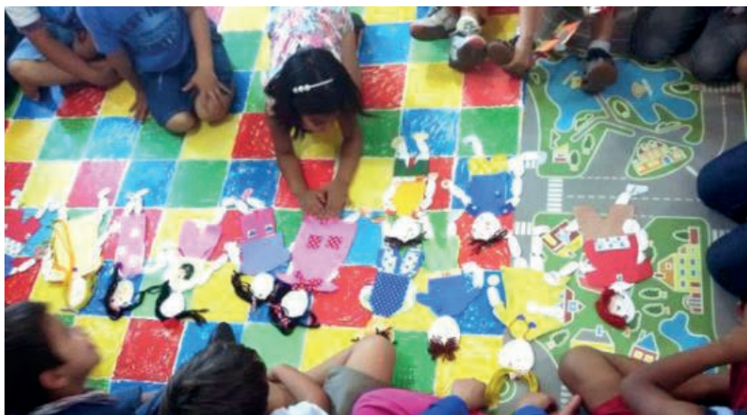
Figura 7: Construção de autorretratos com bonecos articulados na ONG Missão Criança, com ação educativa dos professores da Escolinha

O outro projeto escolhido foi um local: ONG Missão Criança. As crianças da Escolinha fizeram uma integração com essa ONG do bairro Jardim Paraíso, uma localidade da periferia de Joinville. As crianças das duas instituições trocaram cartas e construíram autorretratos em bonecos articulados de papel (figura 7). Durante o período expositivo do projeto as crianças da ONG fizeram uma visita à Escolinha e tiveram a oportunidade de ver seus trabalhos expostos na Galeria Municipal de Artes Victor Kursancew.