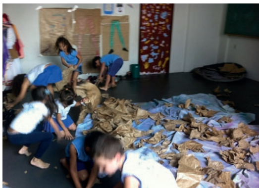
Figura 1: As crianças seguem experimentando o papel Kraft e o tecido