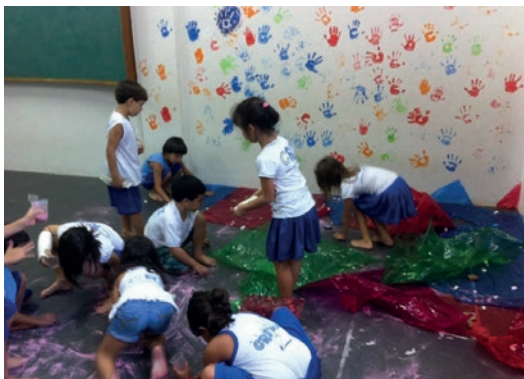
Figura 3: As experimentações seguem com as materialidades distintas

Para ver essa teatralidade, o adulto deve parar de esperar da criança formas estéticas que dialoguem com nossa definição de artístico. Acho muito perigoso insistirmos em valorizar um tipo de produção artística que sempre espera uma espetacularização do fazer teatral. As crianças criam e são muito boas ao fazerem isso, mas, como nos alerta Holm, esse processo “[...] É selvagem, é louco, é maravilhoso [...]” (2004, p. 92). Maravilhada com as primeiras experiências de Experimentação de Texturas com as turmas de 2 a 5 anos segui com essa proposição nos anos seguintes, passando por outras escolas nas quais trabalhava, tendo encontros texturizados com outras crianças, usando outros materiais, lidando com diferentes possibilidades espaciais.