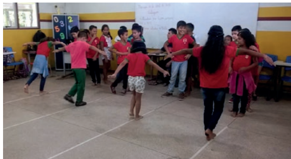
Figura 1: Aula adaptada na sala de aula para equilíbrios