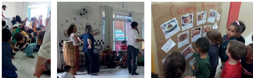
Figura 6: Oficina de dança, apresentação de instrumentos musicais, e painel sobre culinárias

A literatura também se fez presente na exploração do livro Olelê: uma antiga cantiga da África . As professoras trouxeram a música apresentada no livro e as crianças brincaram com a exploração dos movimentos de seus corpos na dança, no falar das palavras de outros povos: moliba, macassi, olelê, cassaí. Fizeram barcos de papel, e brincaram com o barco utilizado na dramatização da história. Construíram um painel com dobraduras de barcos e a foto de cada criança navegando seu barco na travessia. Conforme afirma Debus (2017, p. 38) “o texto literário partilha com os leitores, independente da idade, valores de natureza social, cultural, histórica e/ou ideológica por ser uma realização da cultura e estar integrado num processo comunicativo”.