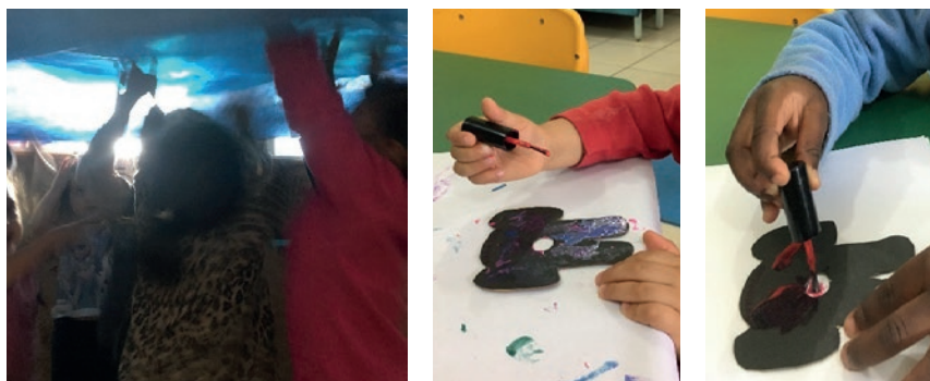
Figura 4: Fazendo as estrelas no céu, uma das fotos do livro e Pintura do elefante com esmalte de unhas

Outra história que acompanhou o trabalho no Grupo 3 foi Obax, um texto de ficção, em forma de livro, escrito e ilustrado por André Neves (2010), e ambientado na África. Neste livro, Obax, uma menina negra, e seu elefante Nafisa, são os personagens principais. O encantamento do grupo de crianças pela figura do elefante, levou-as a construir elefantes em forma de dedochê, pintados com esmalte de unha, com os quais brincaram, acompanhando-as nas reinvenções de histórias. O grupo fez uma pesquisa sobre os elefantes, aprendeu sobre as matanças do animal para a extração do marfim, viu que eles transportam pessoas em várias localidades e descobriu que quando eles ficam bem velhinhos se afastam do grupo para morrerem sozinhos. Brincaram de elefante colorido, cantaram a música do elefante que incomoda muita gente, do elefante lá' trombita, e do elefante que se balançava na teia da aranha... Músicas, histórias, dedoches e pesquisa. Muita pesquisa.