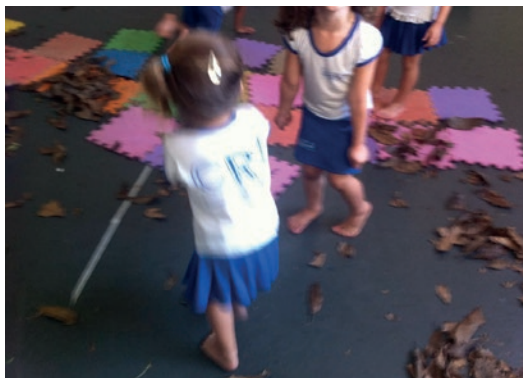
Figura 2: A floresta criada com as folhas secas

Tantas outras vezes eu contava histórias que envolviam o material, tal como foi feito quando usamos as folhas secas. Nessa situação, o espaço já estava preparado com muitas folhas. Desde quando adentramos à sala, propus que ali seria uma floresta, uma mata e, logo, as primeiras experimentações se deram a partir dessa temática. No entanto, com intuito de não limitar as investigações, outros materiais foram inseridos, e paulatinamente romperam com a proposição inicial.