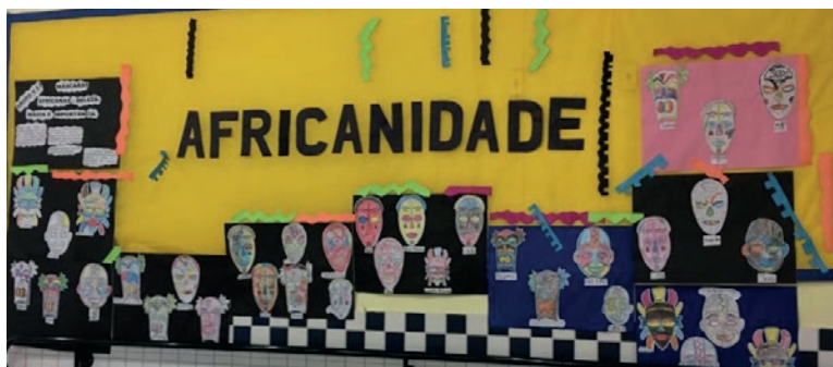
Figura 9: painel de chamada à exposição

De acordo com Corsino (2009, p. 8) “nada como a arte para aproximar o homem dele mesmo e do outro. A arte, nas suas mais diferentes manifestações: desenho, pintura, escultura, teatro, música, cinema, literatura, traz as sutilezas e riquezas do homem como indivíduo e como parte de um contexto sociocultural”. A arte nos afeta, nos provoca descobertas, conhecimentos, sentimentos, nos coloca em relação. Nos permite olhar com outros olhos e perceber que cada olhar é único, individual e merecedor de atenção, respeito e valorização. Assim como cada indivíduo é único e especial.