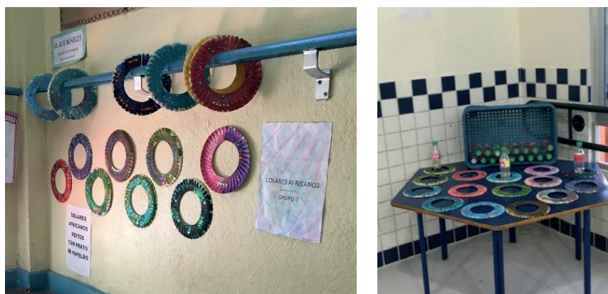
Figura 3: Os colares africanos e os chocalhos ao fundo, a exposição do G2

foram rasgados, amassados e saboreados pelas crianças. Todos os sentidos foram usados e explorados. Arte de corpo inteiro, com corpo e linguagem se relacionando de modo intenso. Também foram construídos chocalhos com potes de iogurte e mini garrafas de refrigerante do tipo pet, com contas (botões, miçangas), pedras e grãos. Os chocalhos foram expostos dentro de uma caixa plástica, dessas de verdura, e visitaram alguns espaços das diferentes salas de referência da instituição, levados por crianças e seus professores, propiciando a experimentação e diferenciação dos sons mais graves e mais agudos, a depender dos materiais com que eram confeccionados, e acompanharam a cantiga de músicas e melodias conhecidas das crianças.