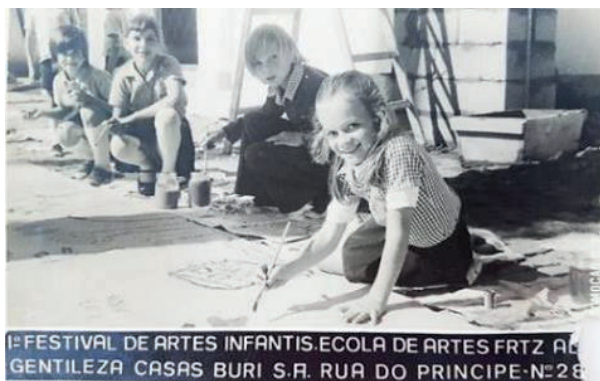
Figura 1: Cartaz do 1.º Festival de Artes Infantis da Escolinha de Joinville, em 1971

No primeiro ano da Escolinha, além de exposições em um restaurante e livrarias, realizou-se o 1º Festival (Coletiva) de Artes Infantis (figura 1), no salão da Secretaria de Educação e Cultura do município. A exposição obteve reconhecimento e sucesso na comunidade joinvilense, demonstrando a seriedade de um trabalho voltado à expressão e educação para crianças por meio da arte (STEFFEN, 1999).