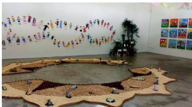
Figura 9: Foto da 46.ª Exposição da Escolinha na GMAVK 9

Ao analisar o projeto “O que é paz para mim?”, é possível identificar vestígios do modernismo no ensino da arte, como por exemplo nas ideias contidas em “Educação através da arte”, de Herbert Read, um dos principais influenciadores do MEA, que “dá ênfase à esfera emocional do indivíduo, valorizando a sua originalidade e expressão da personalidade [...]”. Nesta acepção, as artes visuais não eram entendidas como um fim, mas como um meio. Para Read [...], a arte deveria ser a base da educação” (LIBÂNIO, 2013, p. 14). Dessa forma, no projeto ora apresentado, a arte foi o caminho para o entendimento da Cultura de Paz.