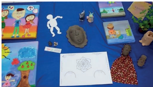
Figura 2: Mesa expositiva com exemplos de trabalhos das diferentes turmas e planta baixa (centro da foto, embaixo) do projeto expositivo da 46. a Exposição da Escolinha (2016) para compartilhamento com todas as turmas

Importante esclarecer que os temas também têm sofrido mudanças – o corpo docente vem levando em consideração as vozes das crianças, o que aparece em suas falas e fazeres artísticos, que revelam a influência de suas vivências cotidianas fora da sala de aula. Os títulos dos temas e a expografia dos trabalhos são mediados pelos professores, discutidos e então escolhidos pelas crianças (figura 2) quase no final do projeto, no momento em que a equipe docente considera que os educandos estejam familiarizados e envolvidos com as atividades e temática proposta.