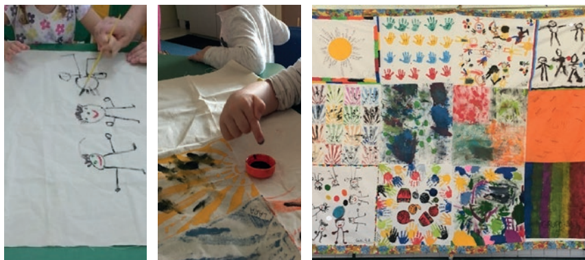
Figura 1: Processo de criação/pintura nas salas e os pedaços costurados no painel

Concordando com Diaz e Tonácio (2015, p. 1057) “acreditamos que a partir da educação literária podemos proporcionar [...] outras histórias, outras estéticas, outras formas de enxergar o mundo, desacostumando o nosso olhar do olhar eurocêntrico ao qual estamos acostumados e inseridos”. Olhar outras coisas, apreciar outras culturas, perceber outras formas de ilustração, outros coloridos, outros modos de relação. Literatura que propicia outros olhares.