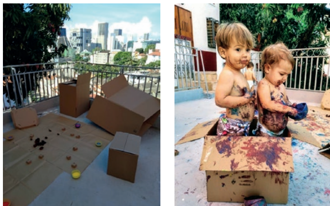
Figura 1: Eu e você, o que surge desse encontro 3