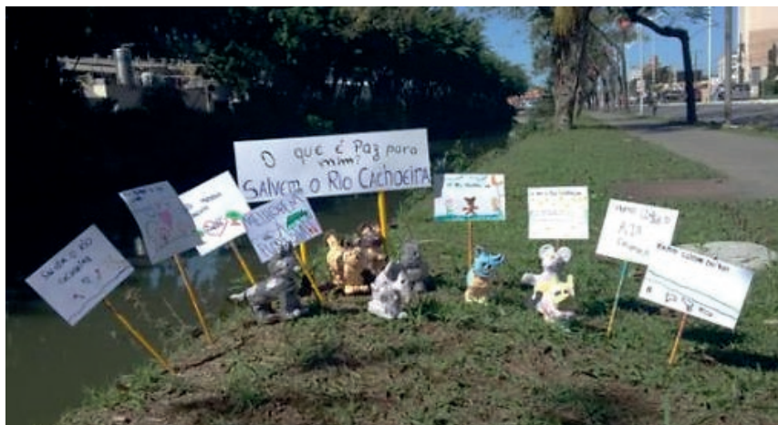
Figura 4: Intervenção urbana às margens do Rio Cachoeira com animais em cerâmica e cartazes produzidos pelos alunos de 6 anos