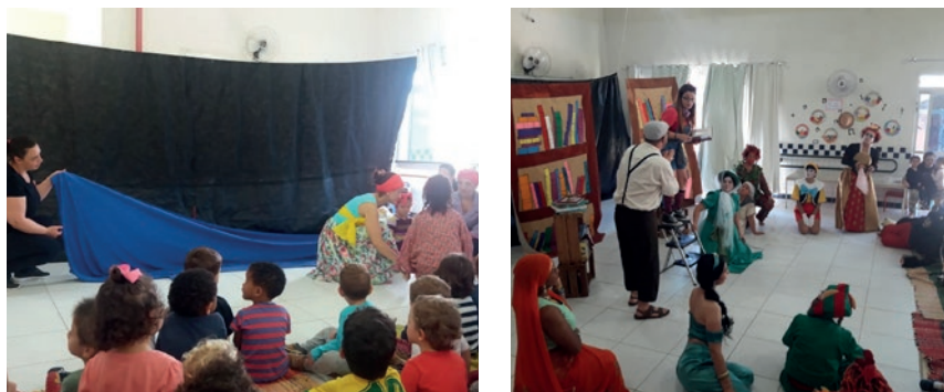
Figura 2: Teatro inspirado no livro Olelê e Teatro a Fantástica Exposição de Zeca

No mês de outubro em nosso NEIM, contamos ainda com a apresentação do espetáculo infantil: A fantástica exposição de Zeca, apresentado pelo grupo Trupe da Alegria. No enredo, a Trupe vem fazer uma exposição de livros no NEIM, porém, durante essa, os personagens saem dos livros e apresentam um pouco de suas histórias, culturas e tramas. Personagens de diferentes culturas: do Japão, da Índia, da Europa, da África e do Brasil, além dos tradicionais personagens dos contos de fadas, interagem com a plateia e com os demais personagens. Personagens que invadem a instituição e divertem crianças e adultos como a rainha de copas, a fada Fauna, o lobo mau, o índio da tribo guarani, a princesa Violeta, a feiticeira Kiriku, a benzedeira da Ilha da Magia, os personagens das histórias de Franklin Cascaes, a guerreira da tribo Maori, da Oceania e o trapaceiro Rumpelstiltskin, entre outros.