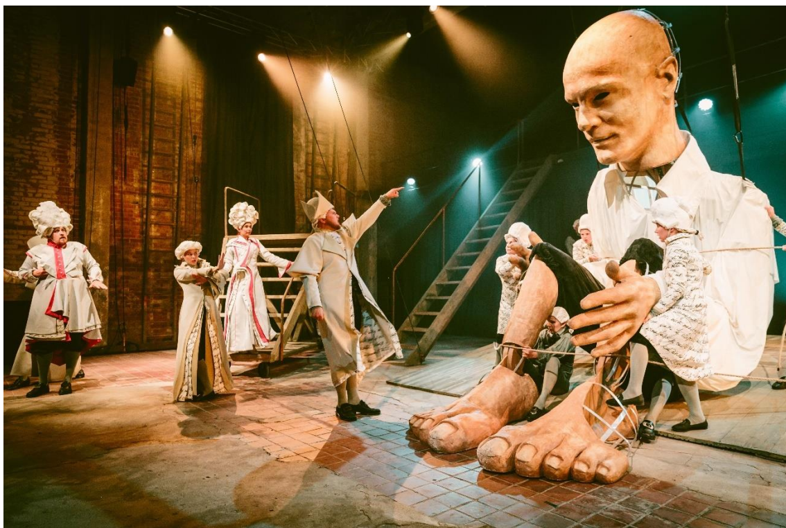
Figura 1 – Espetáculo Gulliver's Travels (2018, diretor Taavi Tõnisson) no Estonian Theatre for Young Audiences – o único teatro na Estônia que inclui consistentemente produções de Teatro de Animação e Teatro Visual em seu repertório.