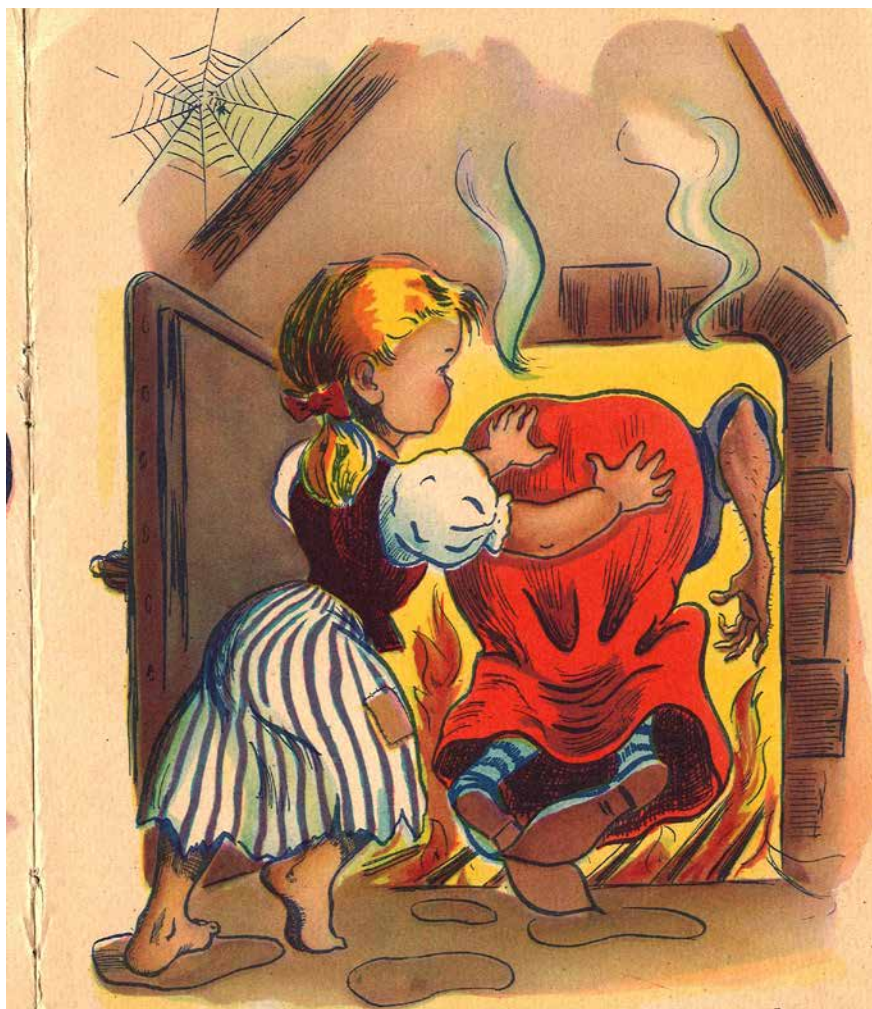
Ilustración sin autor. Casita de caramelo . Barcelona: Ed. Cervantes, 1959.

síntesis: unos niños perdidos, una tentadora Casita de Chocolate y dulces en medio del bosque, al acercarse y comer, caen en la trampa de la malvada bruja, el niño es encerrado en una jaula para engordar y ser así comida de la Bruja, la niña pasa a ser sirvienta, pero consigue la llave y engaña a la Bruja a la que empuja para que perezca quemada en el horno, pueden escapar y hasta se hacen con el tesoro de la malvada.