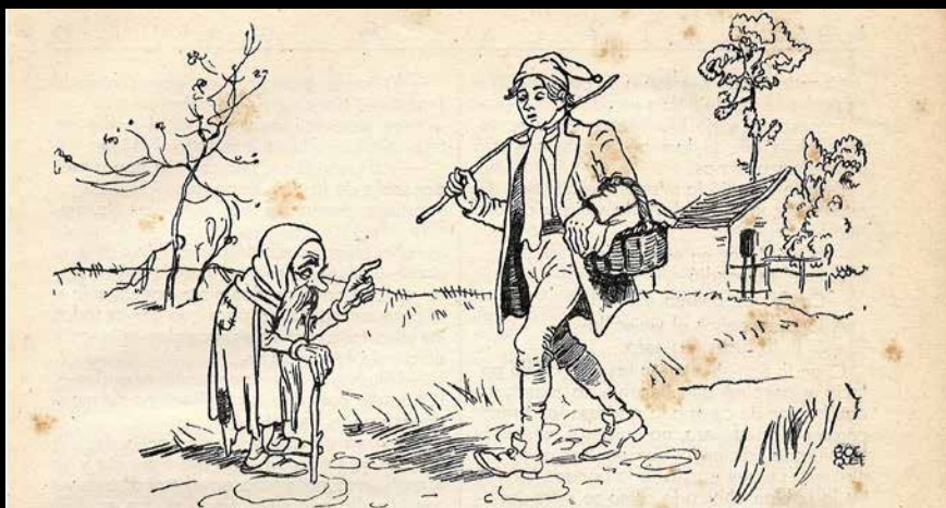
Ilustración de Bocquet en Cuentos de hadas , de Grimm. Barcelona: Ed. Molino, 1942.

Ilustración de Asha. Pulgarcito . Colección cuentos en colores. Ed. Ramón Sopena, 1930.