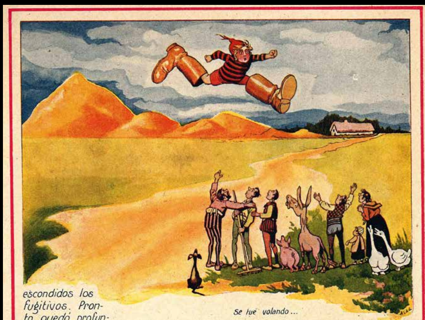
Ilustración de Asha. Pulgarcito . Colección cuentos en colores. Ed. Ramón Sopena, 1930.

Titiriteros de Binéfar (Binéfar – España)