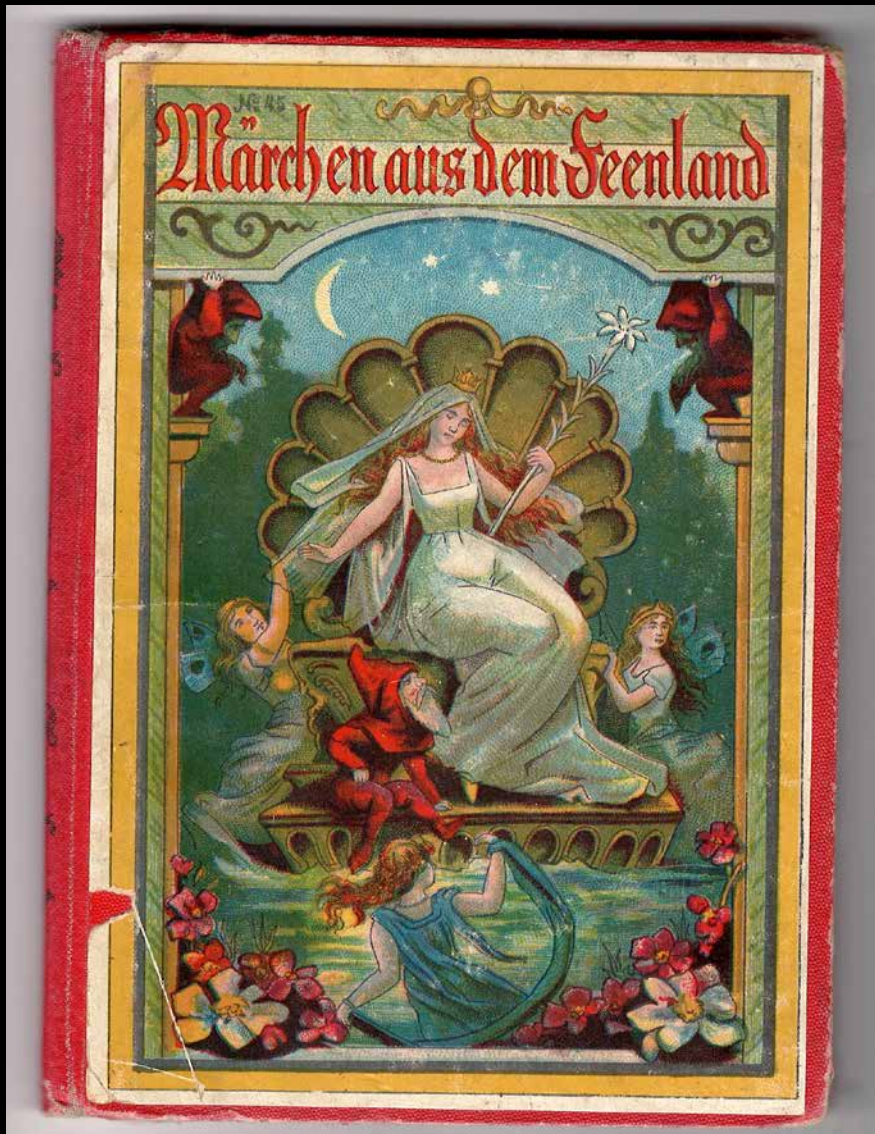
Libro Alemán – Cuento de hadas . Berlín, 1907.