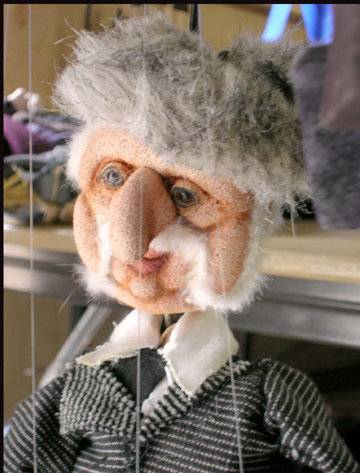
Le Voyage de Tchekhov à Sakhaline (2013). Atelier recherche/creation marionnettique de Québec (ARCMQ). Direção Patrice Freytag.

Patrice Freytag PhD – Université Laval (Quebec)