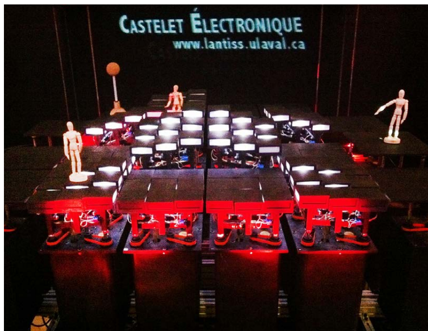
Le Castelet électronique. Laboratoire des nouvelles technologies de l'image, du son et de la scène (LANTISS) Coordenado por Patrice Freytag.

especializados em relação com a cena tecnológica. A singularidade desta infraestrutura repousa sobre os estreitos elos existentes entre a Universidade e o meio da criação no Quebec, ativo nas pesquisas que envolvem novas tecnologias. Mais de vinte pessoas se envolveram neste projeto, entre pesquisadores de laboratórios de Robótica, visão e sistema digital, Ótica Fotônica e laser da Universidade Laval. São igualmente parceiros do laboratório os pesquisadores do Conselho Nacional de Pesquisas do Canadá (CNRC), as equipes de pesquisa/ criação do Avatar e do Ex-Machine , e também os artistas-pesquisadores e os professores membros do LANTISS. Este laboratório tem como principal missão examinar as malhas teóricas e práticas entre as artes da cena e as tecnologias de ponta. Ele sustenta projetos de criação de novas linguagens cênicas e o estudo das percepções engendradas pelo recurso dessas novas tecnologias em um espaço cênico não tradicional.