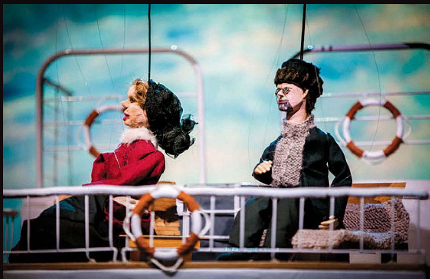
Le Voyage de Tchekhov en répétition . Laboratoire des nouvelles technologies de l'image, du son et de la scène (LANTISS). Dirigido por Patrice Freytag.