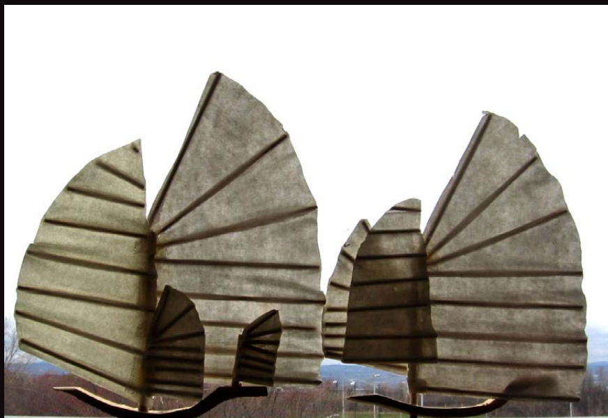
Le Voyage de Tchekhov à Sakhaline (2013). Atelier recherche/creation marionnettique de Québec (ARCMQ). Direção Patrice Freytag.