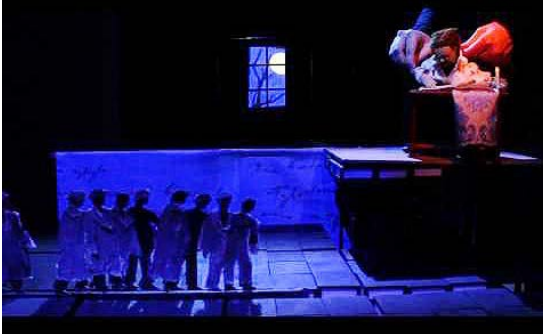
Le Voyage de Tchekhov à Sakhaline (2013). Atelier recherche/creation marionnettique de Québec (ARCMQ). Direção Patrice Freytag.

computador, permitia reproduzir todo o alcance das cores ordinariamente produzidas pelos filtros profissionais. O castelet contava com aproximadamente quarenta e oito fontes de luz perfeitamente controláveis de modo independente no que concerne à intensidade luminosa e à crominância. A circulação dos fluxos luminosos era feita por fibras óticas 12 .