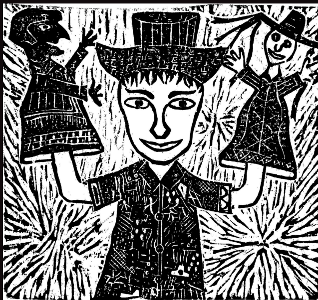
Bonequeiro. Xilogravura de Valdeck de Garanhuns.