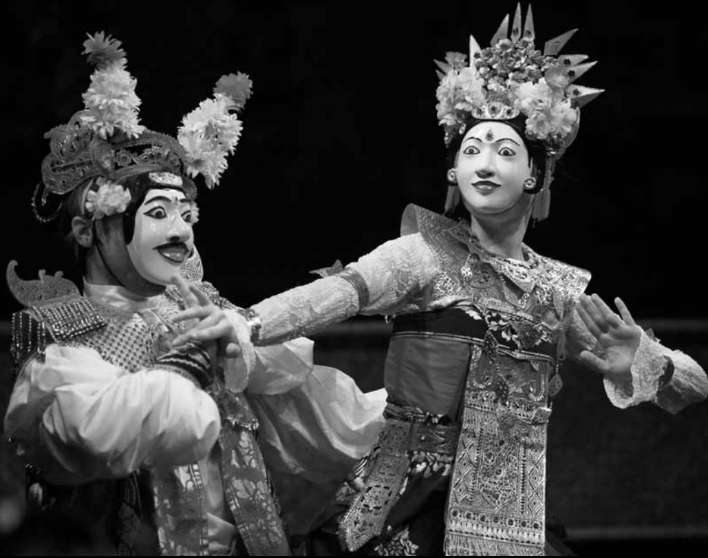
PÁGINAS 185 e 186: Bali Dream (2012). Direção de I Nyoman Sedana.