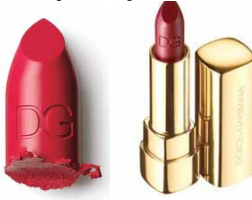
Figura 1: Batom Dolce & Gabbana.

Miuccia Prada (in: THOMAS, 2008, p. 248, tradução nossa) ressalta a importância do logotipo, dizendo que é totalmente impossível eliminá-lo, ou seja, uma marca de luxo não pode sobreviver sem um 'logo'. "O reconhecimento da marca é demasiadamente importante. Quanto maior o seu desejo de expansão, maior a necessidade de usar o logotipo."