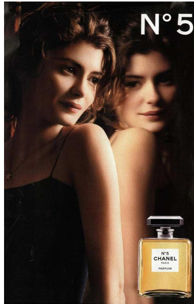
Campanha Chanel n°5 com Audrey Tatou, 2009.