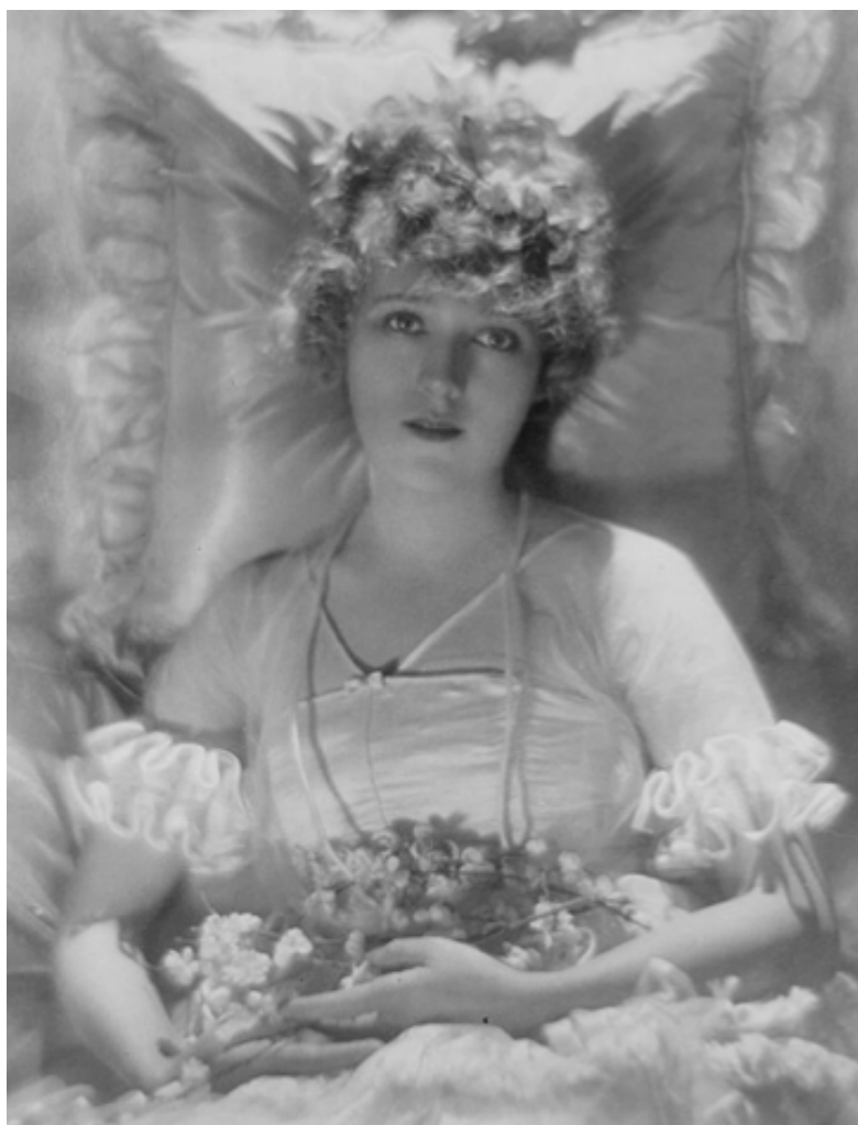
Imagem 1 - Mary Pickford, por Baron Adolf De Meyer (1920)

Fonte: http://www.npg.org.uk/glamour/glamour_handlist_new.pdf