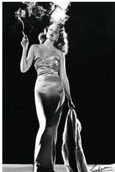
Imagem 3 - Rita Hayworth, por Robert Coburn ( Gilda , 1946)

Fonte: http://www.npg.org.uk/glamour/1940s.htm