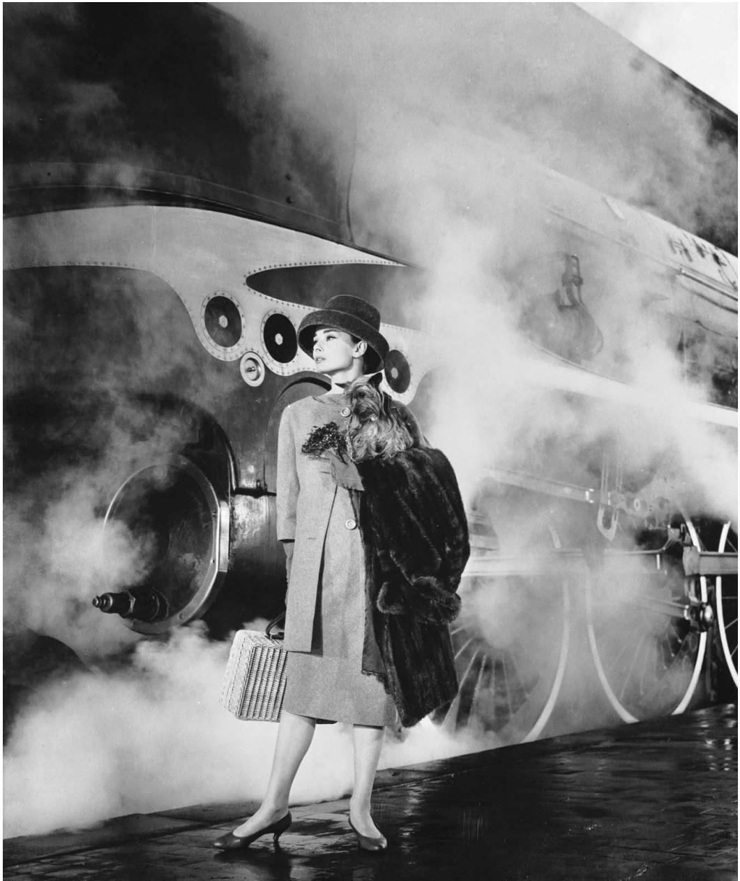
Imagem 5 - Audrey Hepburn por Richard Avedon ( Funny Face , 1956)