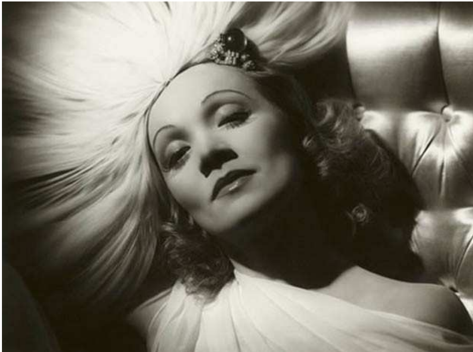
Imagem 2 - Marlene Dietrich, por George Hurrell (1937)

Fonte: http://ffw.com.br/noticias/exposicao-em-londres-mostra-era-dourada-de-hollywood/