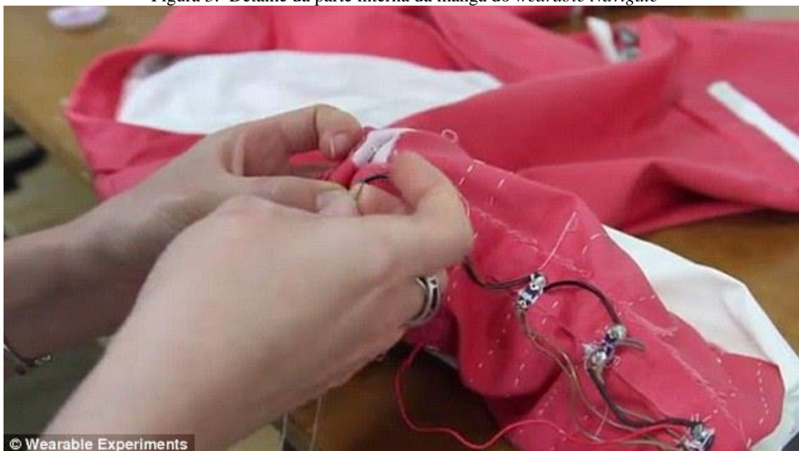
Figura 3: Detalhe da parte interna da manga do wearable Navigate