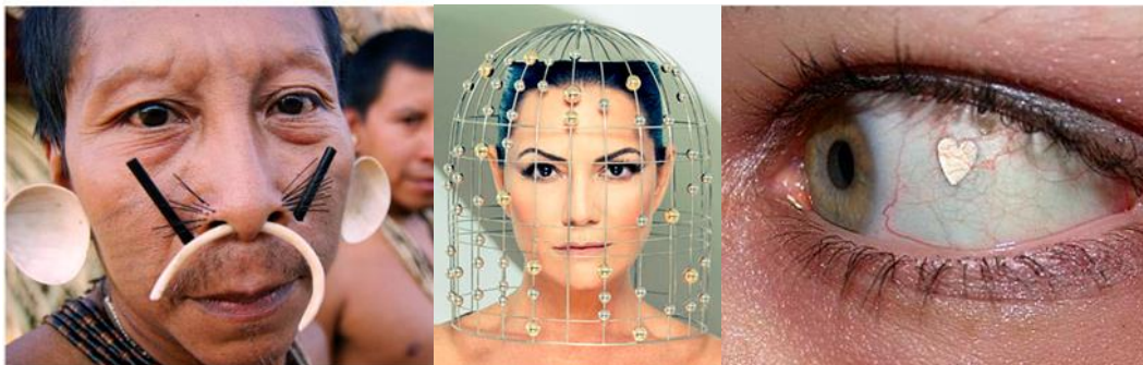
Figura 12 - Índio matis, ornamentos de corpo, Amazônia.

Diferente da referência inicial destinada aos ornamentos corporais, esses podem ser inseridos na mesma denominação, só que agora com ressignificação relacionada ao inovador e não mais ao histórico rudimentar ou primitivo do passado. Com o avanço industrial e digital, e pela introdução do design no país, as concepções desses ornatos se modificaram com a evolução dos tempos.