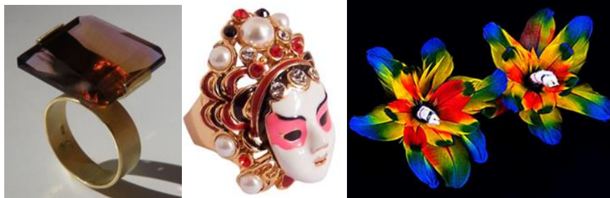
Figura 4 - Joia, anel Desejo de Mãe, Sagrado Profano.