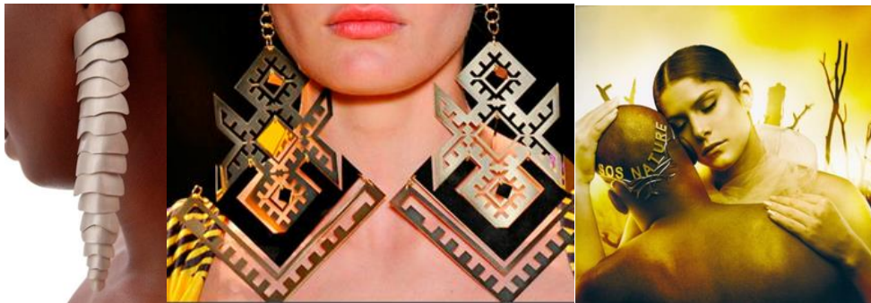
Figura 15 - Joia, brinco cerrado, Cerrado Mix.

Outra situação da mesma forma capciosa e que é fruto de um marketing mais agressivo que não traduz a realidade é compreender que realmente diamantes são eternos, mas as outras gemas são também. O valor está vinculado ao sistema de extração dos minerais e à raridade com que as pedras são encontradas na natureza, além de qualidades como cor, dureza, transparência e lapidação. Isso também vale para diamantes. É oportuno lembrar que o que vai regular o mercado será geralmente o volume de oferta versus procura. Assim, podemos ter um diamante de qualidade ruim, ou seja, de baixo valor quando comparado à outra gema qualquer. No país infelizmente a escassez literária no que se refere aos adornos torna mais delicado ainda resgatar a história da bijuteria ou dos ornamentos corporais. Porém, a partir de acervos de museus, quadros, desfiles, livros históricos e de arte, revistas e filmes se encontram evidências que possibilitam alguns novos entendimentos para esses atavios.