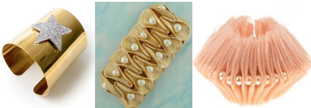
Figura 1 - Joia, bracelete Mulher Maravilha, Joalheria Noir e DC Comics.

muitas vezes incalculáveis em termos de patrimônio cultural. Nesse sentido, muitas técnicas e mestres artesões estão se perdendo. Os contínuos avanços tecnológicos alteram a forma como produtos são fabricados, comercializados e usados na sociedade, porém isso não justifica o abandono da preservação de um passado histórico. Como agir diante da escassez de literatura e pesquisa científica que vigora no país? No Brasil, a conjunção de qualidades como criatividade, vocação para o artesanal e a diversidade de materiais deveria fazer parte das iniciativas de forma mais incisiva. E se esse conjunto estivesse associado a investimentos em educação, a pesquisa e a uma economia criativa poderia gerar possibilidades interessantes de desenvolvimento com bases seguras e inovadoras.