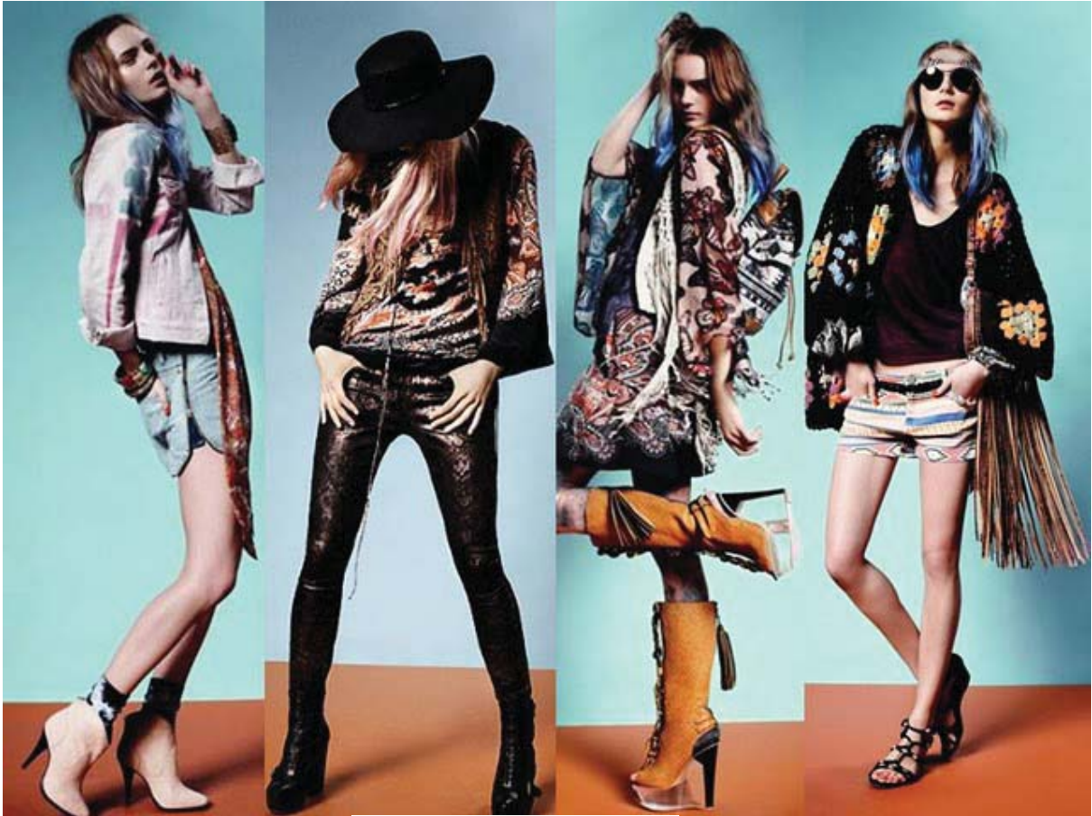
Figura 01: couro e camurça