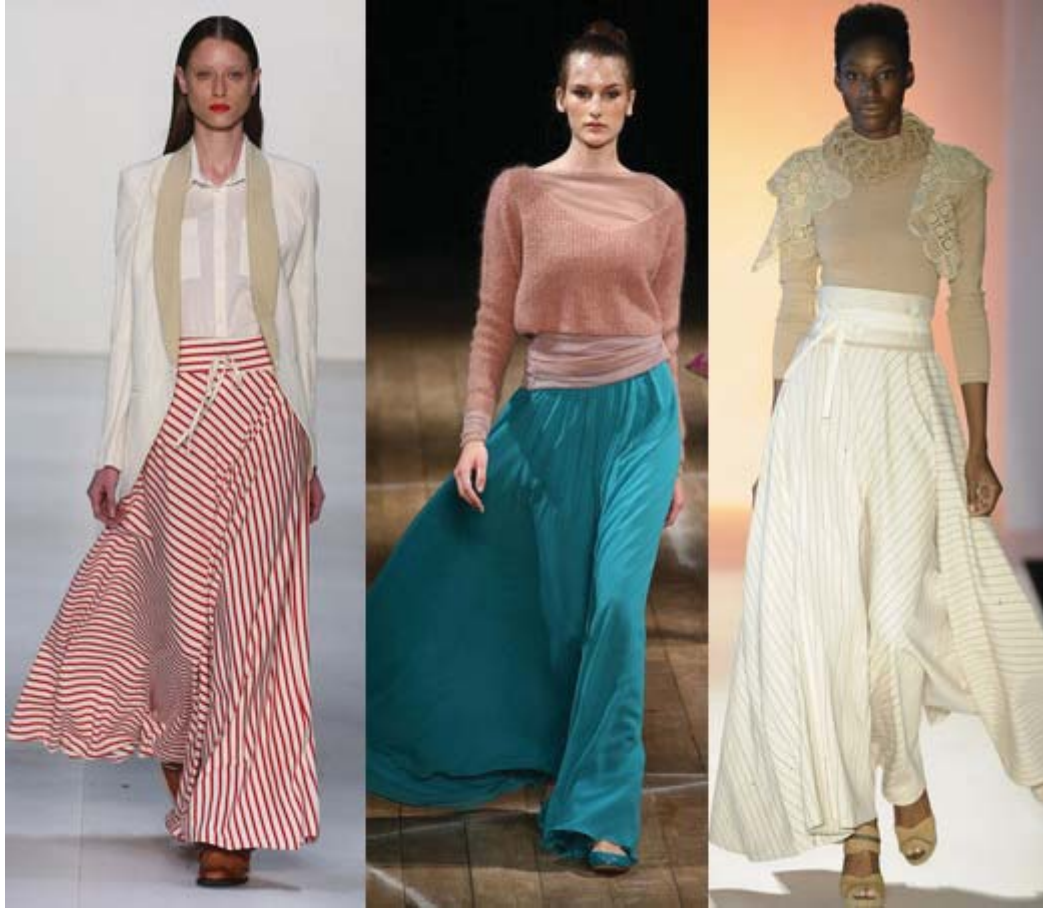
Figura 02: saia longa