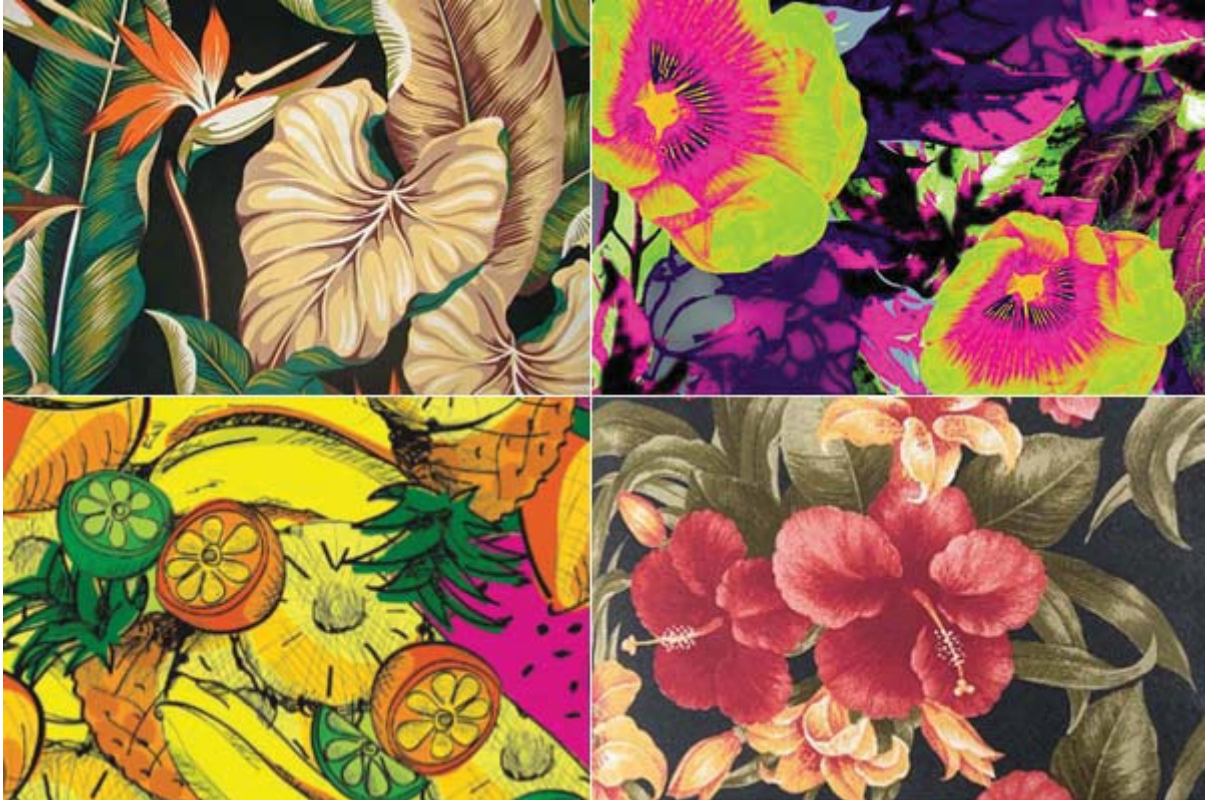
Figura 03: estampa tropical