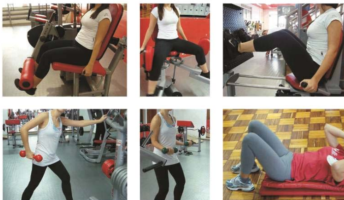
Figura 5 – Análise de Uso 2