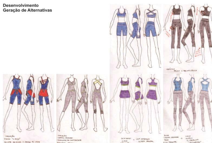
Figura 9 - Geração de Alternativas

Nesta etapa, buscou-se algo diferente do croqui tradicional. Entre várias técnicas de processo criativo, Treptow (2007) sugere o método das bonecas de papel, que foi adaptado para esta fase do projeto. Foram desenvolvidos desenhos em papel manteiga, sobre a silhueta de “bonecas” em diferentes vistas. Depois foram coloridos formando composições e combinações entre as peças.