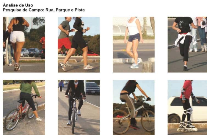
Figura 4 – Análise de Uso 1

Dando continuidade a etapa de análises, realizamos a análise de uso. Esta análise foi feita através de uma pesquisa de campo. Foram observadas usuárias em diferentes situações e lugares. Primeiramente a análise foi feita, na rua e no parque em uma tarde de domingo, e posteriormente foi feita em uma academia na parte da manhã. Em todas as situações as usuárias eram abordadas e informadas sobre a análise, explicando que se tratava de verificar qual o tipo de roupa utilizada por elas em momentos de lazer e na prática das atividades físicas, e que também eram analisadas as peças e suas partes durante os seus movimentos. Foram realizadas conversas com essas usuárias, elas apontaram os aspectos positivos e negativos dos produtos que utilizavam, informavam suas preferências, porque compravam ou utilizavam determinadas peças e porque deixavam de comprar.