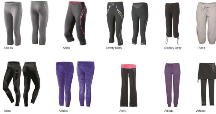
Figura 1 – Análise Sincrônica