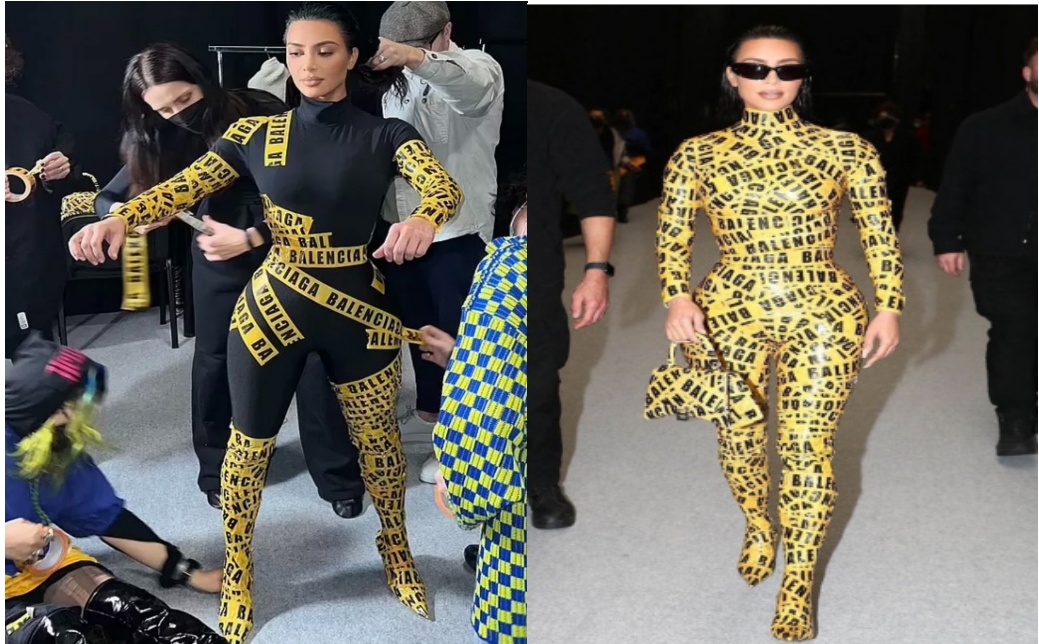
Figuras 3 e 4. A preparação e o traje de fita de isolamento

A vestimenta justa e utilizável apenas uma vez, produzia barulho quando a modelo se deslocava e claramente limitava seus movimentos. Convidados do desfile registraram seu andar em vídeos e em fotos, compartilhando nas redes o evidente desconforto da modelo ao caminhar com o traje Balenciaga.