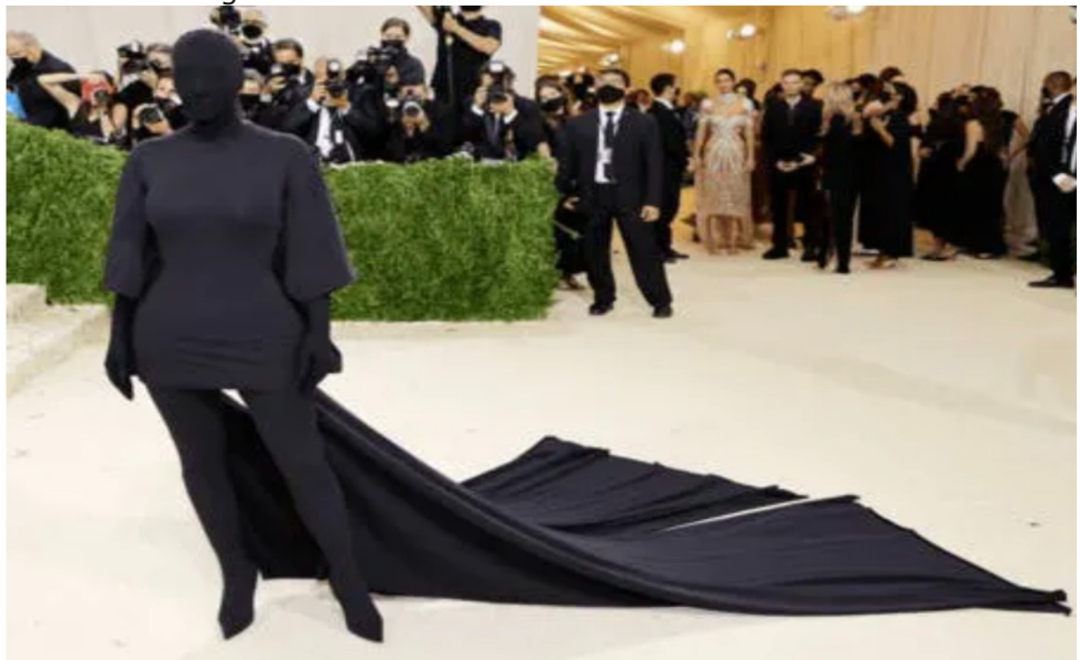
Figura 1. Kim Kardashian en el Met Gala 2021