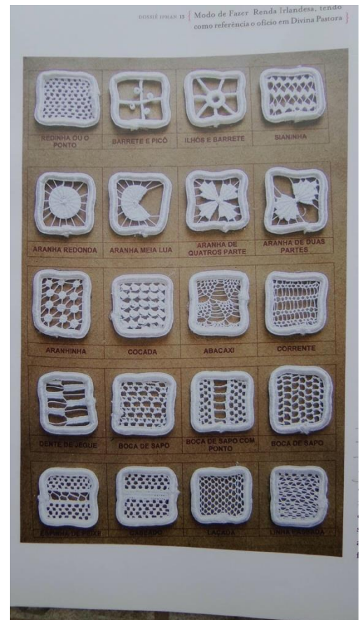
Figura 3. Mostruário de Pontos da Renda Irlandesa