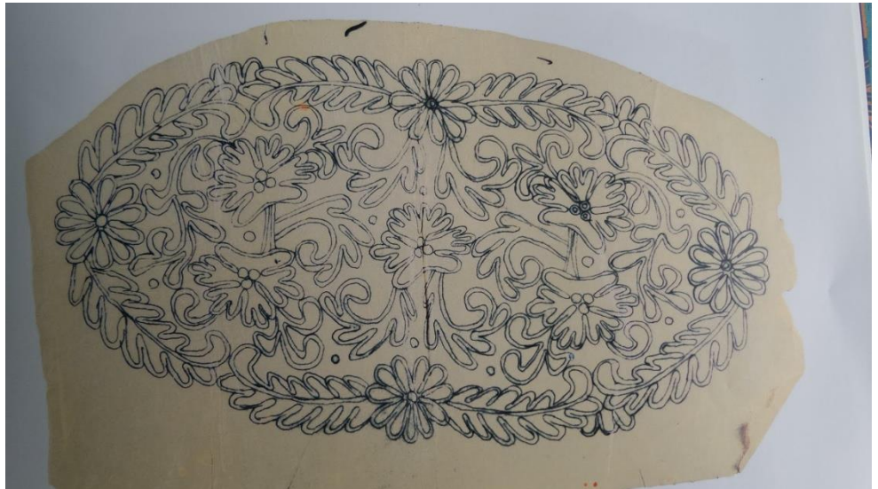
Figura 4. Debuxo para Pano de Bandeja

Fonte: Figueiredo e Zacchi, 2013, p. 109.