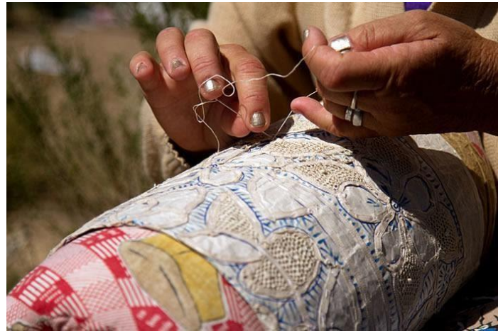
Figura 1. Confeção da Renda Renascença