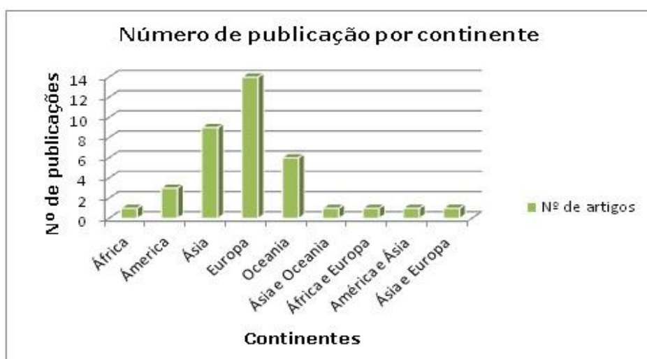
Figura 2. Publicação de artigos por continente e suas parcerias.

A Figura 2 demonstra o número de artigos publicados de cada continente e as parcerias realizadas entre continentes.