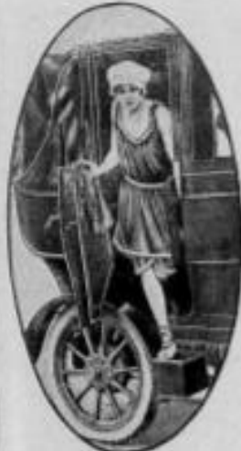
Alguns modelos (sua-se condão o Caballero até ao mar, ou frega de vela, dentro de um fardo de "Lambade").

...das, rias d'amar. As praias eilas eilas, O amor é a moda. Porque o amor é belo. Já disse o d'altis- simo Pederneiras: Leal e casto, bombrs a Sordado E o Nalvas Brancos ou dos Ilhéidos E o clero como os outros percutidos E as gentes que vem de Moedade. Escolhe um fardo de uma tem- pestade Lembra o coração dos Parvencidos E esse minibus longo e hatido Pra girar que vem para a Madade.