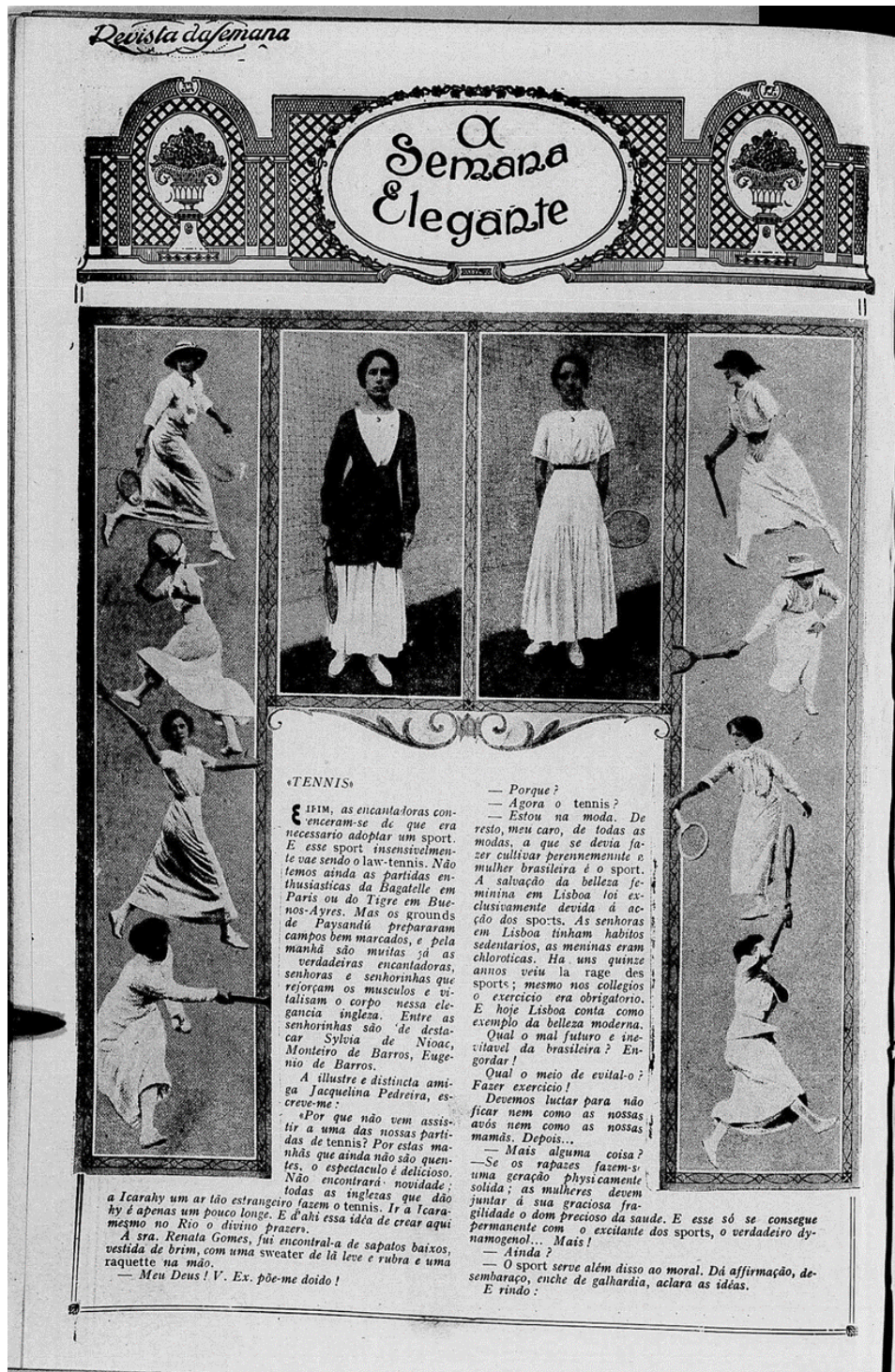
A REVISTA DA SEMANA. Rio de Janeiro. n. 31, 09 set. 1916.