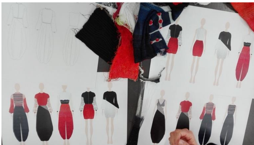
Figura 8. Croquis coloridos em Illustrator com amostras de malha realizados na disciplina de Conti (2017).