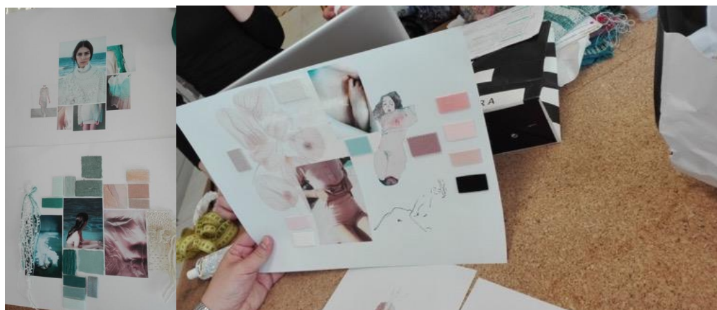
Figura 3. Moodboards com imagens de produtos de moda realizados na disciplina de Conti (2017).

Embora Conti prefira não trabalhar referências imagéticas de produtos de moda, como aquelas extraídas de editoriais de revistas, elas ainda aparecem nos moodboards de alguns alunos.