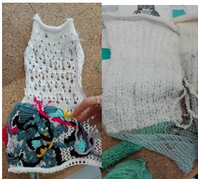
Figura 4. Amostras para teste de malha da etapa de prototipagem realizadas na disciplina de Conti (2017).

primeiro ano do curso de moda, ao contrário da prática de Conti, da qual o desenvolvimento de produtos para a coleção final dos seus orientandos depende.