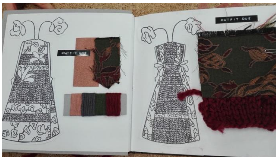
Figura 2. Exemplo de concept realizado na disciplina de Conti (2017).