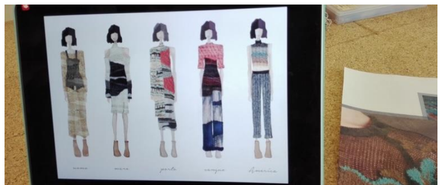
Figura 7. Croquis coloridos em Illustrator realizados na disciplina de Conti (2017).

Durante o desenvolvimento do trabalho no Politecnico di Milano , os alunos apresentam desenhos coloridos que expressam suas ideias acompanhados das amostras de malhas que desenvolveram. Dessa forma, o aluno expõe seu processo em sessões de orientação nas quais exhibe e relaciona seus desenhos, suas amostras e possibilidades de uso de maquinário, explorando seu conceito. É exigido que os alunos apresentem desenhos coloridos e fichas técnicas com as medidas das partes que compõem uma peça.