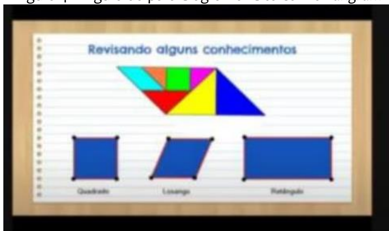
Figura 4 – Figura do paralelogramo feito com o Tangram