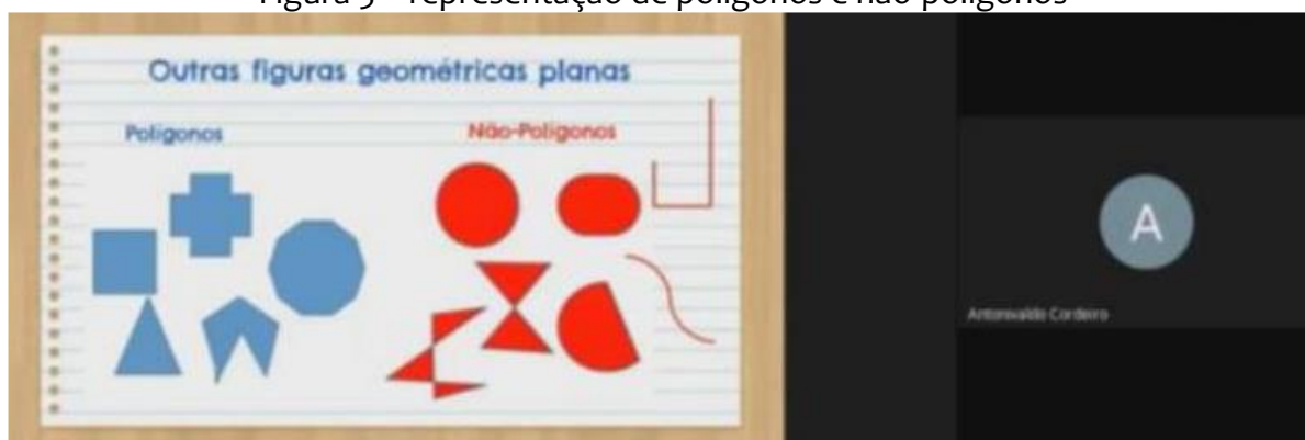
Figura 5 – representação de polígonos e não-polígonos