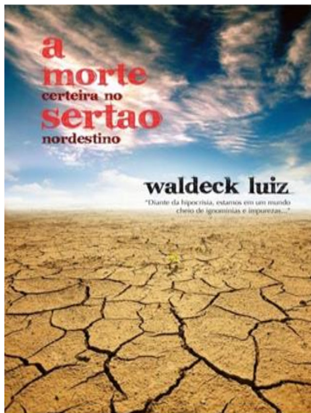
Figura 3: Capa do livro A morte certa no sertão nordestino , de Waldeck Luiz (2003). Reprodução. Acervo do autor.

No livro A morte certa no sertão nordestino , Waldeck Luiz (2003) aborda de forma estereotipada que a seca no Nordeste é causadora de mortes, o que na atualidade não ocorre mais, principalmente em virtude de programas de convivência com a seca, do êxodo rural e de programas sociais do Governo Federal. Livros didáticos de História ainda apresentam fortes representações de estereótipos sobre o Nordeste, com imagens que causam choque logo em suas capas, mostrando mortes, o chão seco, animais em estado deplorável, etc.