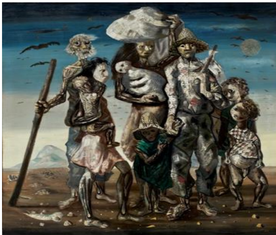
Figura 3. Os Retirantes , de Cândido Portinari, 1944. Reprodução. Acervo do autor.

Da literatura, partimos para uma análise artística de representação do Nordeste, a pintura, por meio da obra Os Retirantes , de Cândido Portinari, produzida em 1944. Na obra, Portinari expõe o sofrimento dos migrantes, representados por figuras macérrimas e com expressões que transmitem sentimentos como a fome e a miséria.