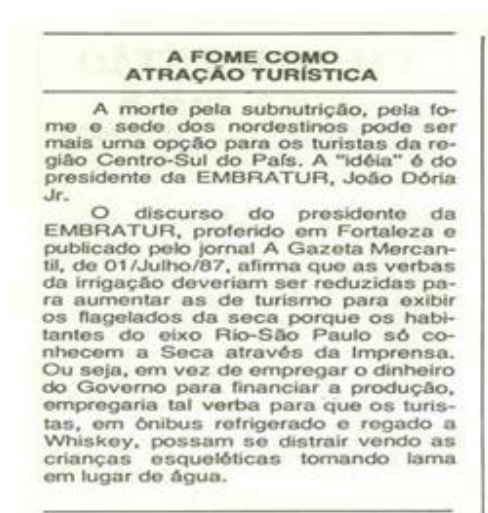
Figura 1: Revista Agropecuária Tropical . Edição set./out. de 1987, 58ª ed. p. 23.

Na ilustração a seguir, o então presidente da EMBRATUR, durante uma entrevista à revista Agropecuária Tropical , sugere que em plena década de 1980 do século XX se enalteça o turismo da seca, onde a principal atração seria ver os nordestinos morrendo de fome e sede. Uma notável demonstração de total desconhecimento, vinda de um jovem empresário de São Paulo, impulsionado pela imagem distorcida da região e de seu povo, além de uma proposta desumana e desrespeitosa. Vejamos a imagem que propõe investir no turismo das mazelas da seca, mostrando para estrangeiros e pessoas de outras regiões do país o sofrimento no Nordeste.