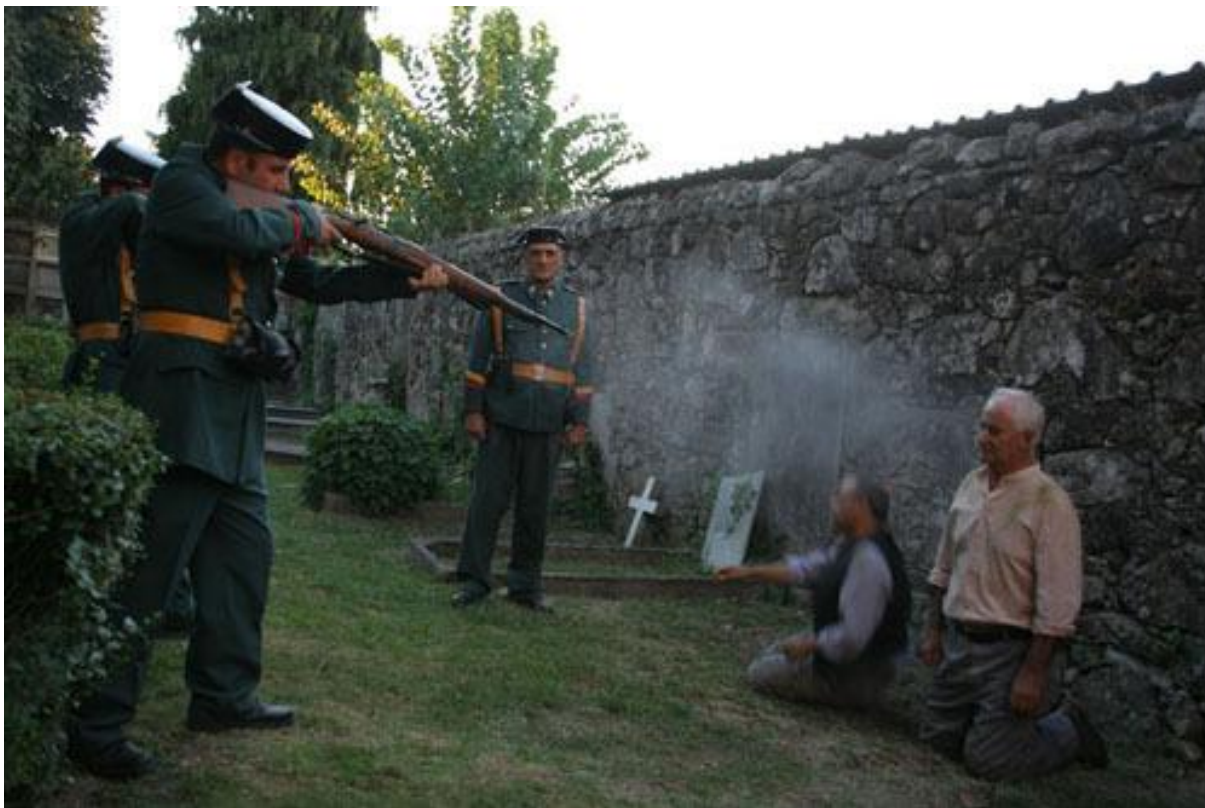
Ilustración nº 2. José Antonio Primo de Rivera: “Hay veces en la vida en que se acaban los razonamientos y sólo queda la dialéctica de los puños y las pistolas”.

pequeños actos de resistencia que, en defensa de la legalidad, se fueron produciendo por todo el territorio. A partir de aquí, comienza la lenta sangría de muertos: los muertos oficiales y los muertos clandestinos o desaparecidos.