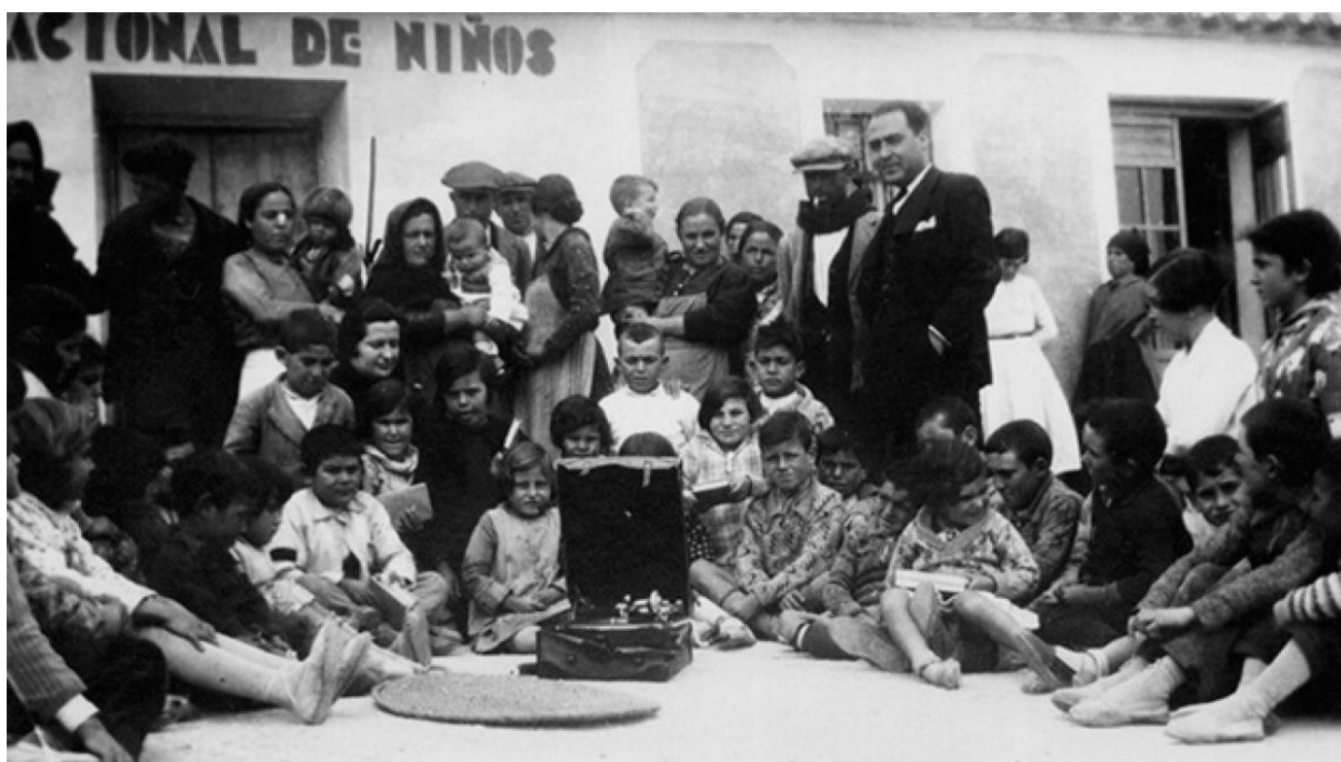
Ilustración nº 4. Las Misiones Pedagógicas representan la preocupación de la República por la democratización de la cultura.