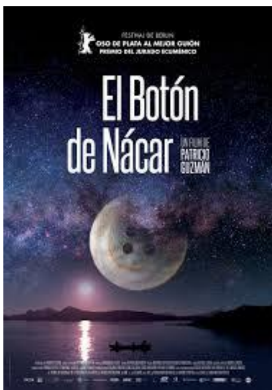
Ilustración nº 5. El botón de nácar (2015), un trabajo reciente de Patricio Guzmán plantea el drama chileno de la violencia de estado.

En En nombre de Dios (1987) 42 nos muestra el impresionante movimiento de masas que se generó contra Augusto Pinochet en 1985 en los barrios populares, universidades, sindicatos de Santiago. Un movimiento de contestación popular que fue acompañado ejemplarmente por la Iglesia católica chilena a través de la “Vicaría de la Solidaridad”, enfrentada a la dictadura militar, y soporte solidario de equipos de asistentes sociales y abogados para defender a los presos ante los tribunales y tratar de localizar los cuerpos de los “desaparecidos”.