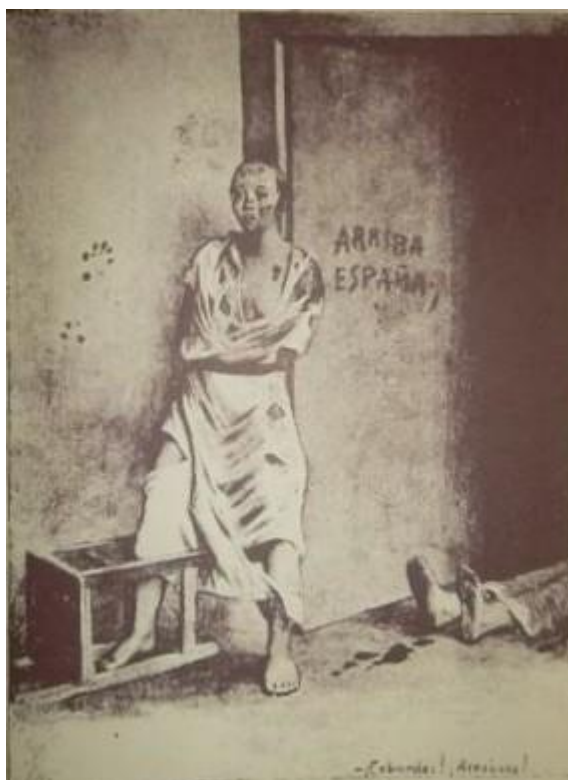
Ilustración nº 3. “Cobardes, asesinos!”. Estampa del álbum Galiza Mártir (Castelao, 1937). Grito desgarrador femenino en la denuncia internacional de la represión franquista en Galicia.