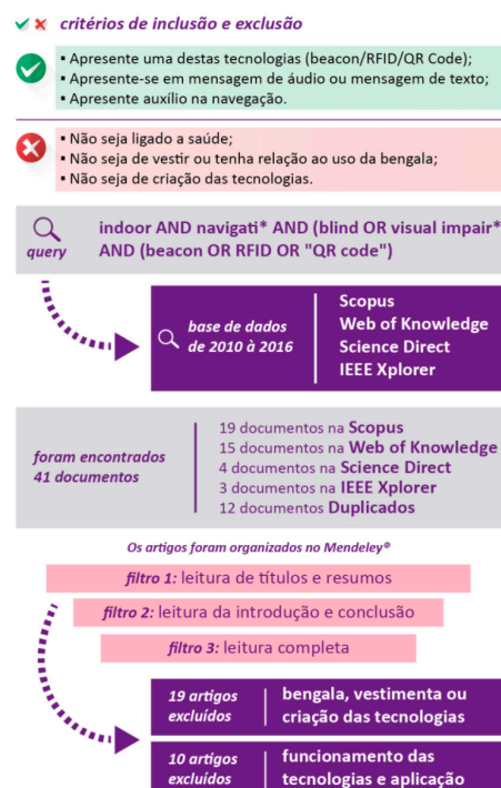
Figura 1: Sistematização do método utilizado.

As palavras chaves deveriam permitir a busca do tema proposto, por isso, foram selecionadas as seguintes palavras: indoor, navigation, blind, visual impairment, beacon, RFID e "QR code". De forma que elas obedecessem a seguinte query: indoor AND navigati* AND (blind OR visual impair*) AND (beacon OR RFID OR "QR code") . A pesquisa foi realizada no dia 3 de novembro de 2016 e foi definido que os artigos a serem analisados seriam de 2010 até a data da pesquisa. A busca foi realizada em quatro periódicos relacionados à área do Design: Scopus, Web of Knowledge, Science Direct e IEEE Xplorer . Nessa busca, foram encontrados 41 artigos, destes 12 eram duplicados, ou seja, se encontravam em mais de uma base de dados. Para a seleção dos artigos que interessavam ao escopo da pesquisa, usou-se os parâmetros de inclusão e exclusão previamente definidos e a criação de três filtros que serviriam para conhecer o conteúdo dos artigos a serem analisados. Estes filtros foram: (a) a leitura do título e o resumo, (b) a leitura da introdução e conclusão e (c) a leitura completa dos artigos. Dos 29 artigos pré-selecionados, 19 não coincidiam com os parâmetros de inclusão e foram descartados da pesquisa.